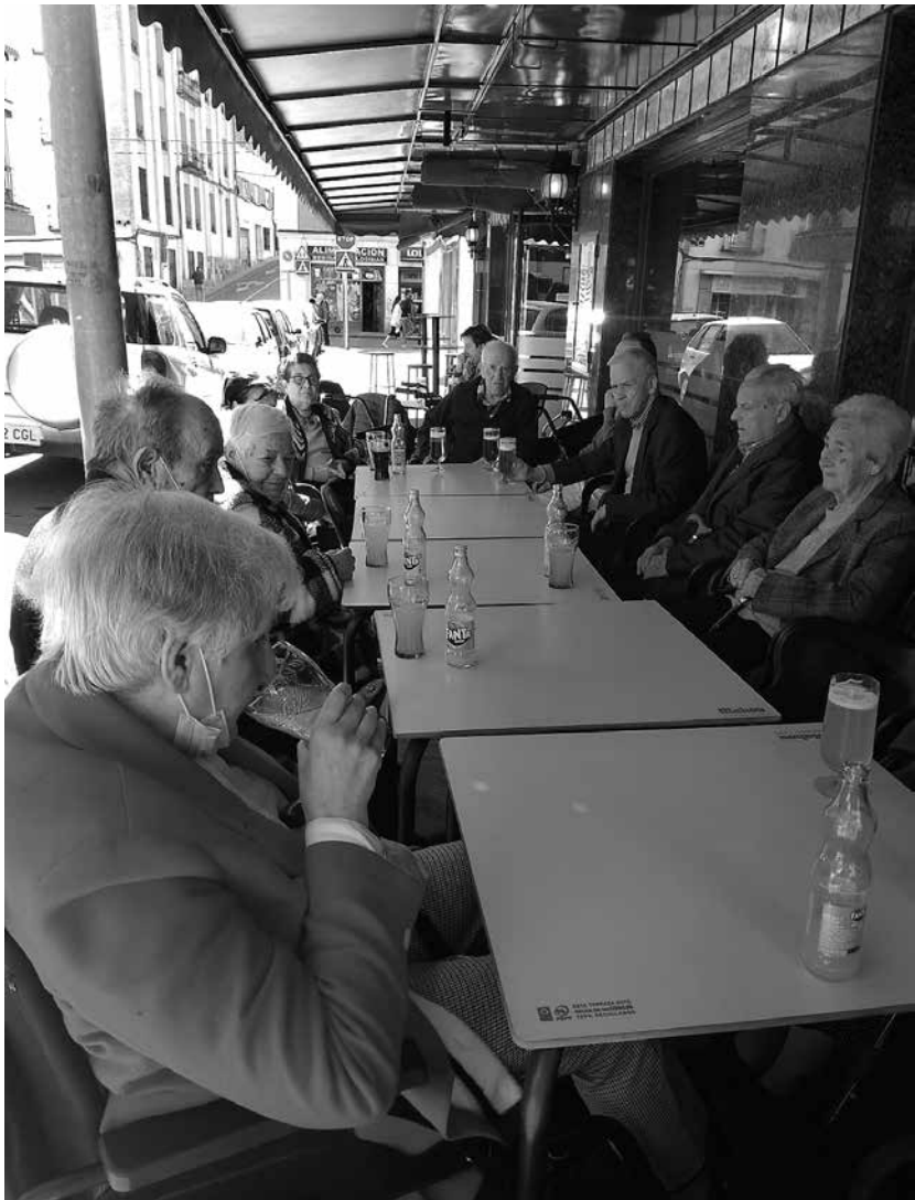
Tomando un aperitivo durante una excursión.

Las actividades extraordinarias han sido las protagonistas durante estos meses y es que, como ya hemos dicho en numerosas ocasiones, son las preferidas de nuestros mayores. Por ello, aprovechamos cualquier oportunidad para realizar una salida al exterior como, por ejemplo, a la feria del libro celebrada en la Plaza España de la ciudad. Siempre es un buen plan para pasar una mañana agradable y comprar algún libro. También visitamos una exposición celebrada con motivo del Día de la Mujer. Sin olvidar el Día de la Madre, en el que mediante detalles elaborados por los residentes homenajeamos a esas madrazas que tenemos en el centro. Las rondallas son otra de las actividades que más alegra a nuestros residentes y usuarios de centro de día, y es que, con la llegada de mayo llegan las tardes de música amenizadas, en esta ocasión por Los rondadores, Pulso y púa y Los arrabales. Unos meses llenos de alegría y actividad que continuarán con la llegada del verano durante el que continuaremos realizando salidas al exterior, así como actividades al aire libre. Por otro lado, tenemos que destacar otra de las actividades extraordinarias que más gustó a nuestros mayores el año pasado y que este año volveremos a repetir con ilusión, ¡los campamentos intergeneracionales! Los niños siempre traen alegría y se crea un vínculo muy especial entre ambas generaciones.