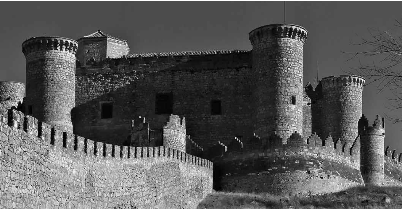
El castillo de Belmonte.

Belmonte es un pueblo situado en la provincia de Cuenca, en la comunidad autónoma de Castilla-La Mancha. Uno de sus lugares más emblemáticos es el Castillo, una imponente fortaleza medieval construida en el siglo XII, que fue declarada Monumento Nacional en 1931. Desde la cima, podrás disfrutar de impresionantes vistas panorámicas del pueblo y de sus alrededores. Otro sitio de interés es la iglesia de Nuestra Señora de la Asunción, una construcción del siglo XVI de estilo gótico-renacentista. Sus fiestas más importantes se celebran en San Bartolomé,