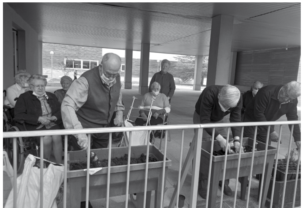
Residentes y usuarios de centro de día durante el taller de jardinería.

Como ya hemos mencionado en alguna ocasión, el compromiso con el medioambiente es un aspecto muy importante en nuestro día a día. Por ello, quisimos celebrar algunos de los días más simbólicos relacionados con el tema como el Día de la Primavera, esa época tan bonita y alegre. Para festejarlo elaboramos un bonito photocall en el que se podía leer: bienvenida primavera; acompañado de unas bonitas flores y abejas. También quisimos conmemorar el Día del Reciclaje elaborando comederos para pájaros que dispusimos por los árboles del jardín. Por último, volvimos a llenar nuestras macetas, esta vez con plantas aromáticas cedidas por el vivero central de Cuenca para homenajear el Día del Árbol.