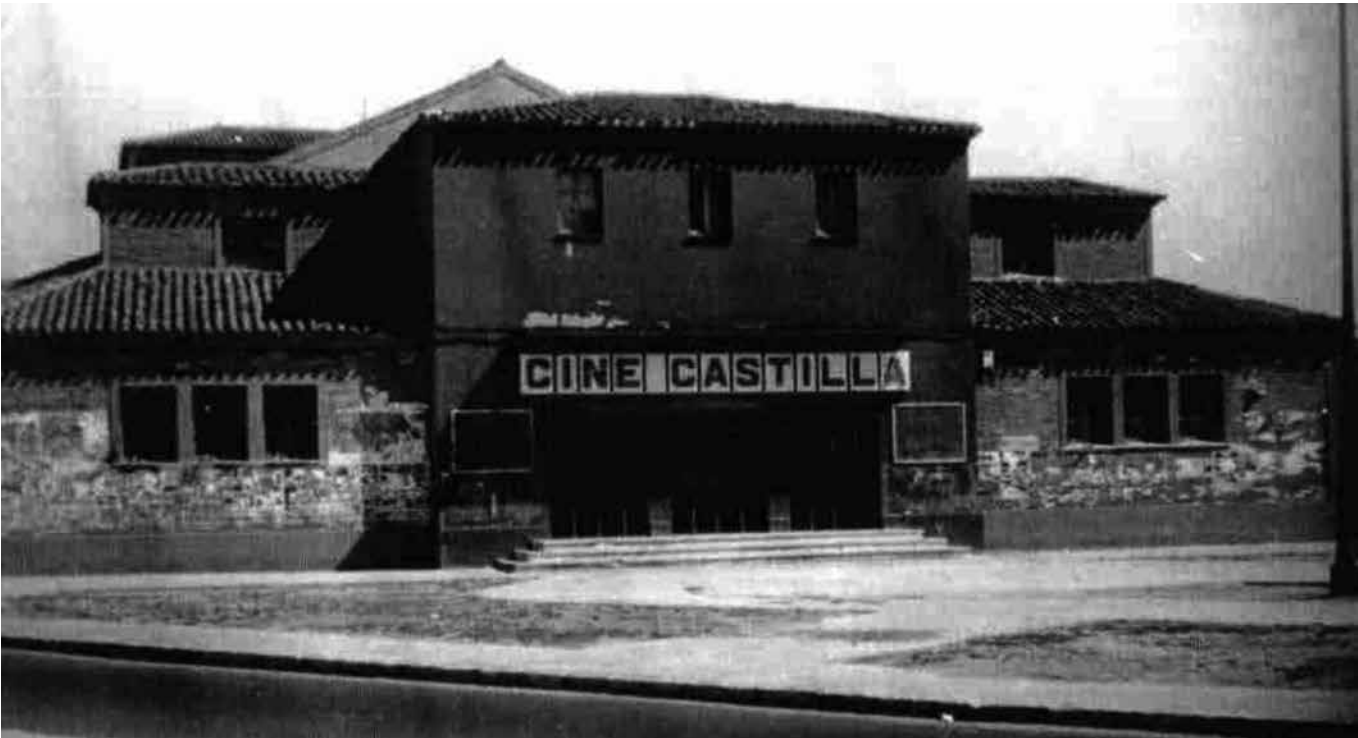
El Cine Castilla del barrio Girón.