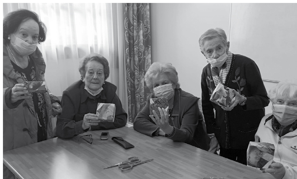
Nuestras residentes en el taller de cajas recicladas con sus creaciones.

Concienciados con el medioambiente, en Amavir El Encinar del Rey estamos dedicando las sesiones de laborterapia a las tres ‘Rs’. En este sentido, uno de los talleres que más les ha gustado a los residentes es el de cajitas recicladas, realizadas con las hojas de calendarios antiguos. Con dos hojas de calendarios, unas tijeras y un poco de pegamento los residentes han construido unas cajas preciosas. Además de trabajar las habilidades de motricidad fina y favorecer la actividad funcional y cognitiva colaboramos con el cuidado del medioambiente.