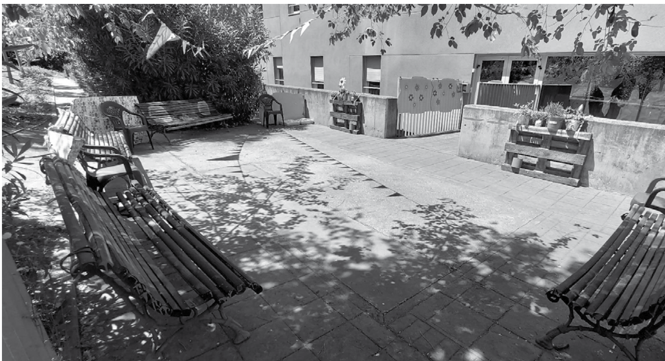
El patio de la 1ª planta.

Ha llegado el verano y ya es tiempo de disfrutar las agradables temperaturas que conllevan esta estación, y si es al aire libre mejor todavía. Desde el equipo técnico nos hemos propuesto decorar un rincón muy especial en donde seguro vamos a vivir nuevos y grandes recuerdos, el patio de la 1ª planta. Hemos realizado las siguientes mejoras para que los residentes y familiares disfruten de este rincón: decorar el patio con banderines, pintar los bancos y colocar dos pequeños huertos con plantas aromáticas, las cuales han sido donadas por las familias de los residentes de la 1ª planta.