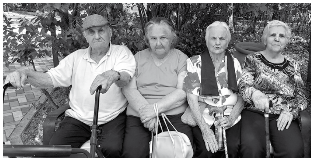
Nuestros mayores en el Mini Zoo.

En El Balconcillo cada mes realizamos excursiones para fomentar la relación entre los residentes. El 28 de abril hicimos una visita al Mini Zoo de Guadalajara y a pesar de que ese día hizo bastante calor para ser abril, nuestros residentes disfrutaron de la visita y las familias que nos acompañaron agradecieron que se organizara esta salida. Fue una visita que no dejó indiferente a ninguno de nuestros residentes, ya que hubo muchas risas y alegría. Los mayores viven las excursiones como un día muy especial. Desde primera hora se arreglan y sienten que van a disfrutar y además que van a tener un cambio en su rutina diaria. Estas salidas tienen