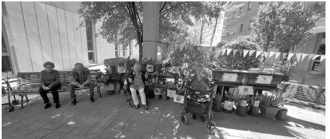
Nuestro precioso huerto terapéutico.

Llevamos meses trabajando en el huerto terapéutico y no podemos estar más contentos del resultado que nos está dando. Los mayores admiran cada día cómo crecen los tomates, cuentan las flores que posteriormente nos darán tomates con los que haremos un rico gazpacho. El trabajo que se realiza en el huerto terapéutico tiene multitud de beneficios, entre los que destacan el propio trabajo con la tierra, la conciencia del medioambiente y el recuerdo de que todos y cada uno de los mayores tuvo un huerto o tomateras. Las actividades que se realizan se hacen de forma grupal, por lo que fomentamos la relación entre iguales y