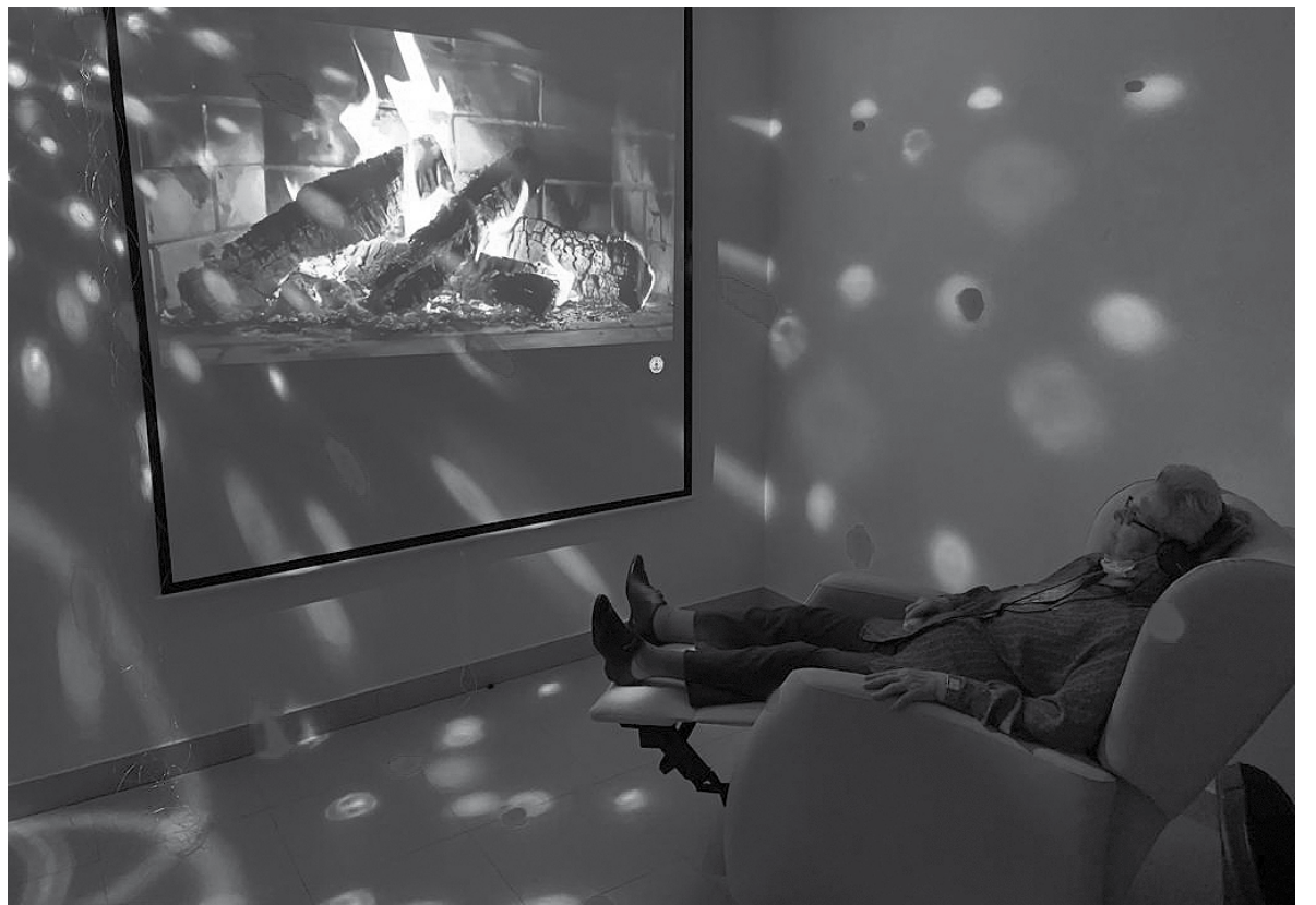
Una de nuestras residentes disfrutando en la sala de estimulación sensorial.

Desde antes de la pandemia, nuestro propósito era habilitar una sala de estimulación sensorial que nos sirviese como una herramienta más de tratamiento para nuestros residentes y usuarios. Tras estos años de restricciones, por fin, hemos podido hacer uso de nuestra nueva sala, que os queremos presentar, está situada junto a la sala polivalente. Las salas de estimulación sensorial son una herramienta o recurso que permite trabajar el despertar sensorial a través de la acción y la experimentación. Son espacios interactivos diseñados para estimular los sentidos, para mejorar la calidad de vida, en nuestro caso, de los usuarios o residentes con deterioro cognitivo, demencia o alteraciones conductuales, con afectación de sus capacidades motoras y neurológicas. Está diseñada con un fin educativo, terapéutico, de ocio y de relajación. Gracias a los diferentes estímulos que proporcionan y mediante su regulación, como luces, cortinas led, proyector, altavoces, espejos, tubo de burbujas, aromas, sonidos... Conseguimos despertar los estímulos más basales de nuestros residentes o, todo lo contrario, según considere el profesional, calmar momentos de agitación, regular ciertas alteraciones conductuales