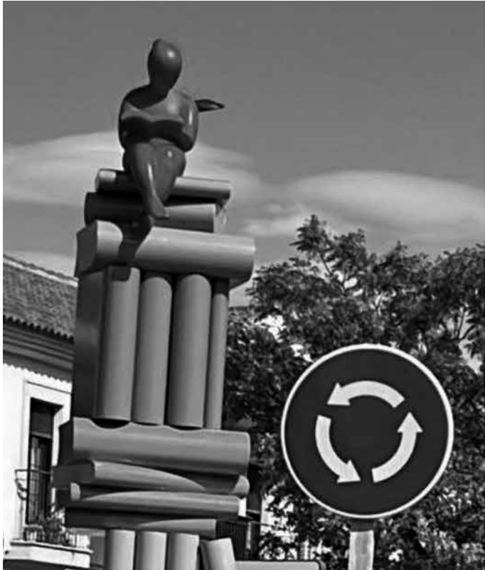
Las esculturas en las rotondas de Tomelloso.

Con motivo de homenajear a los artistas, escritores y al folclore local se han instalado en Tomelloso tres conjuntos de esculturas en las rotondas de la avenida Juan Carlos I. En una rotonda se visualiza una torre de libros con una niña leyendo, como homenaje a las letras. En otra, una paleta de colores y pincel, como