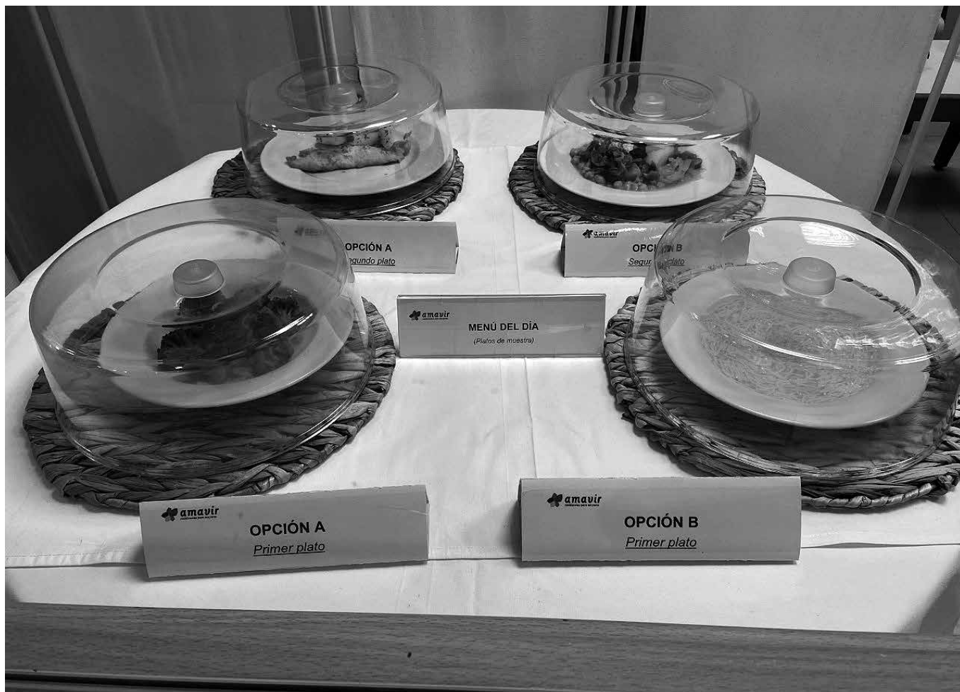
¡Al rico menú!

Desde el día 28 de marzo en recepción se exponen los platos de muestra del menú semanal de los residentes, mostrando las opciones de dieta basal (A) y dieta diabética (B), tanto de la comida como de la cena. Se deja una muestra con la comida que se sirve ese día en planta de ambas opciones de menú. Esto se realiza con el objetivo de mostrar tanto a residentes como a familiares cómo son las raciones individuales que se sirven aquí en nuestro centro. Así podréis tener de referencia la cantidad y la variedad alimenticia de cada plato que se sirve. El plato de muestra de la comida se expone desde las 12:15 h hasta las 17:30 h, y el de la cena desde las 19:15 h hasta las 20:30 h, aproximadamente. Con esta iniciativa queremos dar visibilidad a la variedad y calidad de las comidas que consumen nuestros residentes.