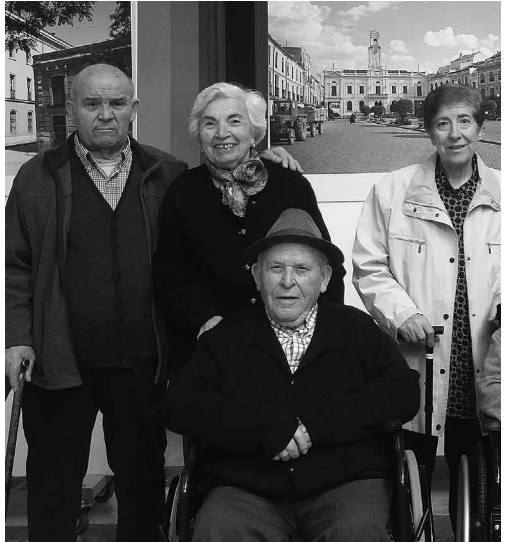
Nuestros usuarios durante la visita a la exposición.

Una de las actividades por las que apostamos en Amavir Ciudad Real son las salidas fuera del centro. El miércoles 19 de abril realizamos nuestra primera salida grupal. Visitamos una exposición de fotografías antiguas de Esteban Salas en el Antiguo Casino de Ciudad Real, organizada por el Centro de Estudios de Castilla-La Mancha, la cual consistió en un viaje a través del tiempo. La exposición está compuesta por un total de 42 imágenes procedentes del fondo de Publicidad Salas que, tras la generosa donación de la familia, se custodia en el Centro de Estudios. Estas imágenes hicieron a nuestros usuarios retroceder en el tiempo, reflexionando sobre lo mucho que ha cambiado nuestra ciudad y el modo de vida. Además, en el trayecto de ida y vuelta a la exposición dimos un paseo por algunos de los sitios que pudimos observar en las imágenes, como la Plaza Mayor, la Plaza del Pilar, los Jardines del Prado y la Calle Ciruela, donde nos acompañó el buen tiempo. Sin duda, una jornada de lo más interesante y enriquecedora.