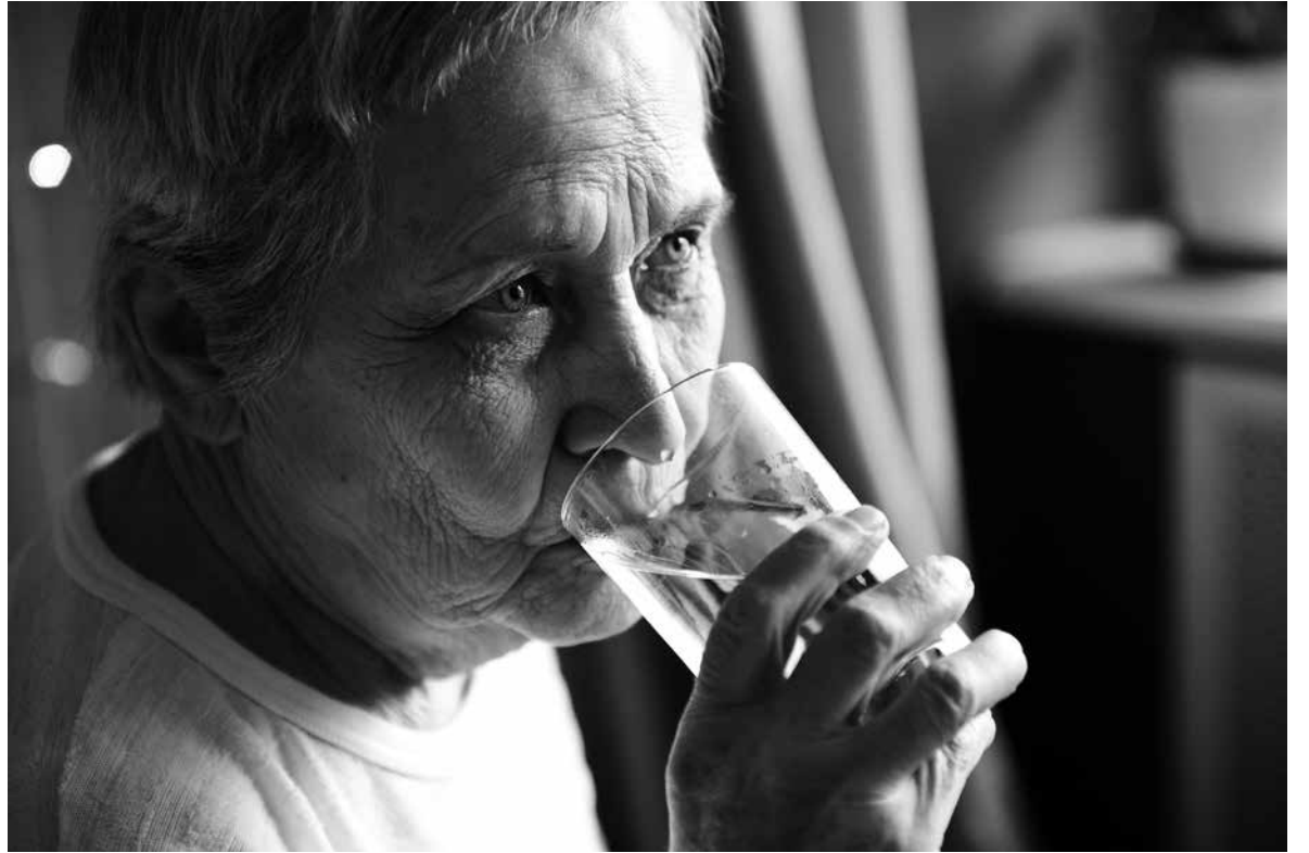
Una persona mayor bebiendo.

Llega el calor y con él empezamos a oír campañas donde nos recalcan la importancia de mantenerse hidratado, especialmente las personas más vulnerables. Los mayores lo son, a veces porque no pueden beber por sí mismos u otras veces porque no recuerdan tener que hacerlo. Además, en ellos está menos presente la sensación de sed. Hay que prestar especial atención en personas diabéticas o personas que toman diuréticos (hipotensores). El agua supone de media cerca de un 60% del peso corporal, participa en el transporte de nutrientes, elimina toxinas y ayuda en la regulación de la temperatura corporal. La deshidratación suele iniciar con síntomas leves como sensación de sed, sequedad oral, apatía o astenia, pero pueden agravarse mucho. Para prevenirla podemos marcarnos unas horas concretas en las que beber o hidratar a personas a nuestro cargo, así no dependerá de la sensación o no de sed que tengan.