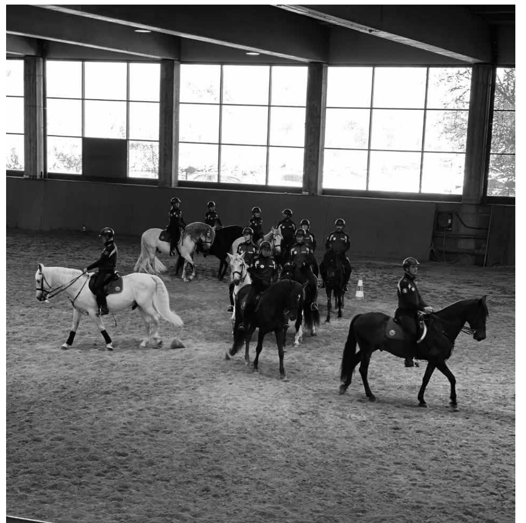
Demostración del escuadrón de la policía.

El miércoles 12 de abril acudimos con los residentes y usuarios de centro de día al Puente de los Franceses, donde se encuentran los Escuadrones de la Policía Municipal de Madrid. Pudimos participar y visitar el Escuadrón, que está compuesto por 86 agentes y 35 equinos de raza española. Su labor principal es la vigilancia de espacios públicos y zonas verdes. También pudimos presenciar un maravilloso espectáculo con distintos tipos de músicas y los diferentes aires de los caballos, paso, trote y galope. A continuación, participamos activamente en una exhibición que realizó la patrulla canina policial, donde nos explicaron sus intervenciones en diferentes contextos, como rescate de personas, búsqueda de drogas, dinero y explosivos. Al finalizar la actividad pudimos ver las cuadras y dar de comer a los caballos, sin duda una experiencia muy gratificante y completa que acompañamos de unas bonitas fotografías memorables. Una experiencia que, tanto a los usuarios de centro de día como los residentes, disfrutaron y que nos encantaría volver a repetir.