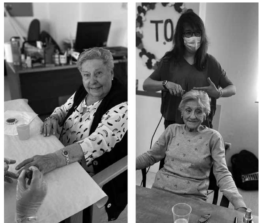
Nuestras residentes mientras las peinan y les hacen la manicura.

Desde hace unos meses estamos realizando sesiones de belleza con residentes y usuarios de centro de día. Las sesiones se llevan a cabo por estudiantes del Instituto Barrio de Bilbao. Acuden a la residencia para peinar, pintar las uñas y maquillar a nuestras mayores. Además, servimos un picoteo tanto a las residentes como a las alumnas al terminar la sesión. La experiencia ha gustado tanto que siempre está la sala llena porque todas quieren repetir. Por el momento no se harán más sesiones, ya que las estudiantes tienen que realizar prácticas para seguir completando sus estudios. ¡Están deseando que comience el curso escolar y que vuelvan las sesiones de belleza!