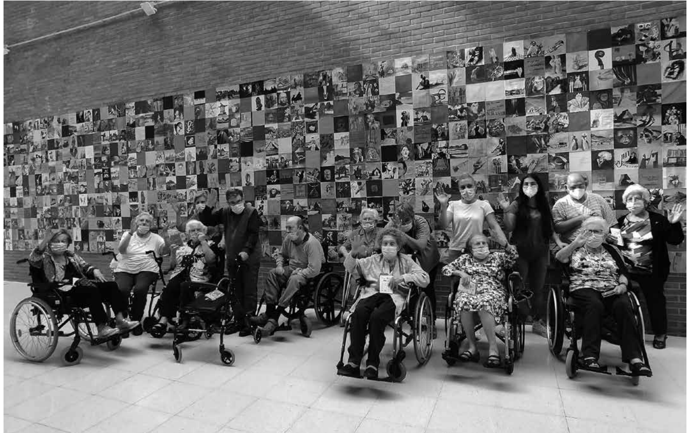
Visitando la exposición de la Biblioteca Municipal.

En abril comenzamos a realizar una actividad que se llevará a cabo el primer lunes de cada mes. Cada salida será a un lugar diferente, pero el objetivo será el mismo, pasar una tarde diferente en buena compañía, con residentes, trabajadores y todo aquel familiar que quiera acompañarnos. En abril fuimos a visitar el Parque Sauces. Nos lo pasamos en grande viendo la exposición de animales y disfrutando a la sombra de los árboles. En mayo visitamos una exposición en la Biblioteca Municipal Ramón Alonso Luzzy, llamada Navegando entre colores. Contemplamos y comentamos diferentes pinturas, pero lo más importante de todo fue llegar a la residencia con una sonrisa de oreja a oreja por haber