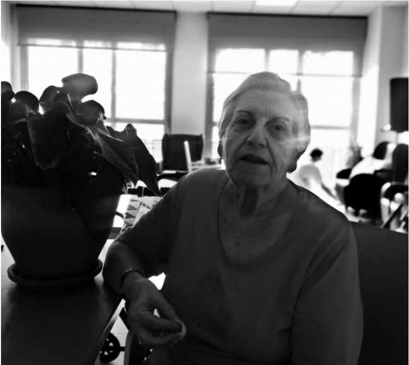
La autora de la receta.

Sofreímos los ajos, los pimientos y el tomate. Añadimos las gambas y, una vez hechas, las retiramos. Después añadimos el pescado para continuar rehogando el arroz. Echamos el agua, el azafrán y el perejil. Dejamos hervir alrededor de 20 minutos y dejamos reposar un poco. Decoramos con las gambas que teníamos separadas y listo para servir.