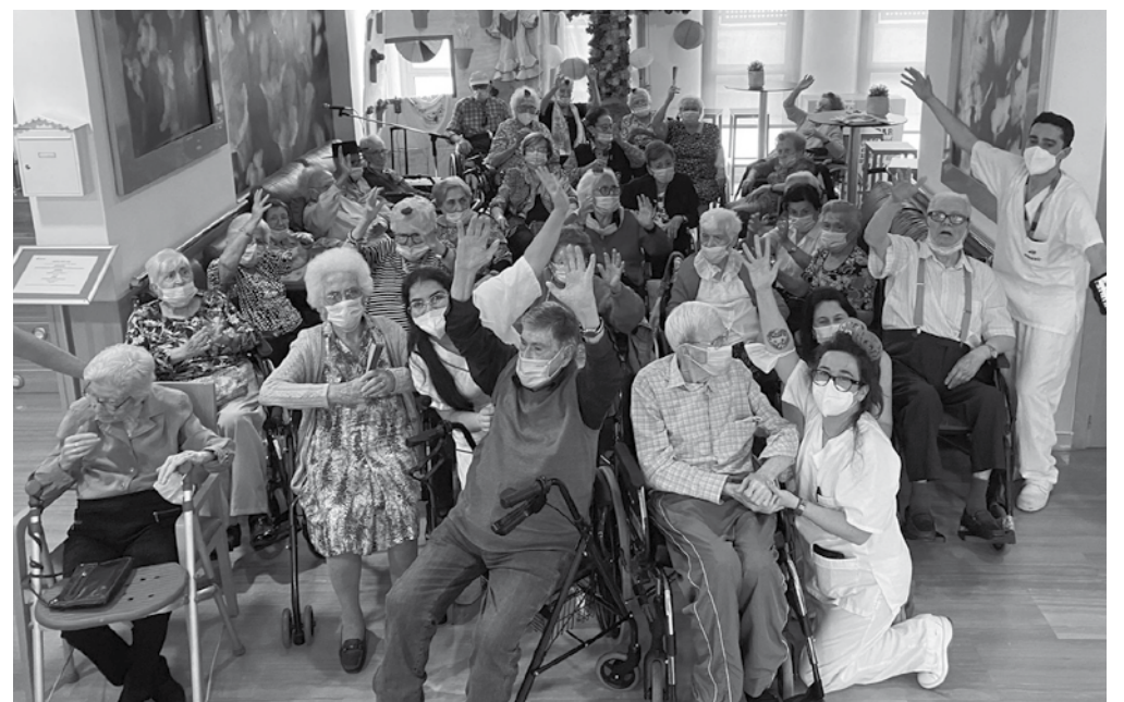
Fiesta en el Día de Murcia.

Cada 9 de junio es especial para todos los murcianos y, por supuesto, para todos nosotros. Desde el centro preparamos un día diferente con actividades y talleres de gastronomía típica. Durante la mañana preparamos un concurso de preguntas y respuestas. ¿Cuánto sabes sobre nuestra comunidad autónoma? Curiosidades que nuestros residentes supieron contestar muy bien. Siguiendo con las actividades destinadas a celebrar este día, realizamos un taller gastronómico para pre-