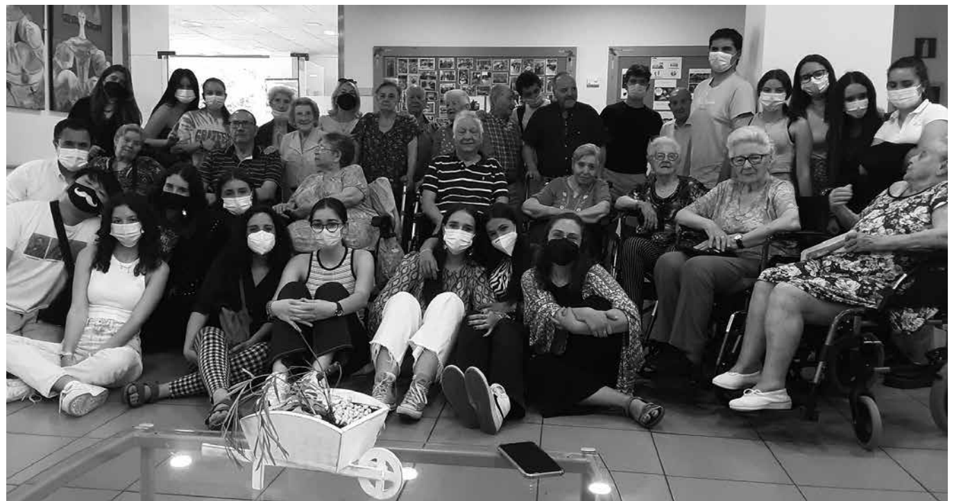
Los jóvenes del colegio Salesianos de Atocha nos visitaron en el centro.

La época estival acaba de llamar a nuestra puerta y, en el centro, estamos preparados para disfrutar de un verano que, a buen seguro, estará lleno de buenos momentos, tantos como los que hemos vivido estos meses que dejamos atrás, donde ha habido cabida para multitud de actividades. Entre las más destacadas, los encuentros intergeneracionales con los alumnos y alumnas del colegio Salesianos de Atocha con quienes pasamos una jornada de lo más entretenida. También hemos tenido tiempo para las salidas culturales