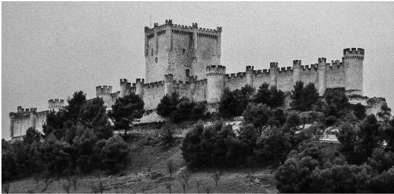
El castillo de Peñafiel, declarado monumento nacional en 1917.