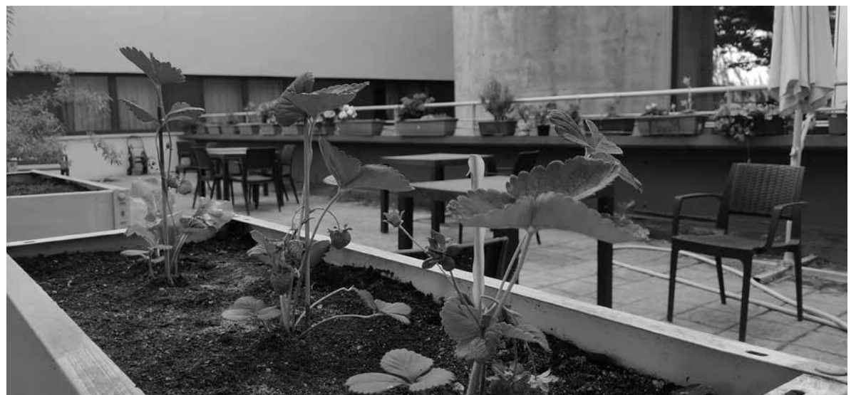
Refrescantes y ricas fresas de nuestro huerto.

Albert Einstein decía, "mira profundamente en la naturaleza y entonces comprenderás todo mejor". Y tiene toda la razón, así lo sentimos nosotros. En el centro tenemos un gran número de aficionados a la naturaleza y dentro de esta, a las flores y al cuidado de huertos y jardines. Por ello, en nuestro taller de huerto y jardín, los jueves por la tarde nos gusta arreglar, plantar, regar y, sobre todo, mimar nuestras plantas. Cada año nos atrevemos a plantar especies diferentes y cómo no, apostamos también por vegetales y frutas como las fresas, los tomates o las berenjenas. Es nuestra ilusión en los meses de primavera y verano.