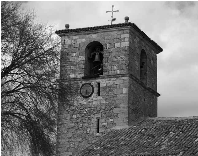
Iglesia del pueblo de Valeria.

Valeria es una de las tres ciudades romanas con las que cuenta la provincia de Cuenca. Desde su fundación, siempre ha conservado el topónimo romano que hace referencia a su fundador, Valerio Flaco. Destaca por su patrimonio natural y, sobre todo, histórico. Tocando el mismo casco urbano se encuentra la ciudad hispano-romana de Valeria. Se trata de un yacimiento arqueológico enclavado entre las hoces de los ríos Gritos y Zahorra. El foro es la plaza pública de la ciudad, su centro político-administrativo y religioso; en torno al que se articulan una serie de edificios como son la basílica, la curia, el aula de culto imperial, etc. Bajo la plaza se ocultaban cua-