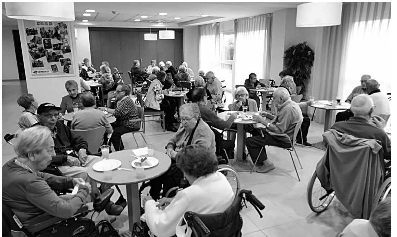
Los residentes y usuarios de centro de día disfrutando en la zona de cafetería y sala polivalente.