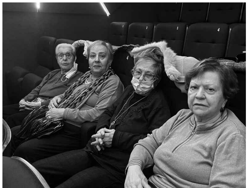
Nuestras residentes en el cine.