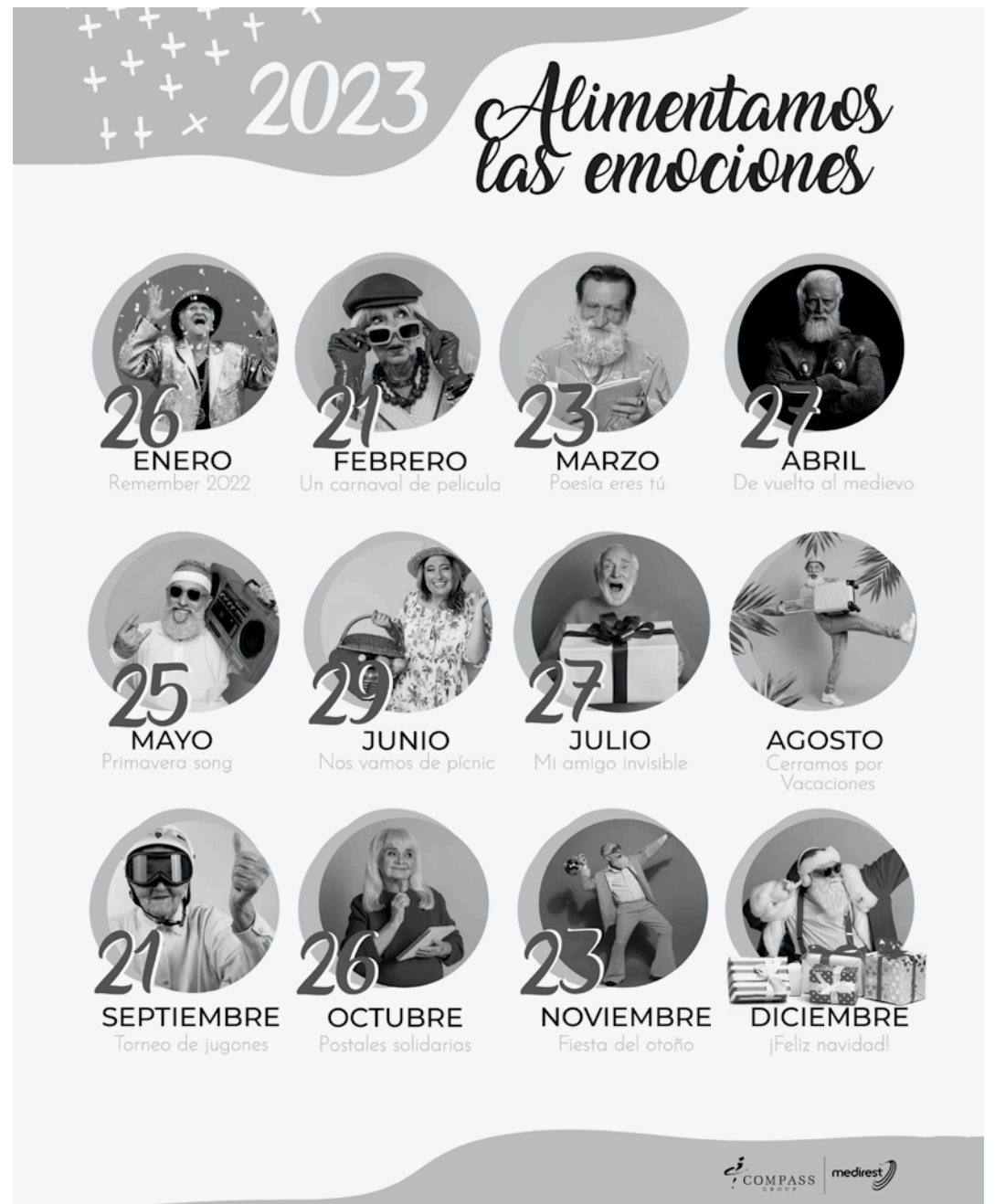
Programación del proyecto Alimentamos las emociones.

Desde la cocina del centro nos proponen una programación anual llamada Alimentamos las emociones. El proyecto pretende combinar actividades desarrolladas por nuestros Departamentos de Animación sociocultural y Terapia ocupacional con la alimentación, fundamentalmente a través de actividades lúdicas y un menú muy especial para ese día, poniendo en valor los productos de temporada. Dentro de la programación encontramos la celebración de la llegada del verano, la realización de diferentes actividades al aire libre, el taller de poesía, torneos, la fiesta del otoño, etc. Estas actividades están previstas que se realicen de forma mensual. Como venimos haciendo, para darle la difusión que ese tipo de eventos, iremos informando de las diferentes actividades a través de cartelería y por parte de los profesionales del centro los días previos a la celebración de las mismas.