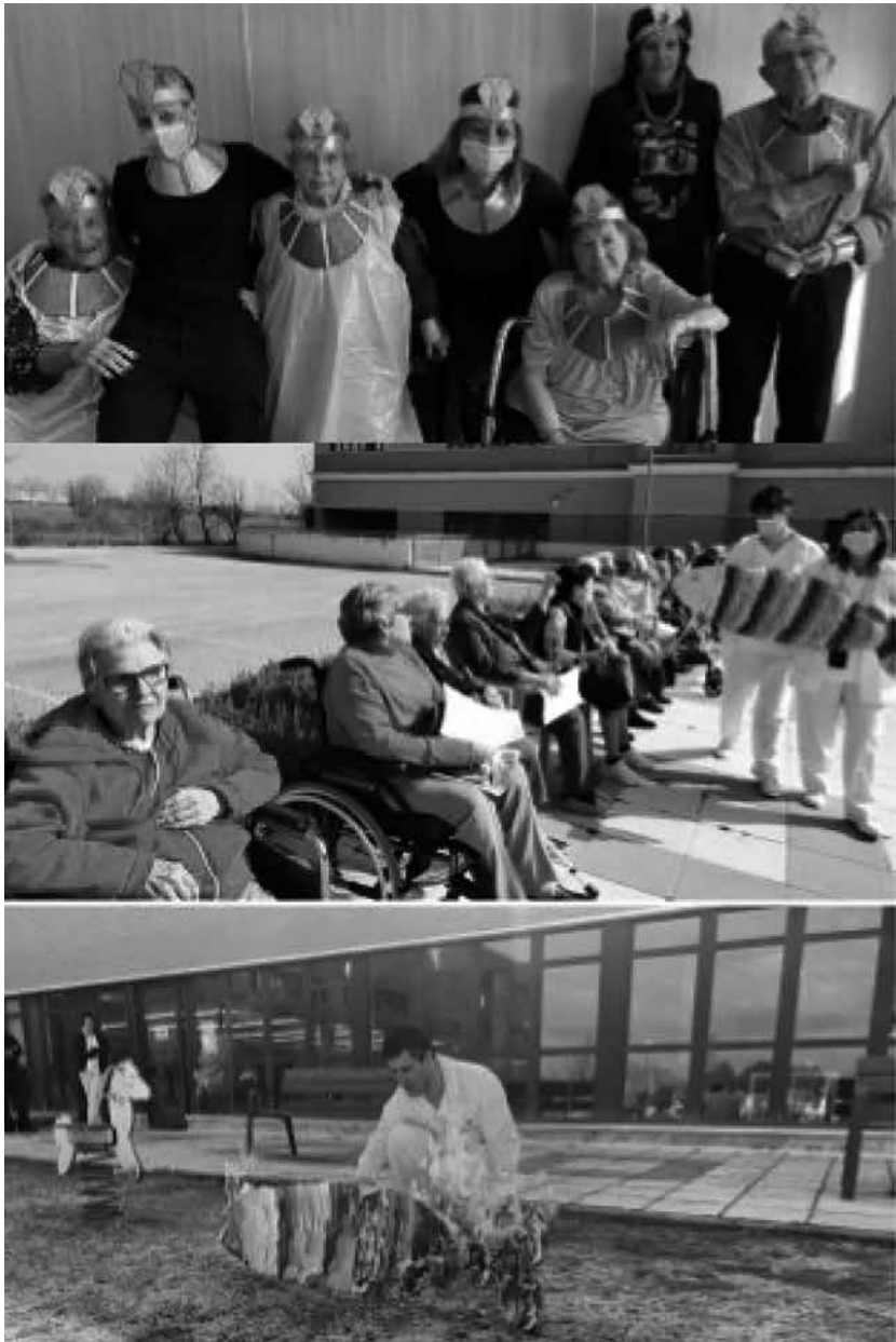
Disfrazados para la ocasión especial.

Este año y, tras varias semanas de trabajo diseñando y confeccionando los disfraces por parte de nuestros residentes, al fin llegó el gran día en el que, por un momento, convertimos Amavir Villanueva en el antiguo y mágico Egipto. Disfrazados de faraones y faraonas y rodeados por el misterioso mundo egipcio, celebramos tan especial día al ritmo de música carnavalera en la gran fiesta de disfraces que teníamos preparada. Pero no todo podía ser bailar y, por ello ofrecimos un aperitivo y un menú especial con el que rematar tan señalado día en el que pudieron disfrutar de lo lindo todos los participantes gracias a la ayuda y colaboración de nuestra cocina. Pero todo llega a su fin y tocó el momento de despedirnos del Carnaval hasta el próximo año y qué mejor que hacerlo cumpliendo la tradición con el entierro de la sardina que pudimos realizar en nuestros jardines gracias a que el tiempo nos acompañó. Impacientes, esperamos la llegada del próximo Carnaval y ver con qué nos sorprenden esta vez nuestros residentes.