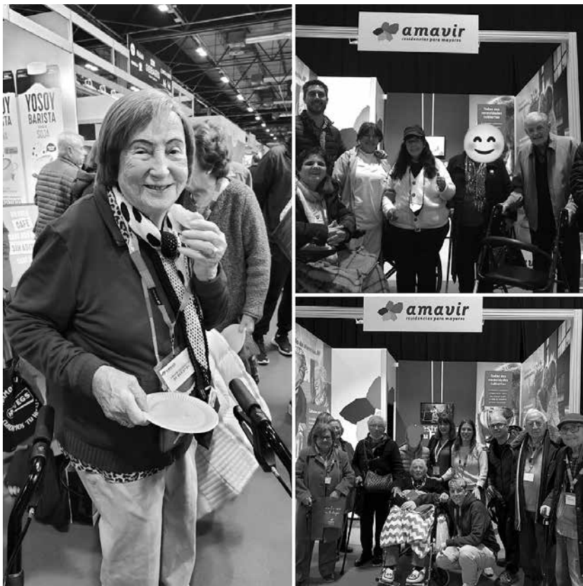
Residentes y usuarios de centro de día disfrutando del evento.

Durante los días 6, 7 y 8 de marzo tuvo lugar el IV Congreso Nacional de Dependencia y Sanidad, donde Amavir estaba representado. No quisimos desaprovechar la oportunidad de conocer algo diferente y allí acudimos con nuestros residentes y usuarios de centro de día. Además, aprovechamos para conocer la Horeca Professional Expo, que aglutina las últimas tendencias en restauración y cocina profesional con la participación de cocineros del más alto nivel y degustación de productos. Fue una jornada diferente, divertida y deliciosa ¡disfrutamos a lo grande!