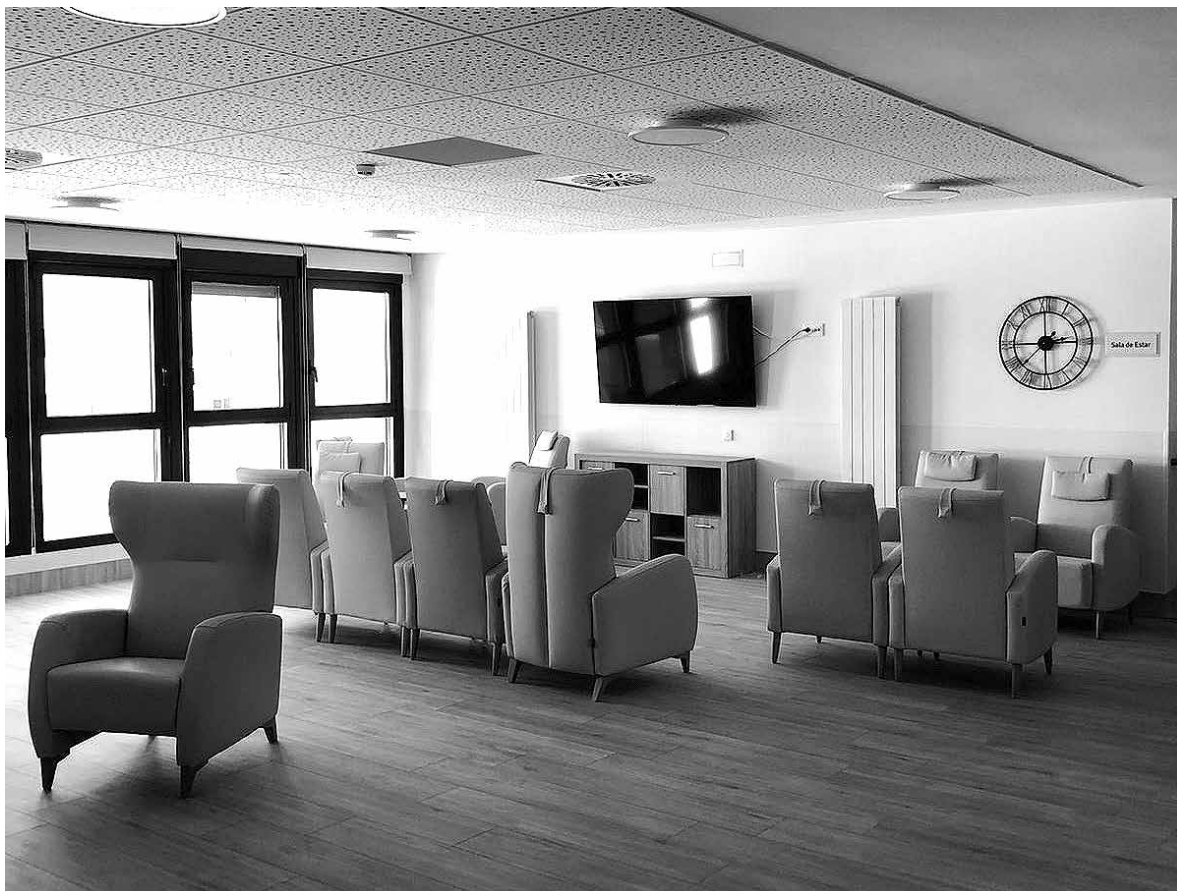
La sala de estar de Jazmines.

En Amavir Valle de Egüés contamos con tres plantas, llenas de habitaciones para que las personas mayores vengan a nuestra casa. Poco a poco, cada vez vamos siendo más residentes y vamos formando una familia mayor, por lo que durante este último mes hemos podido dar paso a la inauguración de la segunda planta. Esta segunda planta se encuentra dividida en tres módulos, Rosas, Jazmines y Amapolas. Cada uno de ellos tiene capacidad para alojar y dar atención a una veintena de residentes. Desde el equipo de trabajadores, tenemos como prioridad abordar todas y cada una de las necesidades de los residentes y de sus familias de la mejor manera posible para garantizar su bienestar y su calidad de vida. Se trabaja con el objetivo de conseguirlo y por ello, es importante que en cada unidad puedan estar residentes con condiciones y características de salud similares,