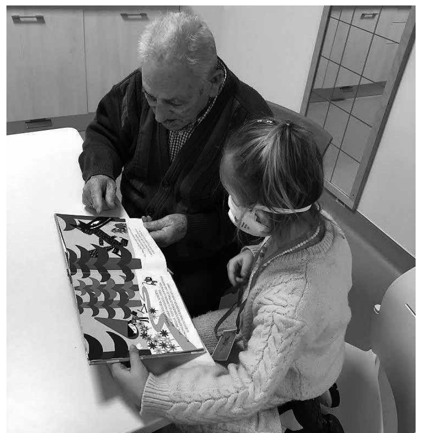
Una niña le lee un cuento a un residente.

Estas semanas hemos disfrutado de nuevas experiencias en nuestro centro. Los niños de 5 años del colegio Uriz Pi vinieron de visita para realizar con nosotros actividades para salir un poquito de la rutina. Se trata de un encuentro intergeneracional en la que los mayores comparten tiempo y disfrutan de la compañía de los pequeños. La primera semana realizamos un taller de lectura, en el que juntos nos contamos libros y compartimos anécdotas y experiencias. La segunda semana, realizaron un pequeño teatro, con mucha ilusión y disfrazados de animales. Y, por último, la última semana tocaba taller de manualidades, en el que con cartulinas y papel realizamos unas flores preciosas.