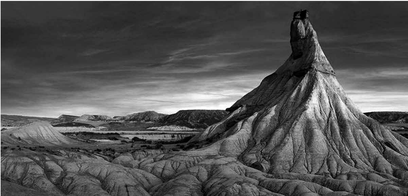
El Cabezo Castildetierra de las Bardenas Reales.

Las Bardenas Reales de Navarra constituyen un paraje semidesértico de 41.845 ha que se extiende por el sureste de Navarra. Ostenta las figuras de reserva natural y reserva de la Biosfera y constituye un territorio singular, en cuanto a su composición geológica como a su propiedad y administración. El enclave, hace referencia a un espacio territorial que fue patrimonio de la corona real de Navarra y ahora es patrimonio de la corona española, con un uso y aprovechamiento de sus recursos regulado, que se ha mantenido hasta nuestros días y que