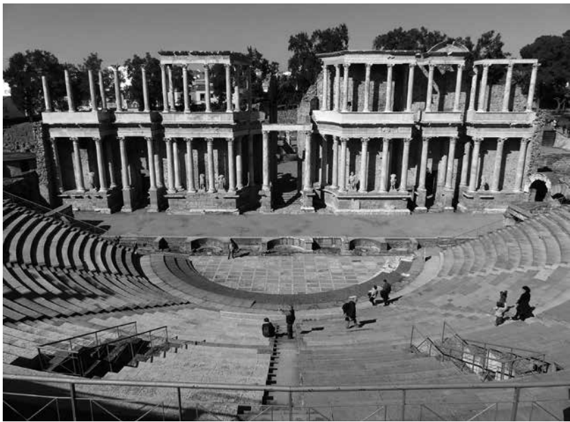
El teatro romano de Mérida.