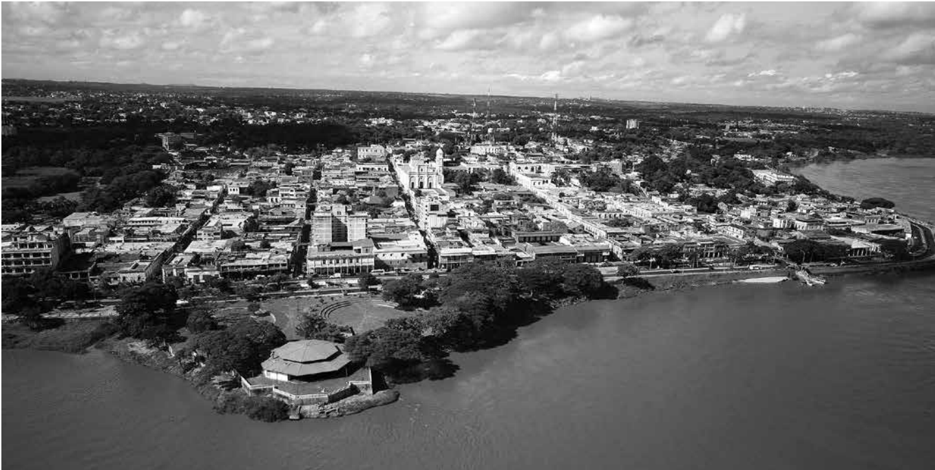
Vista de Ciudad Bolívar junto al río Orinoco.