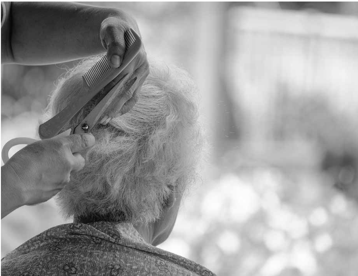
¡No hay nada como verse bien para sentirse bien!

El cuidado de la salud, engloba tanto aspectos físicos como emocionales, por eso el servicio de peluquería tiene importantes beneficios para nuestros residentes. La estética mejora la autoestima y la confianza en nosotros mismos, lo que repercute en nuestra salud y bienestar. En el caso del servicio de peluquería, este ayuda a las personas mayores a sentirse bien consigo mismas, lo que, evidentemente, contribuye a mejorar su bienestar físico, ya que a todos nos gusta mirarnos en el espejo y vernos bien. Además, querernos a nosotros mismos nos aporta seguridad a la hora de interactuar con otras personas y, por consiguiente, también mejora las relaciones sociales. Aunque a veces creamos que la coquetería está ligada a la juventud, no es cierto, por lo que hay que recomendar a nuestros mayores que cuiden su imagen personal, y