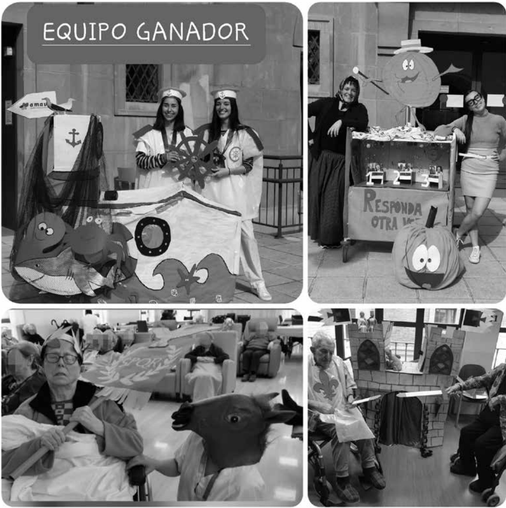
Las carrozas de Carnaval presentadas este año.