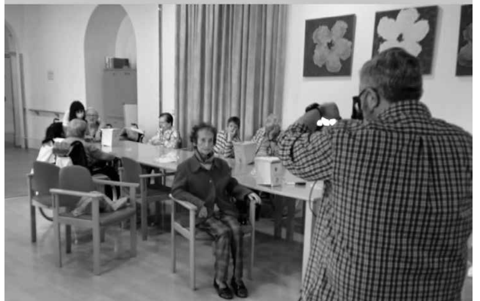
Momentos de las grabaciones.