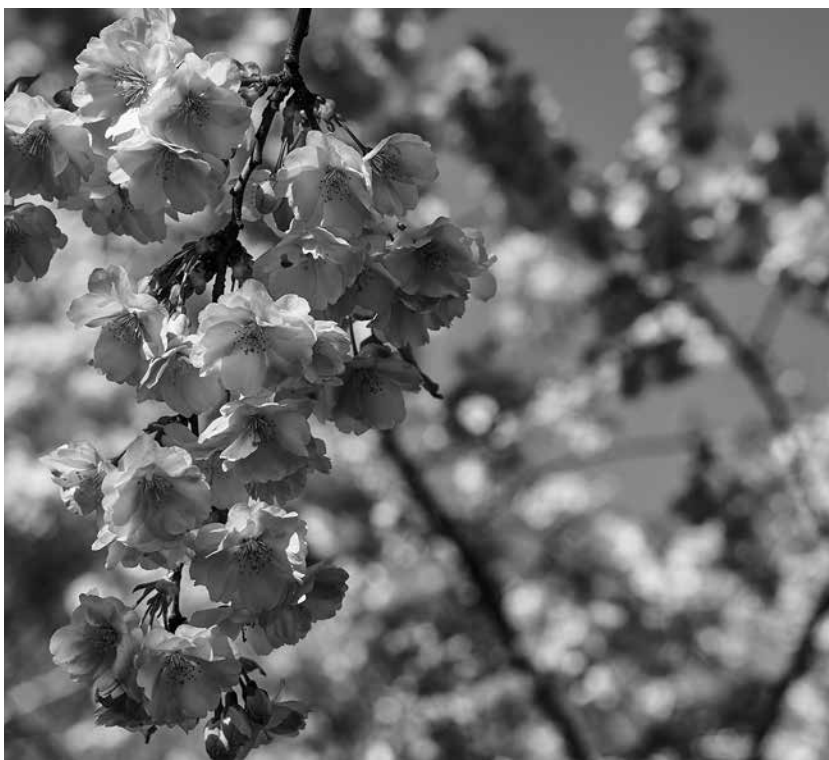
Cerezo en flor.

El topónimo Etxauri proviene del euskera y está compuesto por etxa (casa) y uri (villa o pueblo); lo que vendría a significar pueblo de las casas. En este lugar se han encontrado huellas de culturas prehistóricas. Los primeros indicios son restos de hace más de 50.000 años, posiblemente preneandertales y neandertales. Hacia el año 800 a.C. empezaron a surgir en Navarra los primeros poblados fortificados. Pero no fue hasta la baja Edad Media cuando se conformó Etxauri como lo conocemos actualmente. El sector agrario de Etxauri es muy importante. En primer lugar, la cereza, fruto que además de llenar de color el valle en primavera, supone un desdeñable aporte de rentas. Además de la cereza hay que destacar la relevancia de la viña, un cultivo de gran importancia debido a la explotación por la Bodega