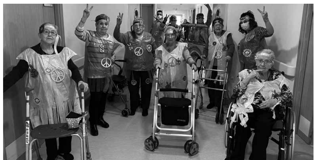
El espíritu de los hippies inunda la residencia.