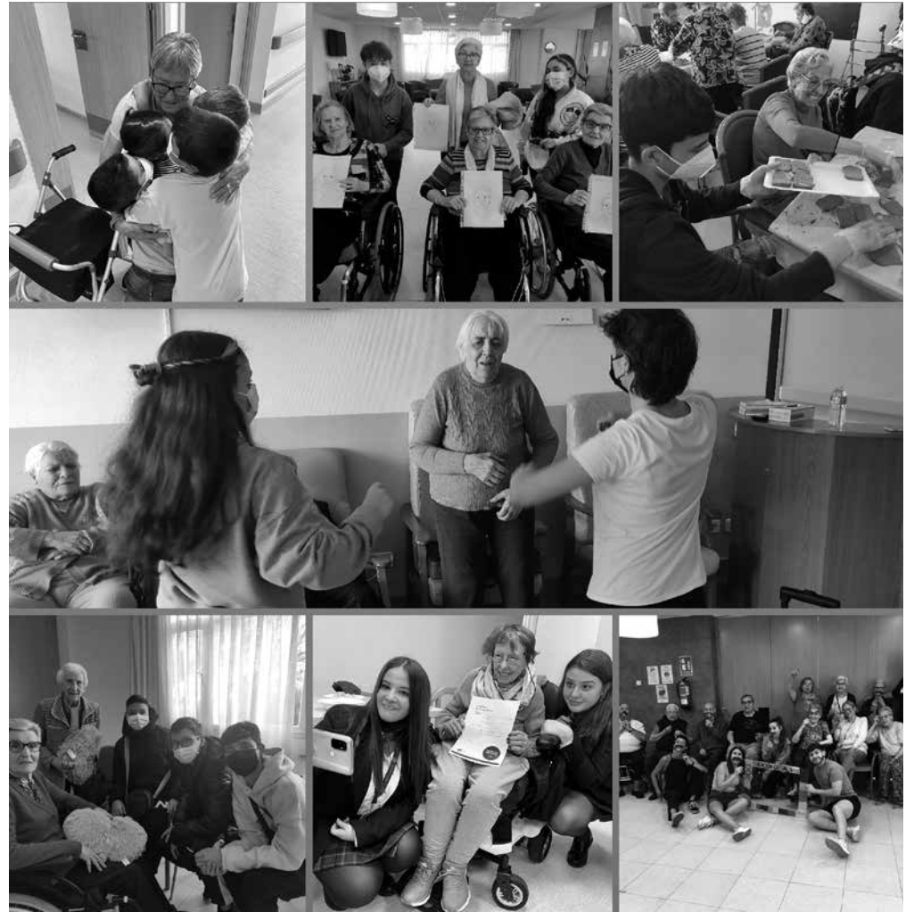
Algunas de las actividades intergeneracionales entre mayores y jóvenes.

En Amavir Getafe nos encanta la unión entre los mayores y los jóvenes, la cual ya sabemos por años de experiencia, que siempre es única y muy beneficiosa para todos. Diferentes estudios han demostrado que con estas actividades las personas mayores se sienten más felices y mejoran su capacidad física, cognitiva y social. En nuestro centro se llevan a cabo diferentes programas intergeneracionales que os queremos contar. En primer lugar, el programa estrella que lleva instaurado en nuestro centro desde 2017, el Programa Duplos, donde jóvenes y mayores conviven de lunes a jueves por las tardes disfrutando de actividades en común. La asociación Adopta un abuelo nos inunda con actividades que promueven el aprendizaje de habilidades relacionadas con las nuevas tecnologías, son todos unos hackers. Este año, hemos incorporado actividades con alumnos del IES León Felipe de Getafe, en las cuales realizamos en común talleres de cocina y otros donde Conrado les ayuda a crear un huerto en su instituto. Lunes y jueves vienen al centro alumnos procedentes del IES Legamar de Leganés, que con sus grandes conocimientos en música y arte nos invaden de alegría, bailes y dibujos personalizados. Y, por último, no nos podemos olvidar del campamen-