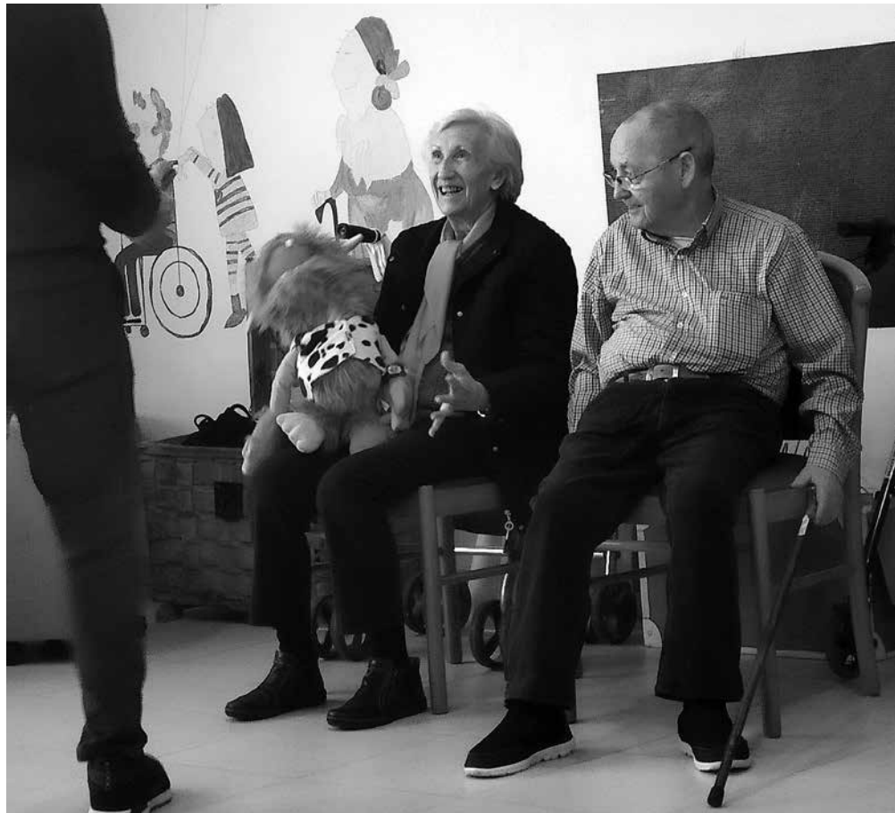
Nuestros residentes en la sesión de risoterapia.

sesión de risoterapia, la persona tiene un sentimiento agradable, con un mayor ánimo para afrontar la vida y los problemas de una manera positiva. Puede emplearse tanto en niños como en adultos, pero adaptando algunas de sus técnicas a las características individuales del paciente.