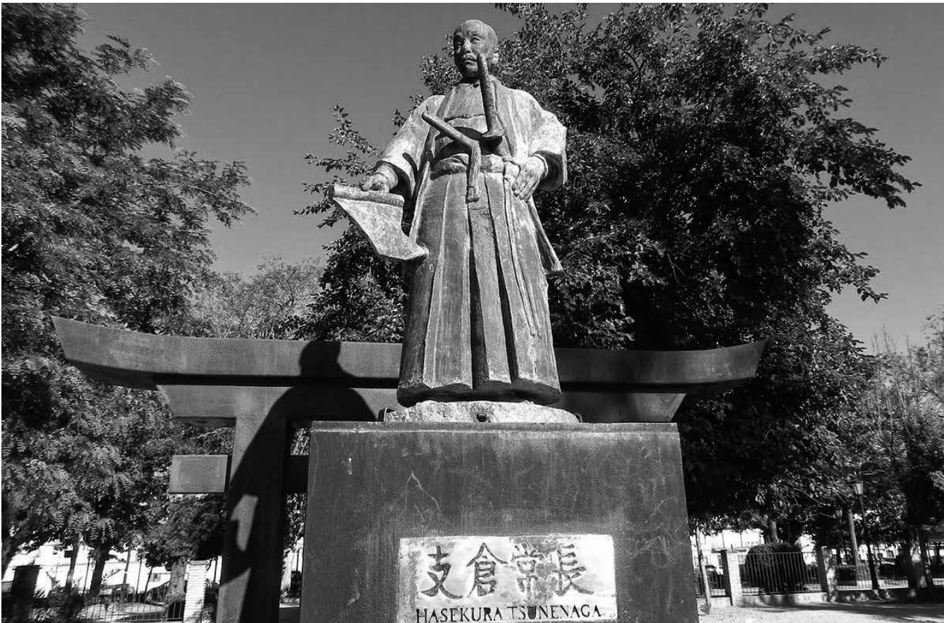
Monumento a Hasekura Tsunenaga en el parque Carlos de Mesa.

En la localidad sevillana de Coria del Río hay más de 600 habitantes que comparten el apellido Japón. El origen de este hecho se remonta al año 1614, cuando algunos de los integrantes de la Embajada Keicho, liderada por el samurái Hasekura Tsunenaga, se establecieron en ese municipio andaluz. Con los años, aquellos japoneses se quedaron en tierras coria-