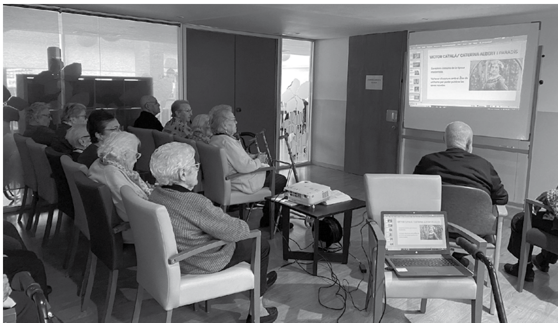
Una jornada muy interesante para conocer a mujeres relevantes históricamente.