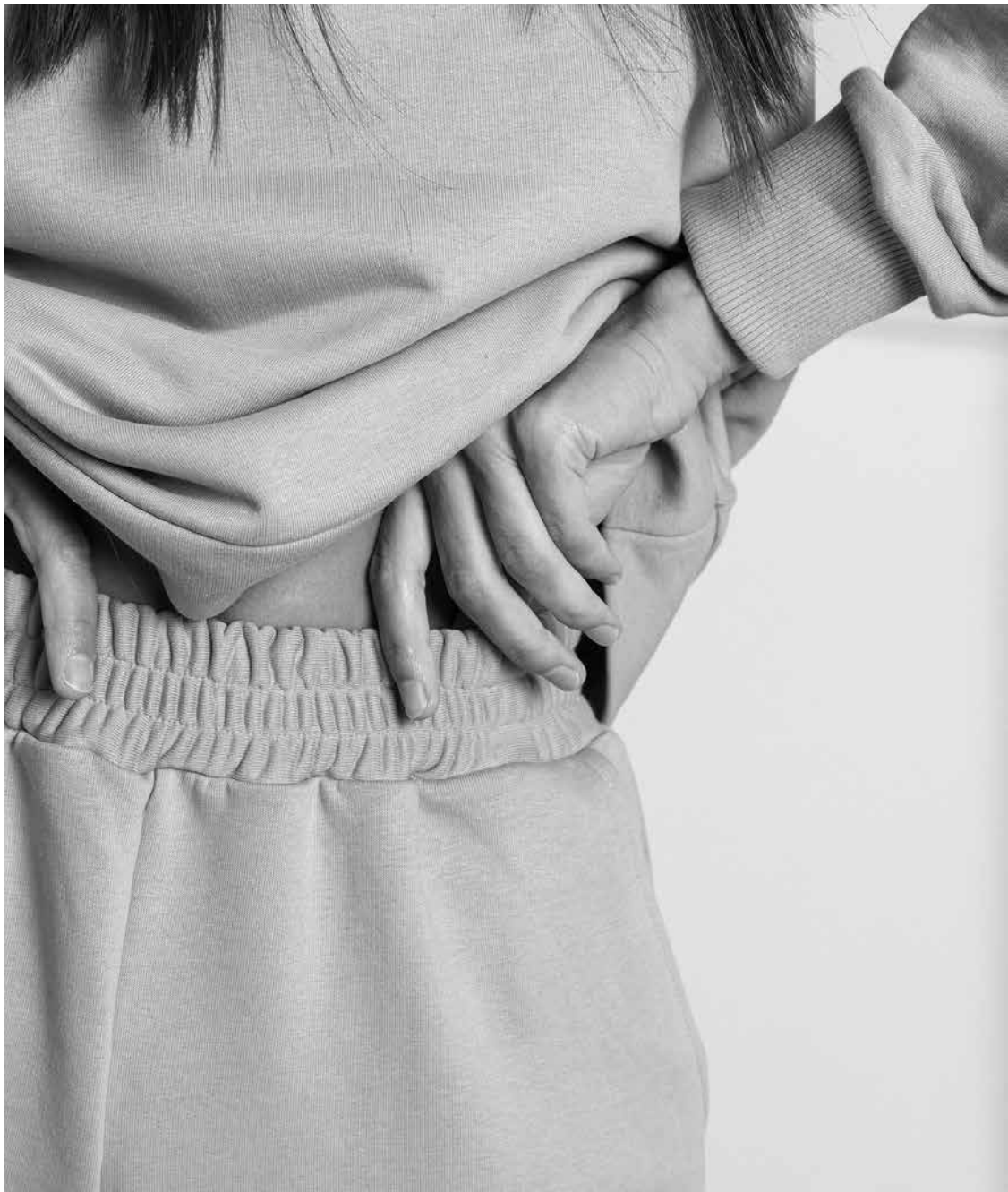
Anar còmodes és primordial.

No sempre és fàcil posar-se un jersei, aconseguir que els pantalons no s'abaixin o que no molestin mentre s'està assegut en una cadira molta estona. El primer consell és que la roba sigui ampla i confortable per poder moure's amb comoditat i per poder vestir-se i desvestir-se més fàcilment. Les gomes a la cintura, que substitueixen altres sistemes de cordat, són mes pràctiques. Per una banda, doten de més autonomia la persona i, d'altra banda, faciliten l'ajuda que pugui necessitar. També és important tenir en compte que les costures siguin planes, ja que el frec continu pot causar irritacions. El segon consell és que la roba sigui de cotó. Aquest teixit produeix menys al·lèrgies i reaccions a la pell, cada cop més delicada. Per últim, cal recordar que les peces de roba han de ser aptes per a bugaderies industrials, és a dir, que puguin anar a l'assecadora i que no siguin de teixits tipus llana o qualsevol altres que encongeix.