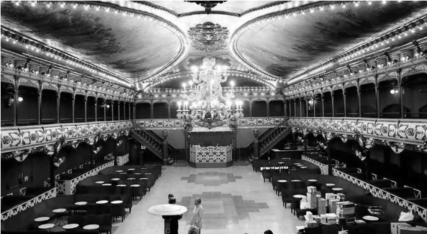
La sala de La Paloma nos trae muchos recuerdos.

La Paloma ha sido una de las salas de fiesta más emblemáticas de la Barcelona del siglo pasado, situada en la calle del Tigre 27, una travesía de la Ronda de San Antonio en el distrito del Raval. Fue inaugurada en 1903 y desde sus comienzos consiguió que fuera aceptada por dos tipos de público muy diferentes, los carrozas que iban a bailar los bailes más agarrados y la juventud que llenaba el local