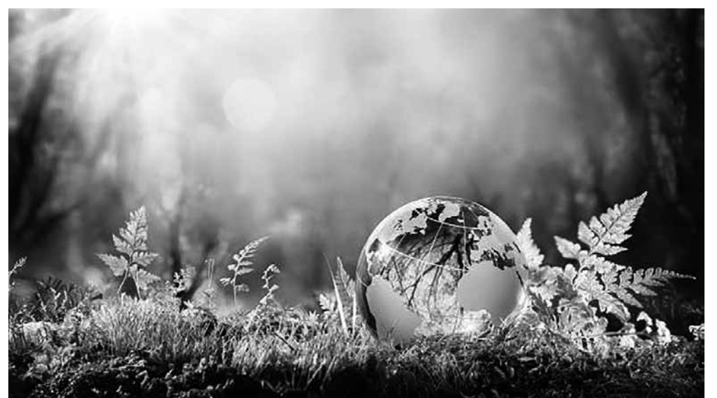
Hay que cuidar el medioambiente.

Es habitual pensar que las acciones de una sola persona no causan impacto en el medioambiente, pero los grandes cambios se logran a través de la suma de muchos actos pequeños. Pero, ¿qué podemos hacer? Hay gestos muy sencillos que con la práctica se pueden convertir en hábitos. Por ejemplo, cerrar el grifo mientras nos cepillamos los dientes ahorra 10.000 litros de agua al año. En vez de utilizar botellas de plástico de agua, se puede invertir en una de cristal. Otra de las medidas eficaces que podemos realizar de mane-