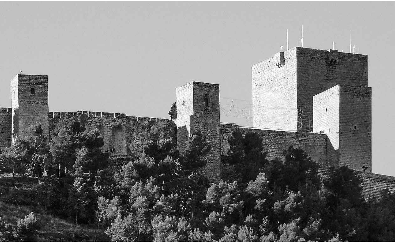
El castillo de Jaén.