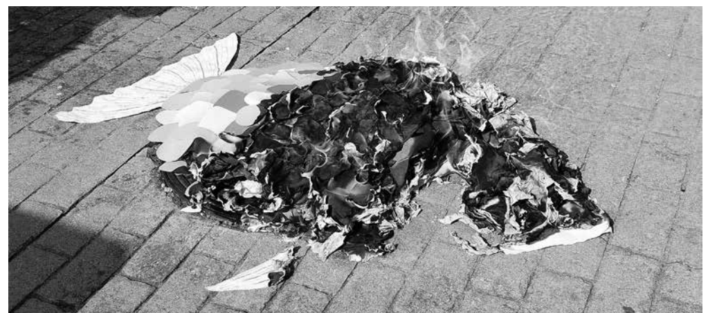
La sardina quedándose en cenizas.

Comenzamos el mes de marzo celebrando con nuestros residentes y usuarios de centro de día nuestro famoso entierro de la sardina. También disfrutamos de un rico aperitivo junto con las familias y el equipo del centro. Días antes elaboramos una sardina de papel que por ambas caras tenía escamas de todos los colores. Este pez se relleno el día de la fiesta con los deseos de todos los presentes. Decoramos con globos el jardín y pusimos música. Nos hizo un día muy soleado que nos permitió disfrutar de la terraza. Después, cada residente escribió su deseo y lo introdujo en el pez que posteriormente quemamos dejándolo en ceniza y, con ella, todas las ilusiones y deseos para este año.