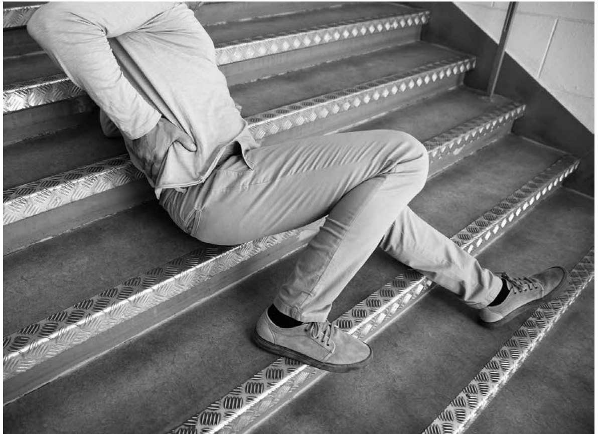
La reeducación de la marcha previene caídas.

En el paciente geriátrico es frecuente que se presenten alteraciones de la marcha. Estas alteraciones pueden venir provocadas por distintos factores como la disminución de reflejos, problemas sensoriales, tras una cirugía, un periodo largo de inmovilismo o, simplemente, por un dolor que limite la movilidad. Por ello, es necesario trabajar con talleres dirigidos a la reeducación de la marcha, para mejorar la capacidad de deambulación y prevenir el riesgo de caídas. El objetivo está en realizar ejercicios activos para trabajar tanto el equilibrio estático como el dinámico, la postura y potenciar la musculatura de los miembros inferiores. Estas actividades se realizan con la ayuda de distintos elementos como las barras paralelas, las escaleras, las rampas y diferentes tipos de obstáculos. Los residentes disfrutan mucho con este tipo de talleres, ya que les entretienen y van percibiendo cómo poco a poco mejoran su estabilidad y se sienten más seguros a la hora de caminar.