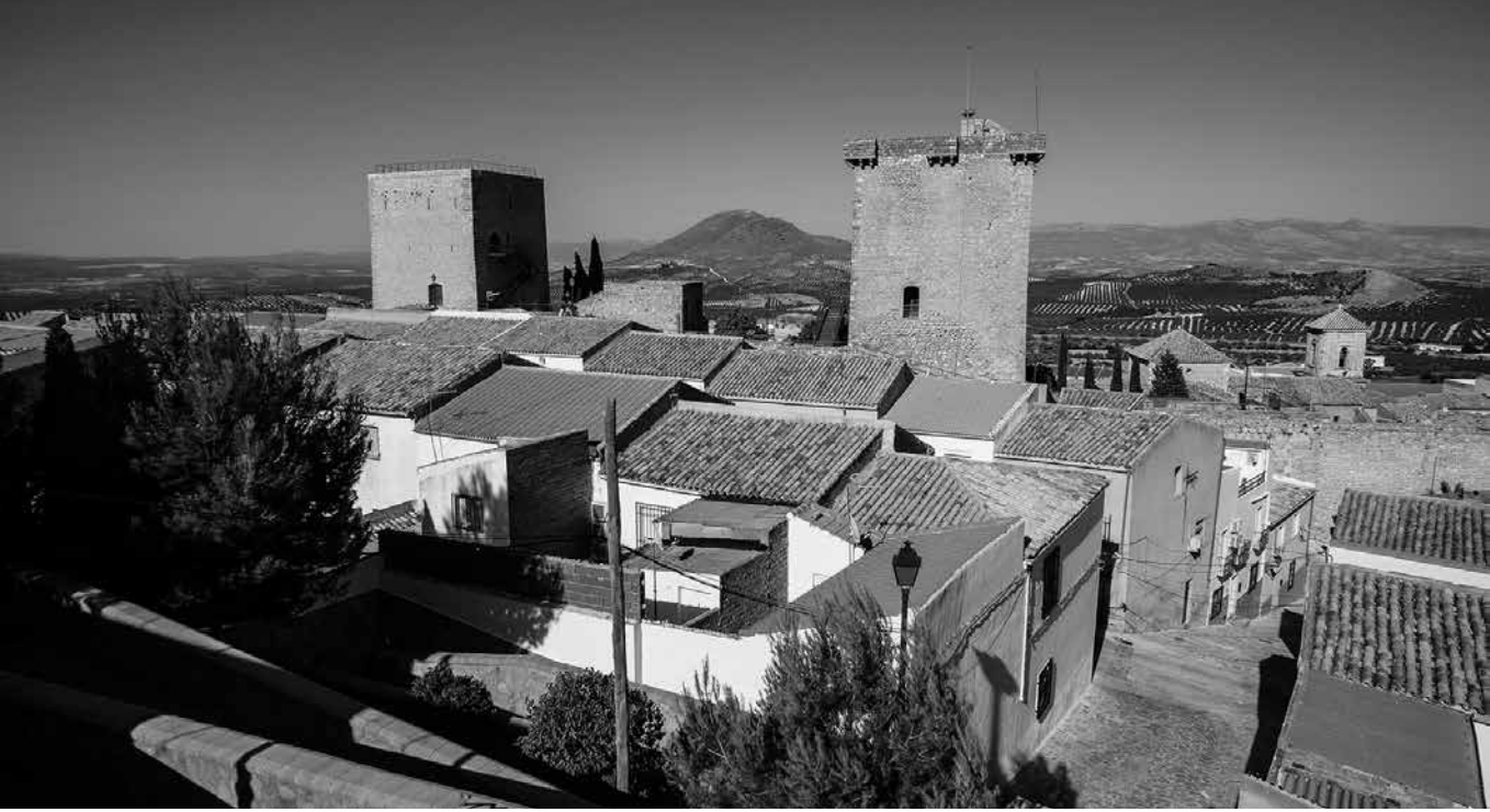
El castillo de Jódar.

Nuestro residente es madrileño, pero por cuestiones familiares, sus padres se tuvieron que mudar y desde muy pequeño pasó gran parte de su infancia y adolescencia en un pueblo de Andalucía, concretamente, en Jódar, de donde tiene muy buenos recuerdos. Señala especialmente la romería que se hacía por San Isidro en el pueblo de al lado, Fuente García. Todos iban a un paraje con la comida preparada porque les esperaba un día largo de fiesta y bailes. También recuerda la Semana Santa, cada día desde