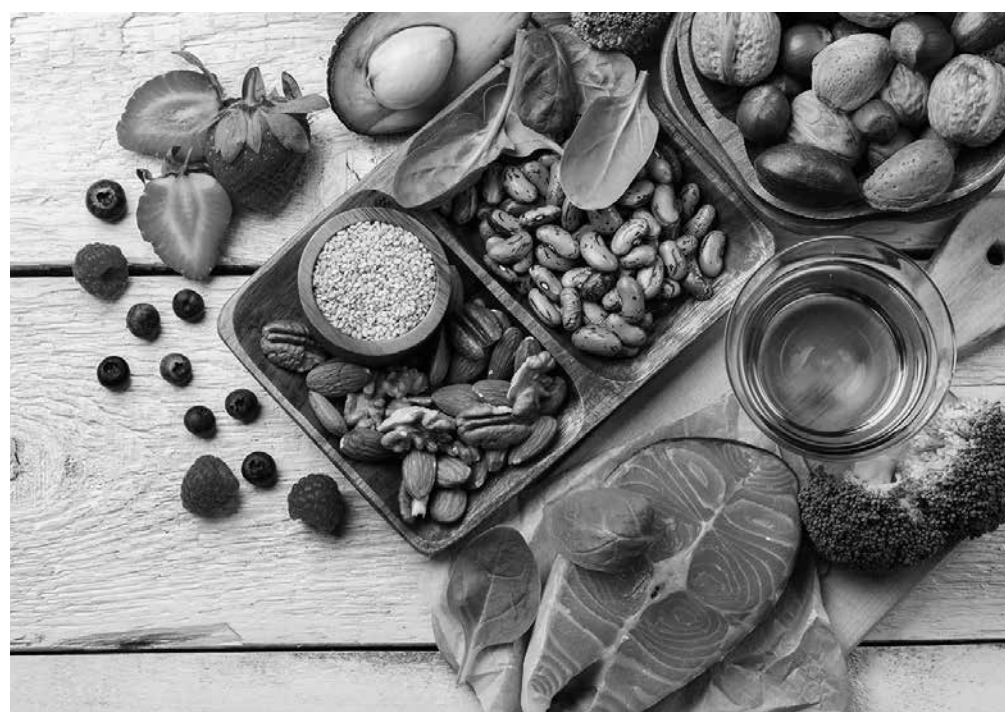
Claves para una alimentación sana.

Hoy en día existe una gran preocupación a nivel social en torno a la alimentación, y son abundantes las campañas que intentan concienciar a la población acerca de las pautas correctas de una alimentación sana y equilibrada. Si este es el caso de la población general, ¿qué decir de la población de nuestras residencias? Lo habitual es que nuestros mayores presenten diversas alteraciones, bien en el tipo de dieta, en la textura de la misma, en la necesidad o en no cumplimentar las dietas con suplementos nutricionales, etc. Tengamos en cuenta que nuestros residentes, en muchas ocasiones, no son conscientes de dichas pautas nutricionales y demandan alimentos diversos que ponen en peligro el frágil perfil sanitario que presentan. Por ello, es imprescindible nuestra concienciación, la de sus cuidadores y la de las familias. Tenemos que ser conscientes de que la cumplimentación de las pautas de alimentaciones va a conllevar una mejoría en el estado general de los residentes, llegando en ocasiones a poder eliminar tratamientos