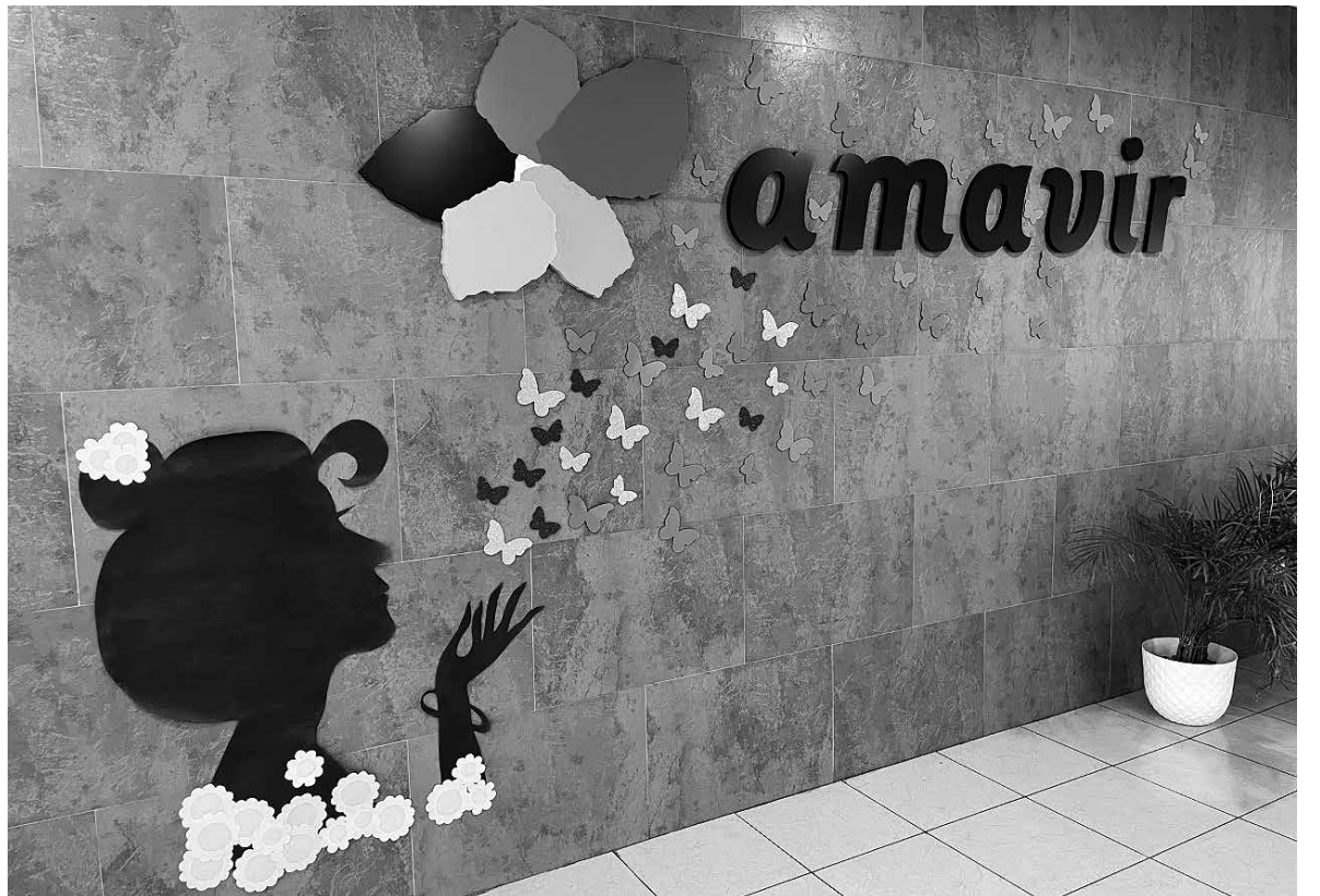
El mural realizado por residentes y usuarios de centro de día.

Cada 8 de marzo, desde que en 1975 fue acordado por la Asamblea General de las Naciones Unidas, se conmemora el Día Internacional de la Mujer, con el objetivo de reivindicar la igualdad, la justicia y el respeto pleno a los derechos humanos de la mujer, entre otros aspectos. Desde nuestro centro quisimos apoyar este día y darle la importancia que se merece. Para ello, el Departamento de Terapia ocupacional, con la colaboración del resto de profesionales del centro, organizó diferentes actividades. Nuestros residentes y usuarios de centro de día realizaron un mural que después colocaron en la recepción del centro y también hicieron flores de goma eva. El mismo 8M se ofreció una charla informativa de orientación y contextualización acerca de este día. Tras ello se proyectó en la sala de terapia un documental sobre el trabajo que desempeñan las mujeres en el mar, dando valor a cada labor que desempeñan y generando un pequeño debate tras la finalización del vídeo. Consideramos estas actividades