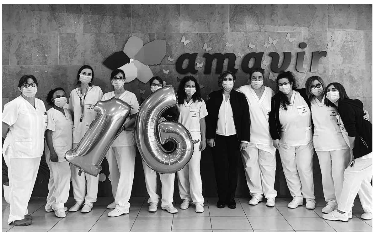
¡Feliz 16º aniversario!

El 26 de marzo de 2007 abrimos nuestras puertas con el objetivo de ofrecer a nuestros mayores la máxima calidad de vida mediante un sistema de trabajo centrado en la persona, haciéndoles partícipes de la vida activa del centro y sin olvidar a sus familiares, una parte esencial en el desarrollo de nuestra actividad profesional. Durante estos años, nuestro centro se ha convertido en el hogar de un gran número de personas mayores y un lugar de tranquilidad y confianza para sus familias. Nuestro deseo es seguir creciendo y trabajar día a día por el bienestar de todas las personas que conforman esta gran familia.