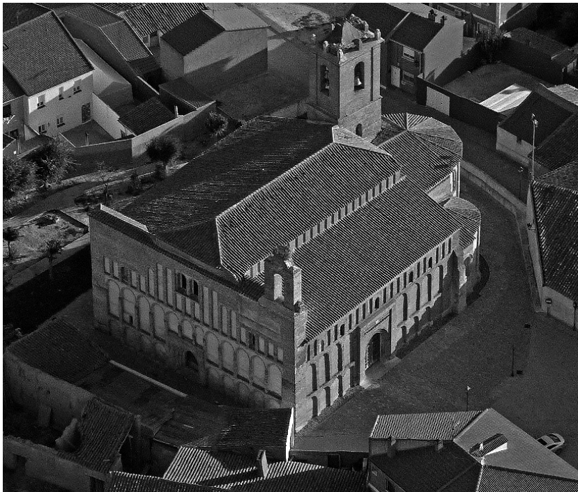
Vista aérea de la Iglesia de San Juan Bautista.