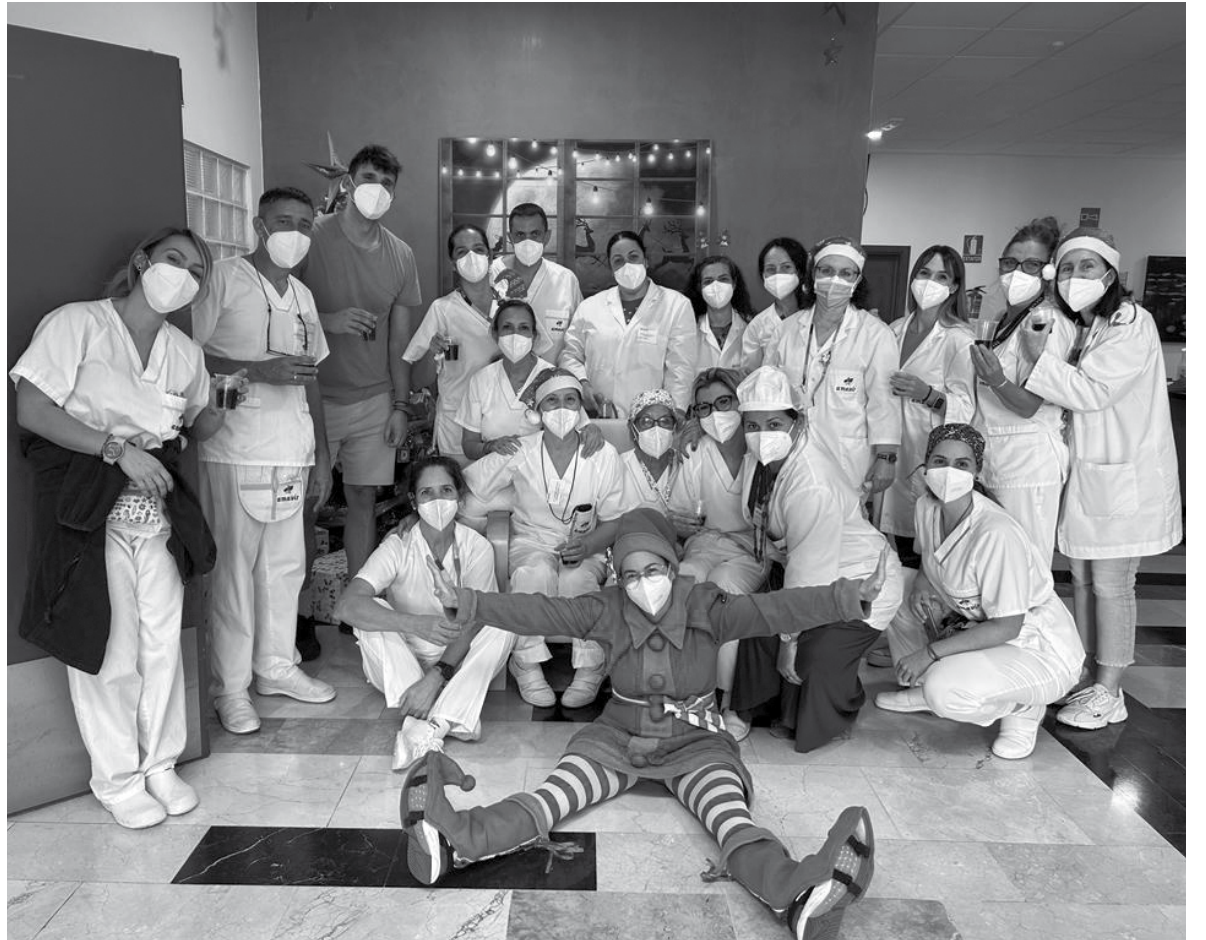
Grupo de trabajadores de Amavir Tejina.