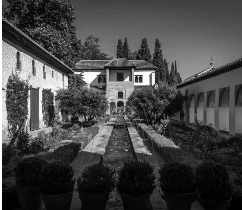
Vistas al patio de Generalife.