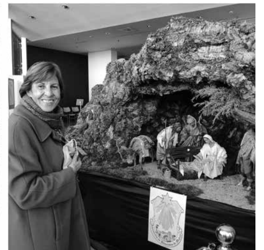
Disfrutando de los belenes.

todos con amor y sacrificio. Una de las escenas más curiosas y originales del belén era donde María estaba representada como la patrona de Alcobendas, la Virgen de la Paz, recordando el milagro de su aparición en la ciudad. Sin duda, dos belenes completamente distintos, pero insuperables.