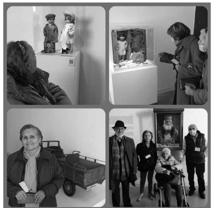
Los participantes de la excursión junto a los muñecos de su vida.

Visitamos la exposición de juguetes antiguos, un sugerente viaje por una parte de la historia contemporánea de España a través de sus juguetes, juegos y muñecas. Estos fueron un fiel reflejo de los cambios socioeconómicos, técnicos, culturales y políticos de las diferentes fases de la historia. Los juguetes expuestos, son piezas seleccionadas pertenecientes a la colección de Quiroga-Monte, uno de los mejores y más completos patrimonios privados sobre el juguete. Los juguetes fueron el mejor medio para expresar la imaginación, las destrezas y la creatividad de muchas generaciones infantiles. Los participantes disfrutaron mucho de la experiencia, pues ayer, igual que hoy, aprender a jugar es aprender a vivir.