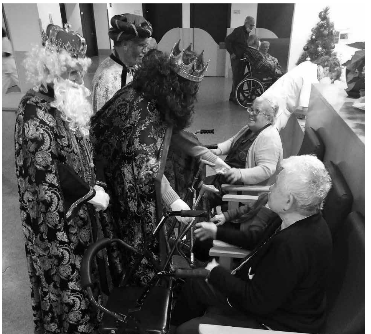
La mágica visita de los Reyes Magos.

Dejamos atrás el año 2022 lleno de vivencias compartidas con residentes y familias. En las últimas Navidades tuvimos fantásticos y variados espectáculos. Así, pudimos escuchar los villancicos en las voces infantiles de los colegios que se acercaron a compartir estas fechas tan especiales con nosotros. También disfrutamos de los grupos de bailes regionales que, con su arte, nos acercaron a cada rincón de la geografía española. Nuestros mayores recordaron aquellos bailes a los que acudían de mozos en las fiestas de sus respectivos pueblos. Y más de uno se lanzó a bailar, mostrando que la alegría es algo que nunca se pierde. No podemos olvidar a las artistas que, micrófono en mano, nos deleitaron con música folclórica y actual. Con sus voces nos animaron a entonar aquellas canciones de toda una vida que con tanto cariño recordamos. La guinda la puso la visita de los Reyes Magos de Oriente. Ellos recogieron las cartas en las que se habían plasmado los deseos y nos prometieron un regalo a cada uno, ya que como siempre nos “habíamos portado muy bien”. A lo largo de este año 2023 nos esperan más celebraciones, fiestas y actuaciones que deseamos disfrutar con todos vosotros. ¡Os esperamos!