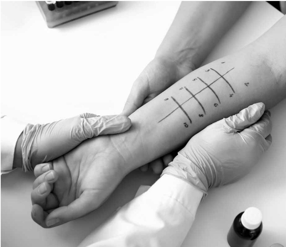
Pruebas de sintomatología.

Los síntomas asociados a las alergias primaverales son muy variados, ya que afectan a diferentes partes de nuestro cuerpo como los ojos, la nariz, la garganta o los pulmones. Los principales síntomas de la alergia al polen son los siguientes: Conjuntivitis, picor en nariz, garganta y paladar, congestión nasal y estornudos, dificultad para respirar, tos y pitidos. Este conjunto de síntomas es conocido como asma polínico. ¿Cómo se trata la alergia al polen? Existen dos métodos que permiten tratar la alergia al polen: La inmunoterapia, más conocida como vacuna de la alergia. Este tratamiento consiste en la administración -por vía subcutánea o sublingual- del elemento que provoca la alergia en dosis cada vez más elevadas, hasta un máximo preestablecido por el médico especialista en alergología. Este proceso puede durar entre 3 a 5 años y es el único tratamiento capaz de mejorar la alergia e incluso puede lograr que esta desaparezca. Por otro lado, están los antihistamínicos. Son unos medicamentos que permiten aliviar los síntomas de la alergia. Antes de someterte a cualquiera de estos tratamientos debes consultar con tu médico o a tu farmacéutico. ¡No te automediques!