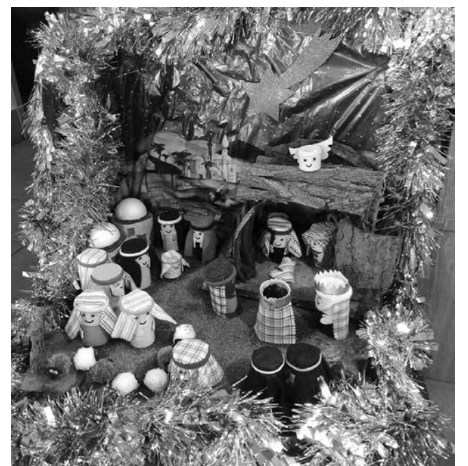
El concurso de belenes.