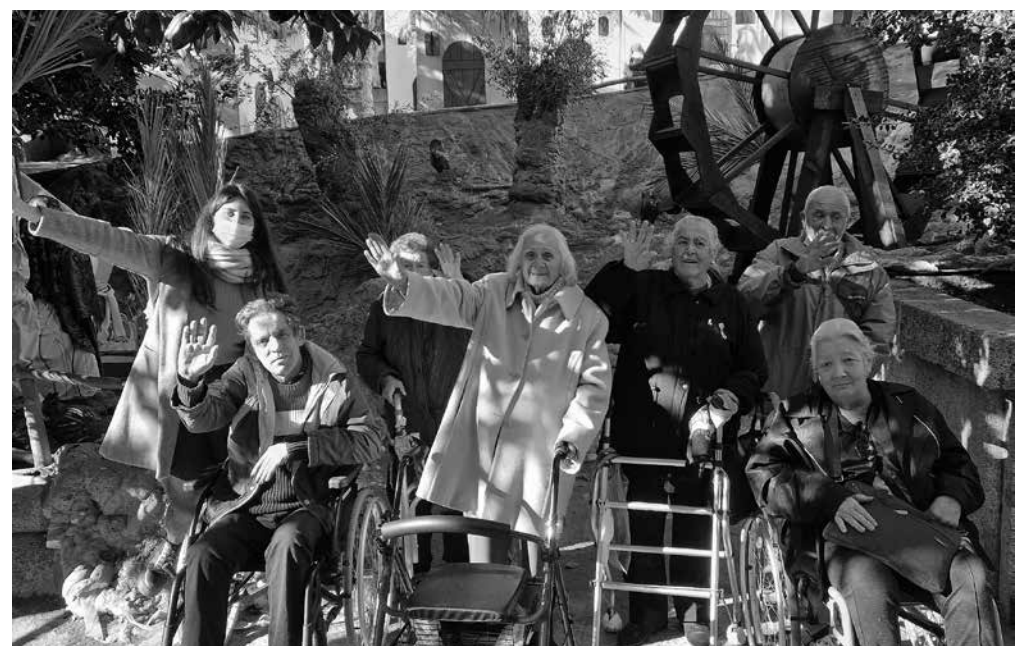
Visita al belén.

Como tradicionalmente se viene haciendo en nuestra residencia de Pozuelo, cada año, nuestros residentes tienen la oportunidad de visitar el belén de San Lorenzo de El Escorial de acceso libre y gratuito. Lo que caracteriza este belén son sus figuras a escala real. Este gran belén cuenta con alrededor de 500 figuras hechas de madera, papel pintado y tela. Los residentes disfrutaron mucho viendo todos los personajes y animales del belén que se encontraban dentro de la lavandería, establos, panadería, herrería, el castillo de Herodes... Sintiendo que formaban parte del belén.