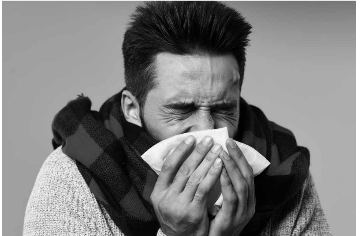
¿Gripe o resfriado?

Con la llegada del invierno aparecen enfermedades propias de temporada como la gripe y los resfriados comunes. Te enseñamos a reconocer las características de cada una y a diferenciarlas. La gripe es una infección de la nariz, garganta y pulmones. La incubación dura entre 48 y 72 horas y surge de forma brusca. Sus síntomas son dolor de cabeza, fiebre alta, dolor muscular y de garganta, congestión nasal, tos seca, debilidad y cansancio. Su duración va desde los 5 a los 15 días. Es muy contagiosa y la vía de contagio suelen ser las gotitas procedentes de la tos o los estornudos. El resfriado, sin embargo, es una infección de las vías respiratorias altas. Lo causan 200 virus diferentes. La incubación es de 48 a 72 horas y se va paulatinamente. Sus síntomas son la congestión nasal, rinorrea, dolor de garganta, irritación ocular, estornudos y tos. Suele durar 7 días y la tos puede durar hasta 2 semanas. Se contagia por