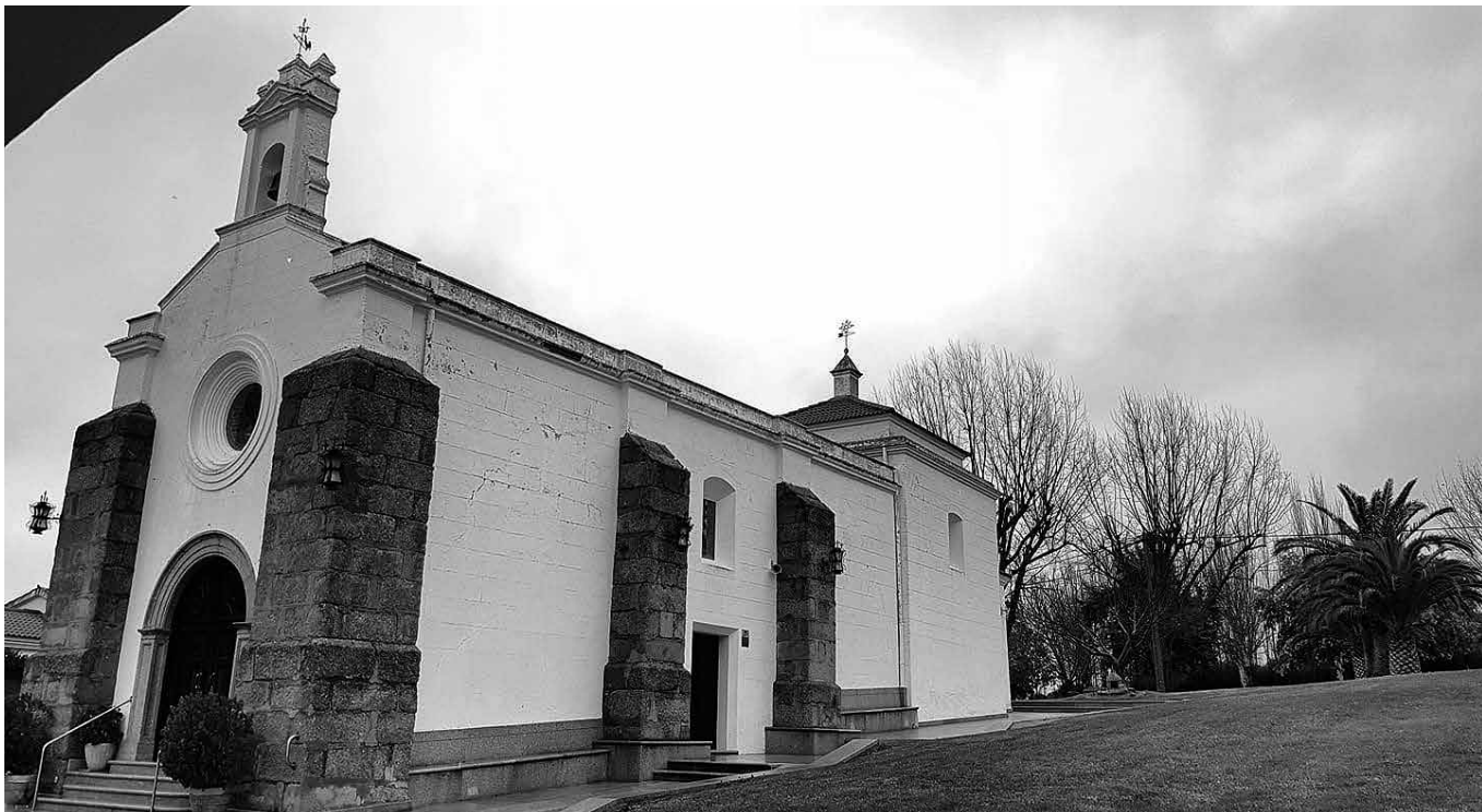
La Ermita Virgen de las Cruces, Don Benito, Badajoz.