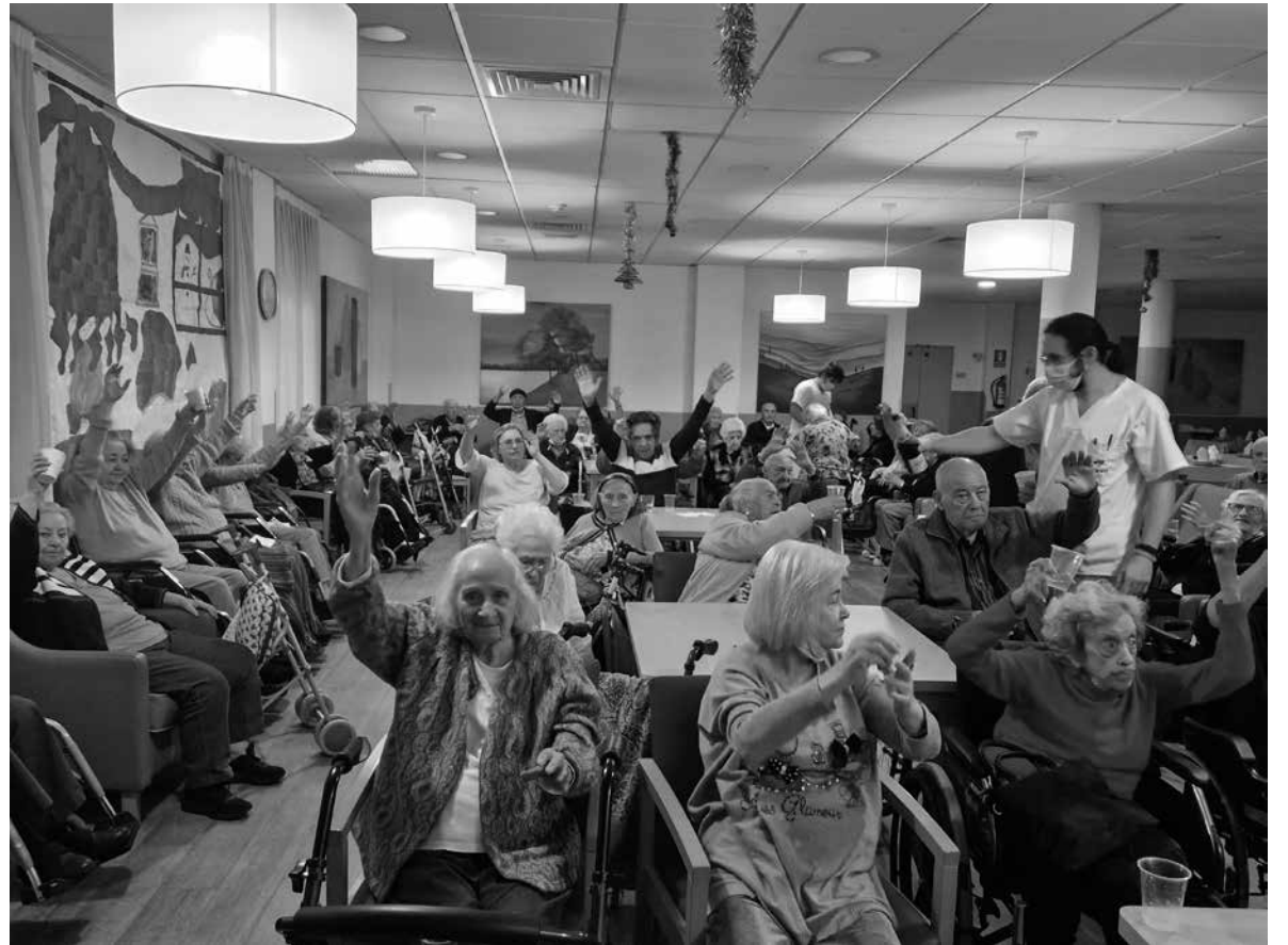
Preuebas en la residencia.

Otro año más celebramos las Navidades en Amavir Pozuelo. Pudimos disfrutar de una gran variedad de actividades y excursiones con nuestros residentes. Visitamos los Belenes de Pozuelo de Alarcón y de San Lorenzo de El Escorial. También degustamos dulces en el mercado navideño de Nuevos Ministerios. Pudimos disfrutar el arte moderno en el Palacio de Cibeles y tuvimos grandes actuaciones aquí, en nuestra residencia. Una fabulosa actuación de los cuentacuentos “Los mayores cuentan”, un impresionante y dulce bingo de los voluntarios de Mondelēz, actuaciones del mítico dúo “Dos por uno”, preciosos villancicos cantados por los colegios de San Luis de los Franceses y el colegio “Alarcón”, la actuación de baile de la escuela K’arte y nuestra ya tradicional cabalgata de los Reyes Magos de Oriente. Sin olvidar otra tradición de estas Navidades en la residencia que es el Escape Room navideño, diversas pruebas con temática navideña que deben realizar nuestros residentes para salir de la sala. Un karaoke navideño con villancicos cantados