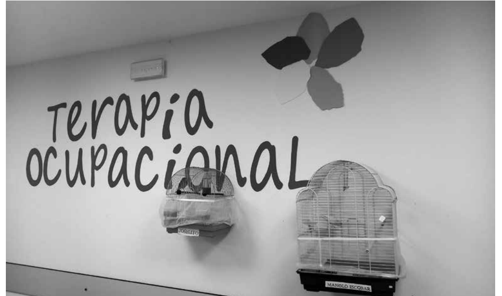
Nuestra emisora favorita.

Muchos de nuestros residentes son grandes amantes de los animales. En los jardines del centro nunca falta ese pequeño cuenco para los gorriones. Varios de nuestros residentes se preocupan de que estén siempre llenos en época de calor, por no decir que siempre guardan pan de las comidas para dárselo y pasar un rato de revoloteo en el jardín. Hablando con los residentes, muchos de ellos nos manifiestan tener el recuerdo entrañable de haber tenido algún animal cerca en sus vidas. Recuerdan con cariño esos pajaritos o pequeños animales domésticos como perros o gatos de su niñez. Incluso muchos de ellos se acordaban de los nombres y referían haber tenido en sus casas un pájaro que les alegraba las mañanas con sus cantares y ponía hilo musical en sus hogares. Así fue como llegaron a nuestras vidas “Manolo Escobar” y “Joselito”. Dos preciosos canarios que han sido bautizados por nuestros residentes y haciendo honor a sus nombres se