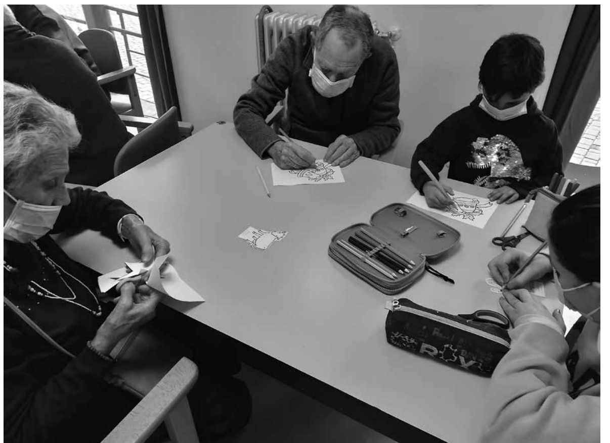
Nuestros mayores disfrutando la energía de los pequeños.

El pasado 19 de diciembre se llevó a cabo una actividad intergeneracional junto a los niños del Colegio de Patones. Con motivo de las fiestas navideñas realizamos dos actividades de esta temática. Los niños prepararon una escena del nacimiento de Jesús y cantaron un popurrí de villancicos mientras los residentes los acompañaban al ritmo de panderetas, cascabeles y tambores. Posteriormente, realizamos varios grupos de niños y residentes para llevar a cabo una actividad manual que consistió en elaborar un portal de belén, el cual pasó a formar parte de la decoración navideña de nuestra residencia. Para finalizar, los niños entregaron a nuestros mayores unas postales navideñas que habían hecho con mucho cariño, y para sorpresa de ellos, nosotros también les brindamos unas que habíamos diseñado con mucho más amor si cabe. Fue un día muy especial en el que nuestros mayores se sintieron acompañados y contagiados por la alegría de los pequeños del pueblo.