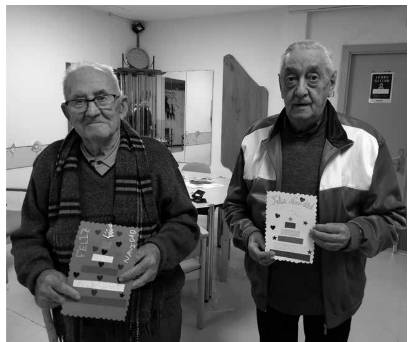
Un bonito detalle navideño.