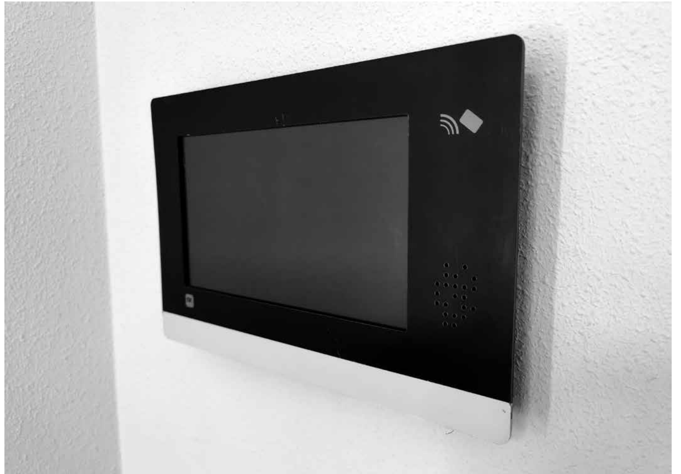
Las nuevas pantallas de llamada.

Como ya sabéis, en el centro estamos instalando un nuevo sistema de llamada que sustituye al actual sistema de timbres. Esta nueva herramienta y tecnología, consta de una pantalla táctil con comunicación por voz desde la cual el residente puede avisar al personal de atención directa o a enfermería en caso de necesitarlo. Se puede configurar para que los avisos lleguen de forma automática a cualquier teléfono o que suenen en secuencia varios, en el caso de que el primero no conteste. Quien atienda esa llamada podrá usar una tarjeta personal para efectuar los registros oportunos (hora de presencia, tareas realizadas...). Además, se han instalado sensores en algunas camas para que, en caso de que el residente salga de la cama, se envíe un aviso al teléfono asignado. Esperamos que este nuevo dispositivo nos ayude a mejorar la atención que prestamos a nuestros usuarios.