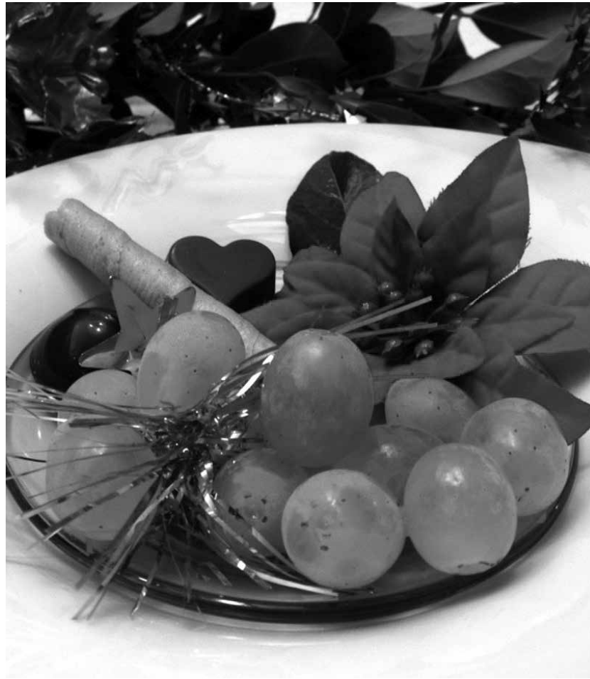
Las 12 uvas, una tradición española.

Comer uvas en Nochevieja es una tradición española que nació en 1882 como una forma de los ciudadanos madrileños de quejarse por la desigualdad de clases con respecto a la celebración de las Navidades. Y es que se había puesto de moda entre la clase alta burguesa juntarse a cenar la noche del 25 de diciembre y tomar uvas y champán. A modo de mofa, algunos de los ciudadanos se dieron cita en la famosa Puerta del Sol para comer uvas (se dice que ese año hubo excedente de esta fruta) y celebrar la entrada del año nuevo. Esta acción de revuelta provocó tanto interés que comenzó a celebrarse en otros lugares de España hasta convertirse en lo que hoy conocemos. ¿Y por qué uvas y no otra comida? La uva es un alimento que se ha asociado tradicionalmente