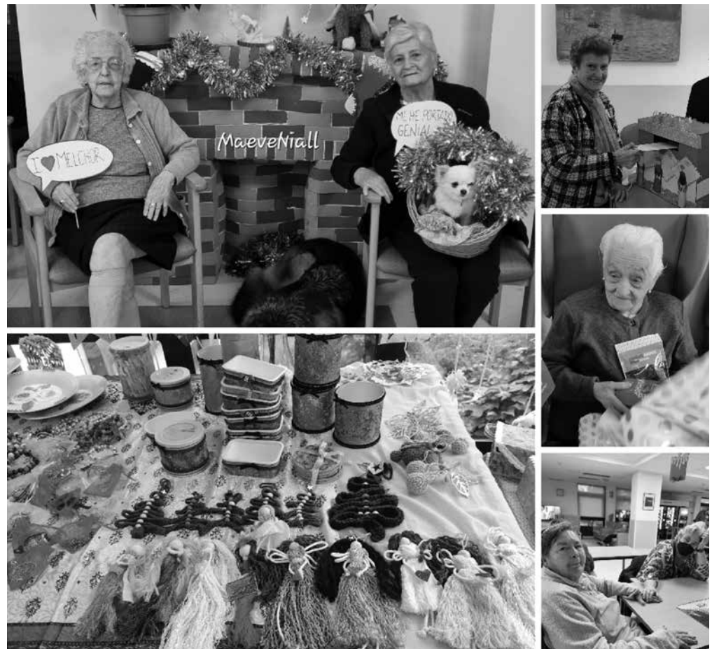
¡Qué bien lo pasamos!

Queríamos aprovechar esta sección para recordar las actividades realizadas en La Marina durante estas Navidades. Nada más comenzar diciembre nos pusimos manos a la obra con la decoración del centro. Las paredes y los techos de las unidades de convivencia y recepción se llenaron de espumillones, bolas y campanas de fieltro hechas a mano en años anteriores, y las puertas de las habitaciones fueron decoradas con marcos navideños con las fotos de cada residente. En la unidad de jazmines se llevó a cabo un taller de decoración de renos de madera, donde dieron rienda suelta a su imaginación. Cinco de nuestros residentes tuvieron su minuto de gloria televisiva al ser grabados en un especial de El Hormiguero, emitido el día 23 en el que comparaban los regalos de antes con los de ahora. ¡Tenéis que verlo! Los chicos y chicas del Instituto Joan Miró y la Fundación Adopta Un Abuelo nos enviaron cartas y postales navideñas, las cuales comenzaremos a contestar en cuanto podamos. ¡Nos hizo mucha ilusión recibir las! Y, no hay una Navidad que se precie sin Nochevieja. Así pues, con todas las medidas preventivas posibles, el 31 a las 12:00 h nos comimos las doce uvas con las cam-