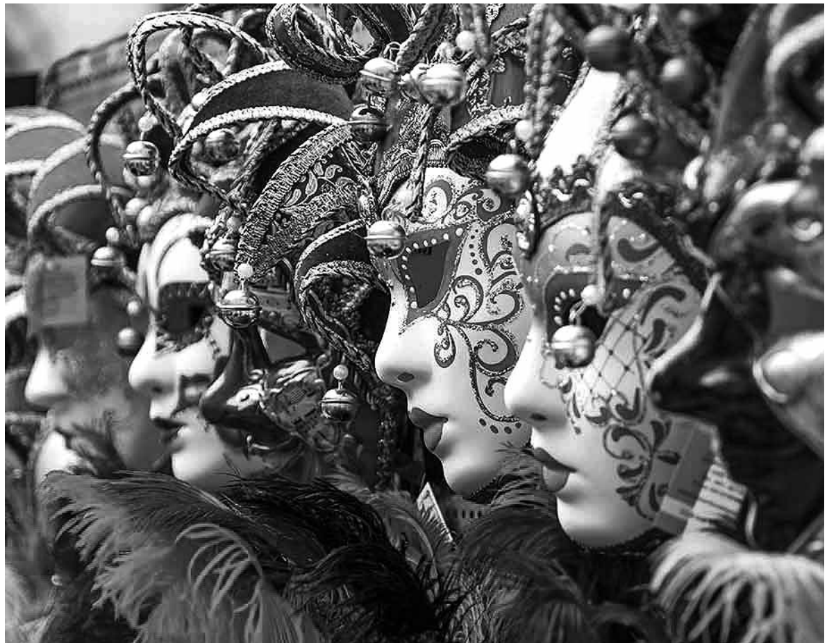
Máscaras de Carnaval.

Los preparativos para celebrar esta alegre y divertida festividad de Carnaval llenan de color y risas todas y cada una de nuestras estancias. Y lo mejor de todo, es además que, al mismo tiempo, se promueven importantes beneficios terapéuticos para los mayores. Se trata de un trabajo conjunto por parte de nuestro equipo de educación social y terapia ocupacional. Con la creación de los elementos ornamentales para los distintos salones que se realizan en los diferentes talleres y la confección de los propios disfraces, se trabaja tanto la motricidad fina, como la funcionalidad de los miembros superiores, así como la concentración, la atención, la creatividad, la memoria y la autodeterminación. El hecho de que se elaboren elementos simpáticos, coloridos y divertidos favorece a que mejore la autoestima, la comunicación y la socialización de manera especial. Se presenta como una actividad terapéutica y de ocio, donde, además de motivar y suscitar la participación proactiva de cada residente en las múltiples actividades, estas les ayudan a tener conciencia de la actualidad temporal y social en la que se encuentran.