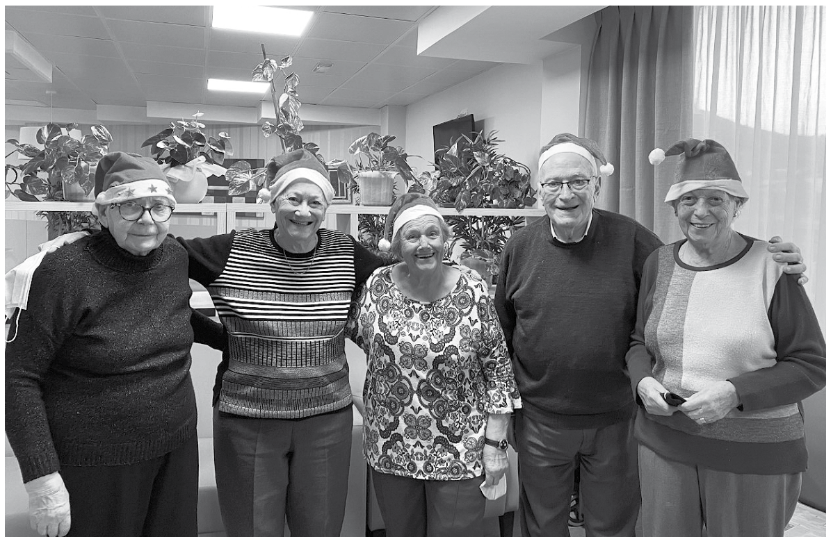
Nuestros residentes en el taller de villancicos.

Las navidades son siempre una fecha señalada y muy esperada por algunos de nuestros residentes. En Amavir Horta intentamos generar un espacio cálido y un sentimiento parecido al hogar para que en estas fechas todos podamos sentirnos unidos. Por ello, la residencia se tiñe de luces navideñas, las diferentes estancias se disfrazan de color y todo tiene otra visión. Empezamos las Navidades decorando la recepción, montando el árbol de Navidad, el belén, decorando los pasillos y el centro de día. Tuvimos una actuación de la coral con villancicos tradicionales y otros más innovadores. En el Bingo, hubo regalos para los afortunados y caramelos para los menos suertudos. Como cada año, preparamos nuestra parada con objetos confeccionados por nuestros residentes, hicimos un sorteo de las cestas y de la lotería de Navidad con premio asegurado. No hay Navidad sin degustación. Nos pusimos finos con panettone italiano, barquillos, galletitas y otros dulces propios de este momento. La visita de los Reyes Magos