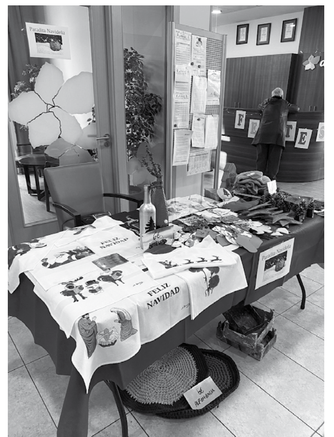
La paradita navideña.

dico, favorecer la inclusión al centro, el reconocimiento de pertenencia al grupo y la convivencia. Se trabaja la atención-concentración, la psicomotricidad fina, el cálculo, el reconocimiento, la reminiscencia y la memoria. En este taller se observan los gustos e inquietudes de los residentes para ir elaborando una manualidad final entre todos.