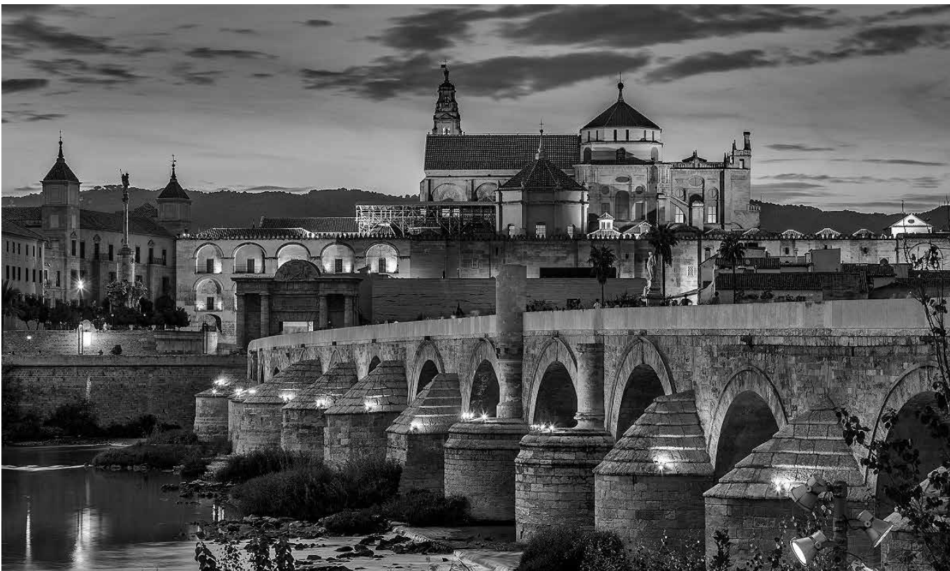
Córdoba, una ciudad situada en una depresión a orillas del Guadalquivir.

Mi tierra se encuentra a 860 kilómetros de Barcelona, situada al norte de la comunidad autónoma de Andalucía, esa es mi tierra, Córdoba. Tierra rica en tradiciones, con un impresionante patrimonio monumental, con su Mezquita-Catedral, puente romano, la famosa judería con sus calles llenas de flores, Medina Azahara y un sinfín de rincones para