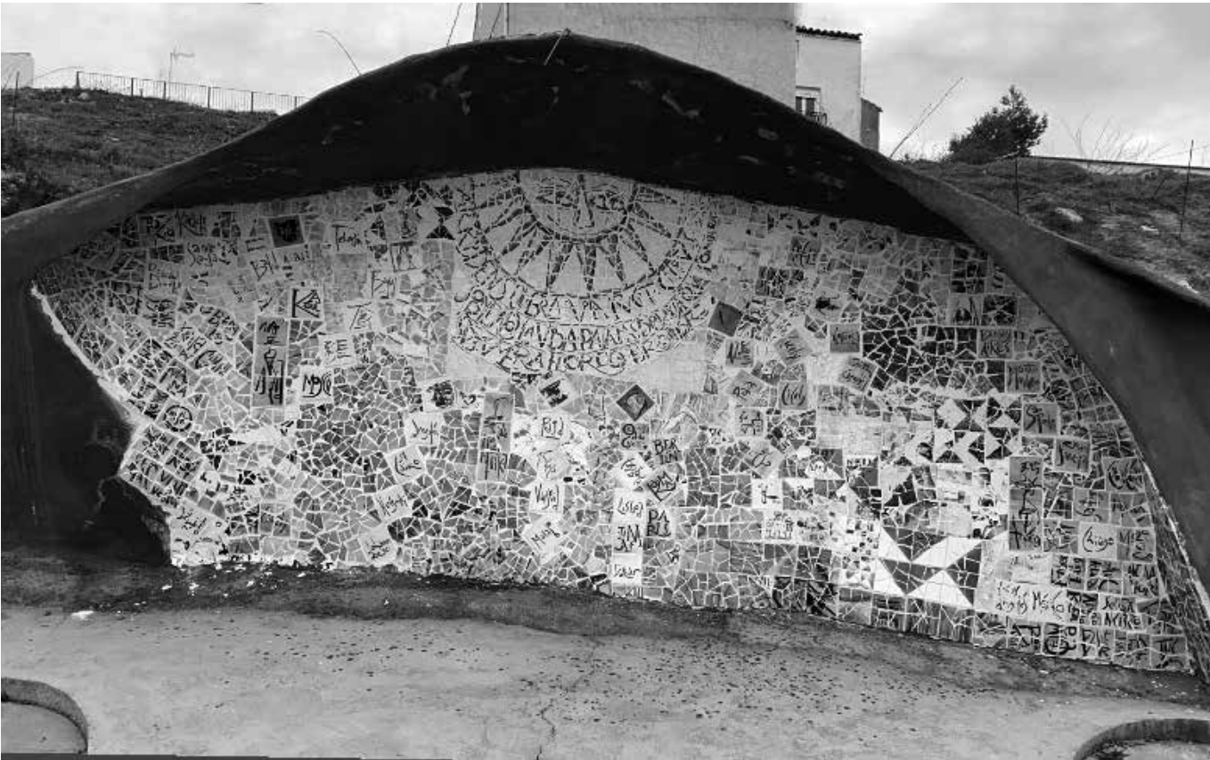
Escultura característica del pueblo.