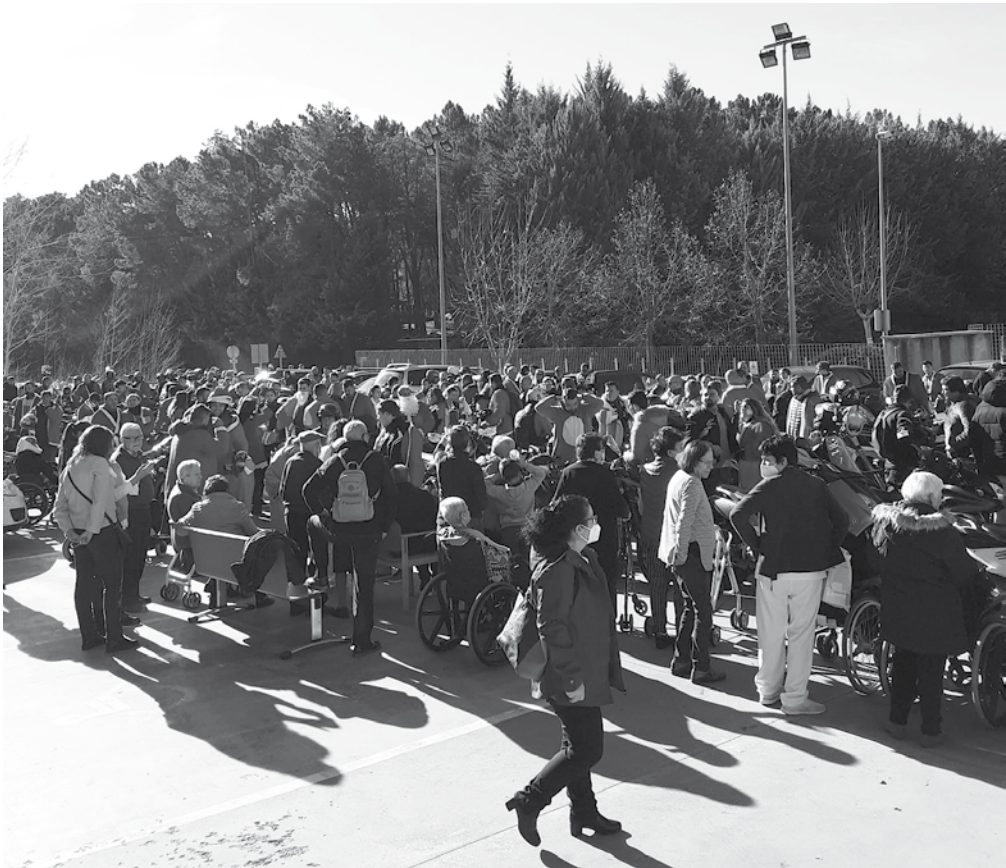
La visita de los Papás Noeles moteros.

Las Navidades han estado repletas de actividades y es que, estas fechas, no merecen menos. Como es habitual, empezamos con los preparativos unas semanas antes con el taller de manualidades, durante el cual realizamos unos peculiares servilleteros para adornar las mesas del comedor en los días señalados. Seguimos con el cántico de villancicos por las tardes en los que, algunos días incluso tocamos un organillo. Como broche final a los preparativos, dimos la bienvenida a la Navidad decorando el centro. No podemos olvidar el paso de las míticas rondallas de nuestra ciudad: ‘Los arrabales’, ‘Voces y esparto’ y ‘Grupo torcas’ pusieron la nota musical a estas fechas. Una de las actividades que, en pocos años, se ha convertido en una de las favoritas de nuestros residentes es la original visita de los Papás Noeles moteros y es que siempre les sacan una sonrisa. También quisimos aprovechar el ambiente navideño de la ciudad, por lo que nos fuimos a visitar el mercadillo navideño y el belén de la diputación. Por último, como no podría ser de otra manera, despedimos las Navidades con la visita de Sus Majestades de Oriente, quienes entregaron un obsequio a cada uno de nuestros residentes y