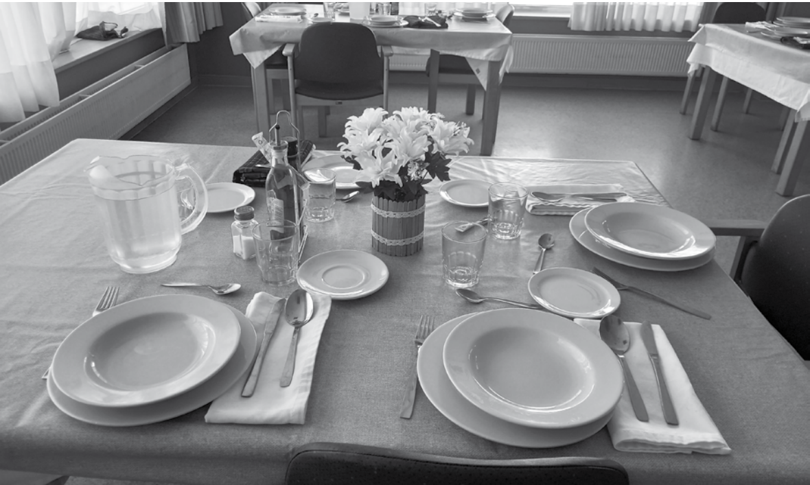
Así de bonitos lucen los centros de mesa.

Los trabajos manuales siempre son una tarea que gusta mucho a nuestros residentes y usuarios de centro de día, por este motivo nos hemos puesto manos a la obra. Siguiendo nuestra línea de compromiso con el medio ambiente, decidimos aprovechar los botes de leche vacíos para elaborar unos bonitos centros de mesa que decorarán las mesas de los comedores. Palitos de madera, pinturas y pinceles fueron nuestros materiales aliados para decorar nuestros centros. Como toque final, añadimos unas flores artificiales para que quedasen más agraciados.