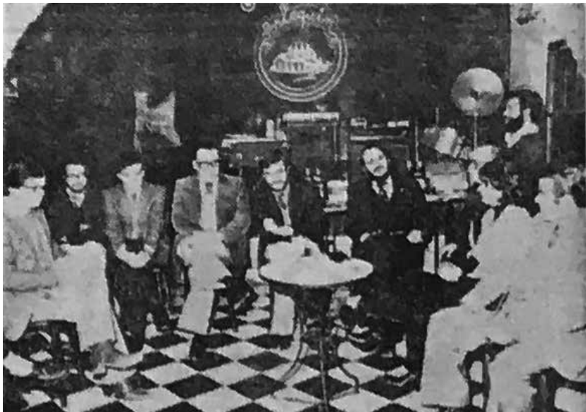
Presentación del I Festival Nacional de Jazz de Cartagena.

El Arlequín era uno de los bares con más solera de nuestra ciudad. Situado en el barrio del Molinete, se inauguró en 1980. Sus primeros propietarios eran aficionados a tocar jazz, algo que pudieron vincular con el local. El mes de diciembre del mismo año se presentó en el local el primer Festival Nacional de Jazz en Cartagena, suponiendo un hito en la historia musical de la ciudad. Tuvo lugar en el Pabellón Municipal de Deportes y en la cuesta de la Baronesa. El coste del festival fue de unas 700.000 pesetas, fue asumido por el Consejo Regional y por los locales, del montaje se encargó el Ayuntamiento. En diciembre de 1982 se constituyó el Jazz Club Cartagena, con sede en el Arle-