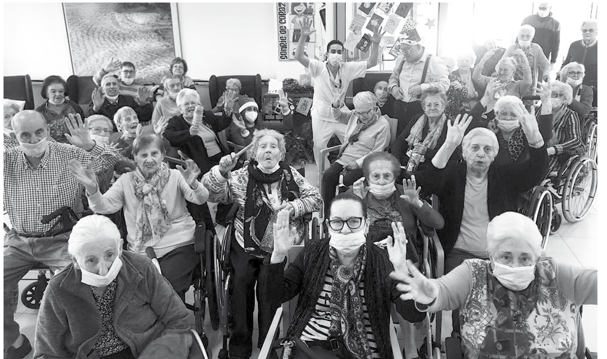
Visita de Mamá Noel a la residencia para celebrar la Navidad

Esta Navidad, por fin, pudimos celebrar esa época festiva en la que nos gusta estar con nuestros seres queridos y, nosotros, como una gran familia, también la celebramos con mucho cariño. Unos días entrañables, de ocio, de villancicos y de mucho espíritu navideño. Tuvimos encuentros intergeneracionales con el instituto de El Bohío, el Mediterráneo y el Colegio de la Asomada, en los que los niños cantaron villancicos, trajeron regalos y alegraron a nuestros residentes. El día del Sorteo de Navidad en todas las estancias se escuchaba a los niños cantar los números con el tono tan característico que muchos recuerdan. Para festejarlo hubo un desayuno especial en el que tomaron bollos con chocolate. Los residentes pasaron una mañana haciendo rollos de pascua, revivieron recuerdos amasando, enrollando, pintando y espolvoreando el azúcar que degustaron al día siguiente. Gracias a la Asociación de Taxi de Cartagena tuvimos la suerte de poder ver cómo Cartagena se encontraba