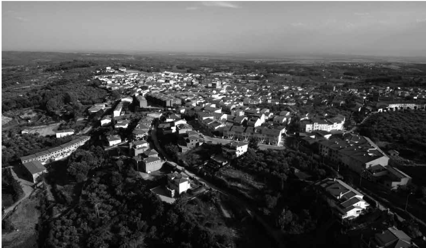
Jaraíz de la Vera, un paisaje que enamora.