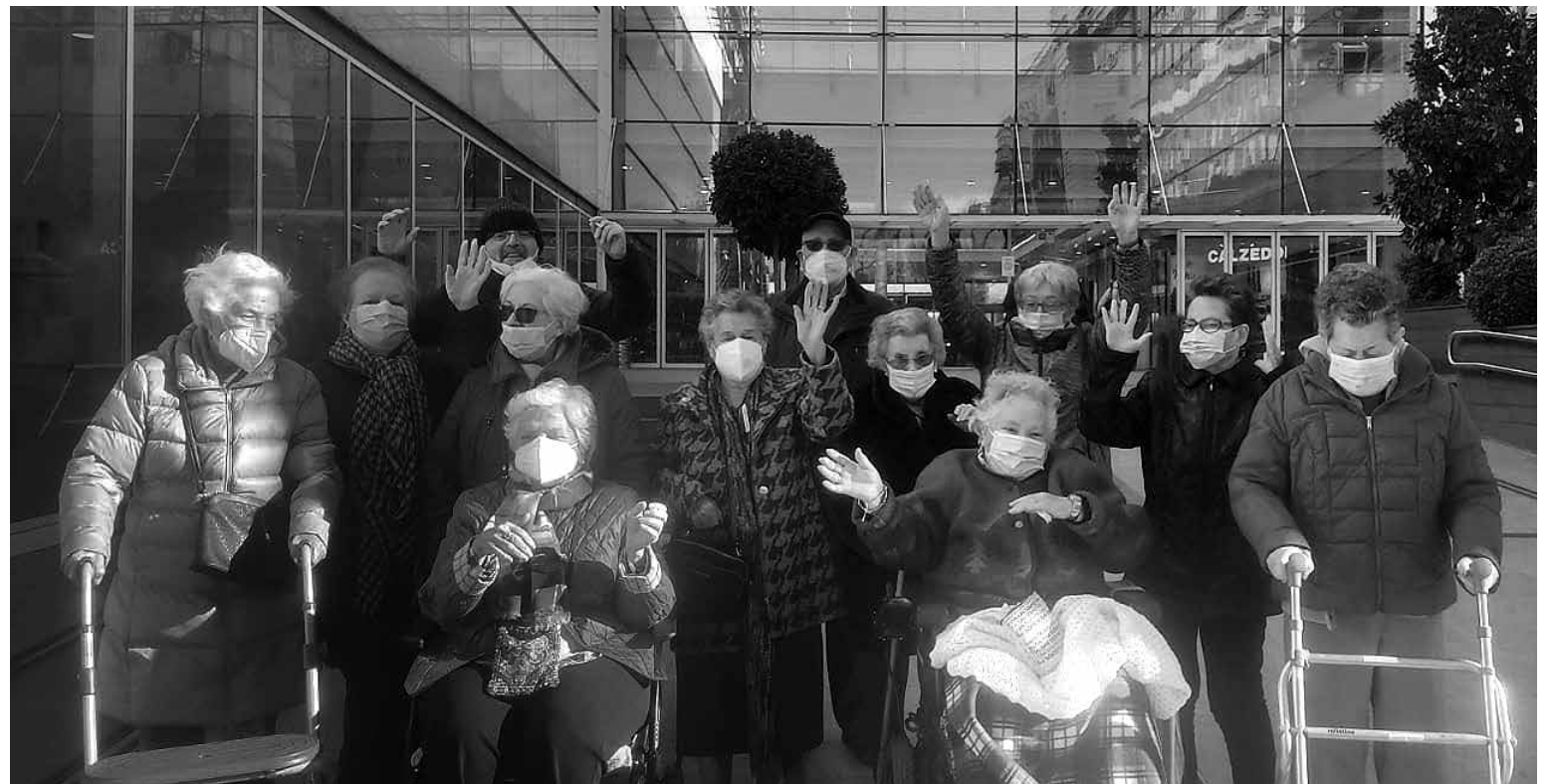
Siempre con ganas de pasarlo bien.

Descansar, pero poco tiempo. Tras estas fiestas tan emotivas, divertidas y tradicionales descansaremos unos días para reponer tanto nuestro cuerpo, como nuestro estómago. Recordad que dentro de un suspiro tenemos los carnavales del centro, famosos por sus divertidas actuaciones y pasarelas de nuestros residentes, siempre dispuestos a disfrutar de la vida y sus placeres junto con el baile y la música, dos de sus actividades preferidas. Otra muy importante para ellos son las rebajas. Siempre hay algún capricho que se pueden permitir, presumir con las compañeras y ver las últimas tendencias, aunque