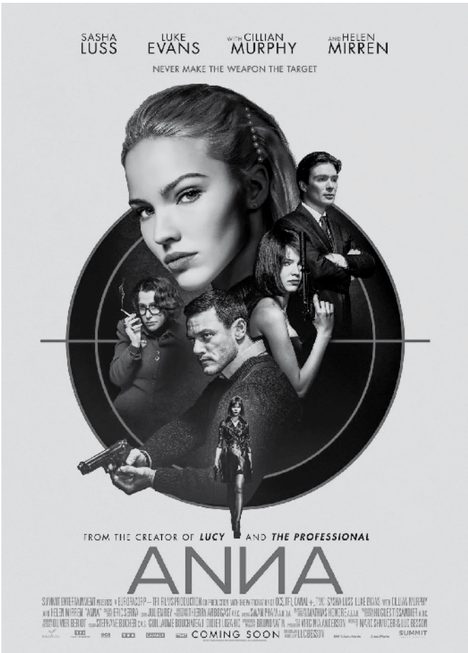
Películas de grandes actrices.

A la hora de pensar en películas de acción, no cabe duda que se nos viene a la mente la saga protagonizada por el agente 007- Bond, James Bond, como él mismo suele decir en algún momento del largometraje. Últimamente han aparecido otra serie de filmes de acción con un agente de la CIA americana al frente de la misma (Bond es británico), el agente Jason Bourne. Tanto en unas como en otras destaca la astucia de sus personajes, así como la maestría de ambos a la hora de repartir golpes en pro de sus objetivos. Pues bien, quiero nombrar hoy dos películas en las que las féminas son las encargadas de llevar a cabo los encargos recibidos sin echar en falta al género masculino. Atómica (2017) y Anna (2019) son cintas en las que Charlize Theron en la primera, y Sasha Luss en la segunda, no dejan títeres con cabeza con recursos mil a la hora de lograr sus metas. Son películas que se repiten con cierta frecuencia