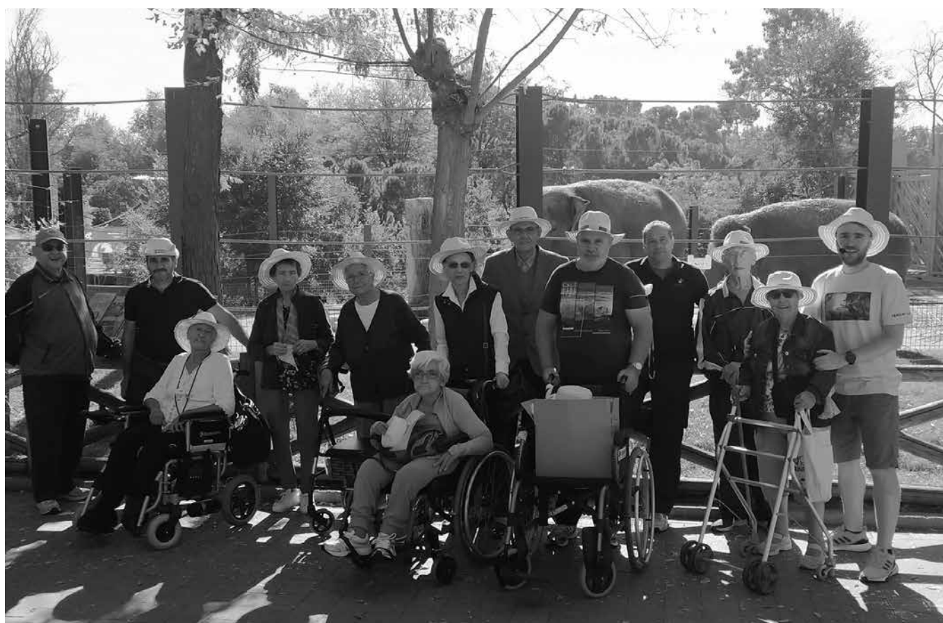
Visitando el zoo.

Con el inicio del 2023 hemos intentado retomar el máximo número de salidas que teníamos antes de la pandemia. Lo primero que queremos poner en marcha es salir todos los martes al mercadillo de Alcorcón, siempre y cuando nos respete el tiempo, para que cada uno pueda realizar aquellas pequeñas compras que necesite, o simplemente, darse un paseo. También estamos hablando con una gran cantidad de museos de Alcorcón y alrededores y también de Madrid capital, como son El Museo del Arte, el de Artes Decorativas, El Prado, el Museo del Ferrocarril y muchos más. Os iremos avisando de aquellas actividades que vayamos a poder realizar.