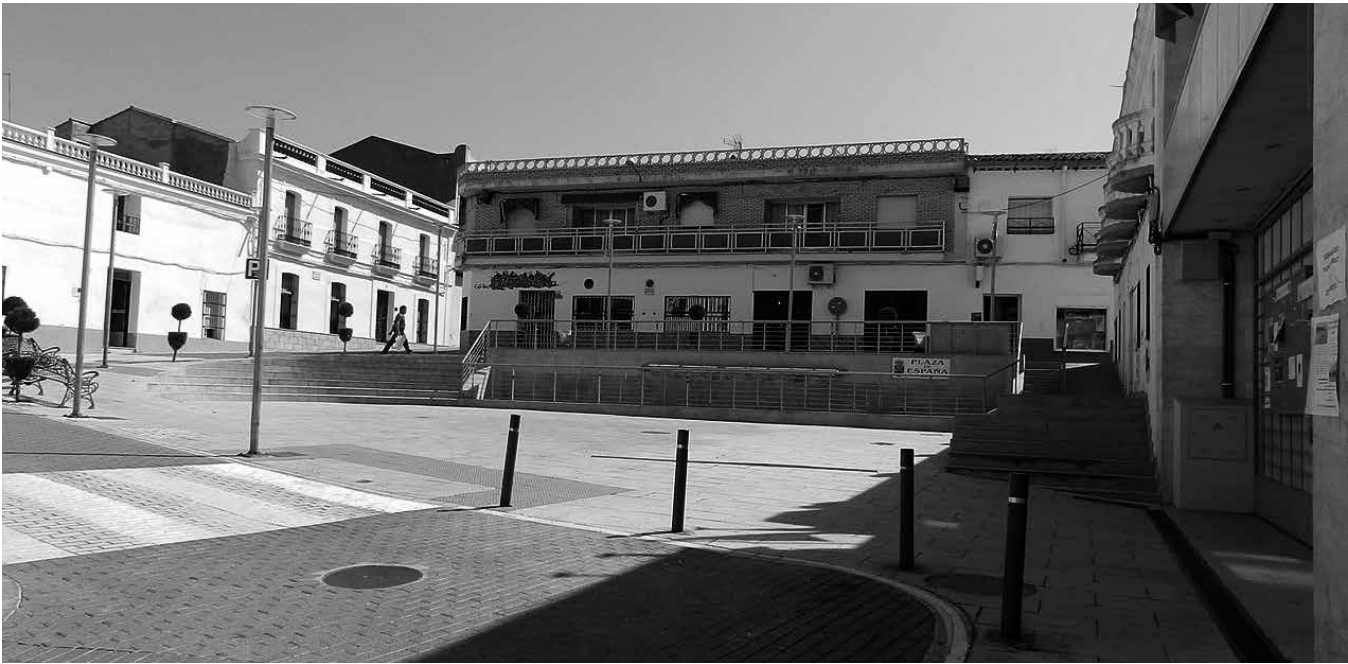
Una de las plazas de Casas de Don Pedro.

Casas de Don Pedro está situado sobre la orilla derecha del río Guadiana, cerca de Navalvillar de Pela y Talarrubias. En su gastronomía sobresalen sus productos de matanza y sus dulces. Los platos más destacados son las migas y el ajoblanco. En cuanto a los postres, son famosos todos los elaborados con miel como las flores y la candelilla, así como los gachones, almendralillos, natillas y bollos de los Santos. Los días de fiesta son Las Candelas el día 2 de febrero, para honrar a la Virgen con el dulce típico del pueblo de la “candelilla”. Se saca a la Virgen en procesión, siguiendo con la degustación de una