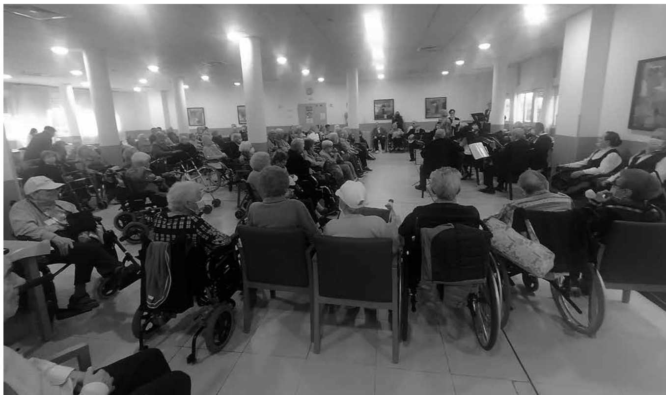
Los residentes disfrutando de una actuación.

¡Por fin! Es lo que podemos decir tras estos años en los que nuestras Navidades han sido diferentes a lo normal. Por fin pudimos disfrutar de un buen número de actuaciones y pudimos realizar actividades fuera del centro con comodidad. Lo primero, queremos agradecerlos por hacernos vivir estas Navidades con más ilusión y alegría que en años atrás. Nos ha encantado poder celebrarlas juntos, con familiares y residentes. Pudimos disfrutar de aquellas personas que más alegría traen a los centros, ¡los niños! Vinieron a visitarnos más de 100 niños estas