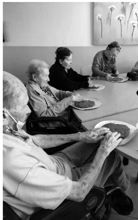
Nuestros mayores en las diferentes actividades realizadas.