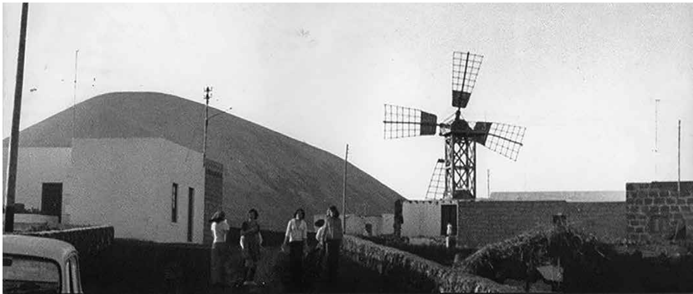
Una foto antigua de Güime.