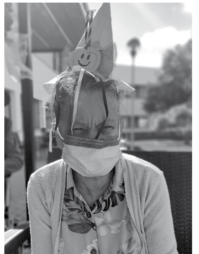
Los disfraces de nuestra fiesta de Halloween.

des incluyeron un taller de cocina temático, donde elaboramos deliciosos dedos de bruja hechos de galleta. Como cierre a las celebraciones, realizamos un concurso de disfraces de lo más animado con premios y música. Estamos enormemente agradecidos a todas las familias que colaboraron para hacer esta fiesta aún más divertida.