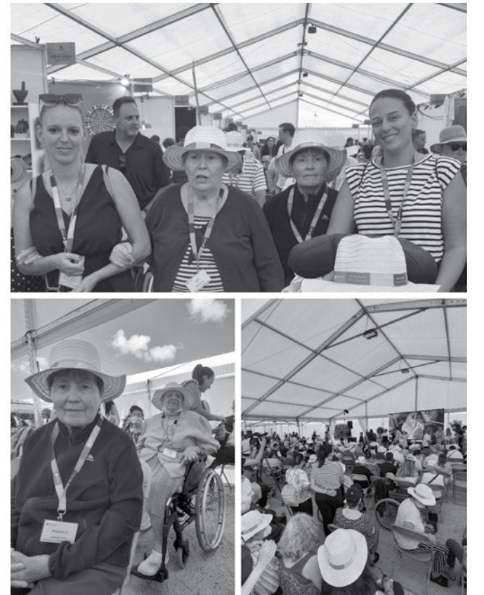
Nuestros mayores en la visita a la feria y a la patrona.

mayores irradiaban felicidad. Sus miradas y sonrisas eran el espejo del alma. Bailaron y acompañaron con palmas hasta llegar la hora de seguir con el recorrido por la feria. Una vez terminada la visita a los artesanos y artesanas que se encontraban en sus puestos, pusimos rumbo al restaurante donde nos invitaron a almorzar. Disfrutamos del almuerzo acompañados de los demás centros y seguimos con la fiesta en el lugar, entre el folclore canario y las canciones más conocidas para poner el broche final a tan bonita jornada. Nuestros residentes están deseando volver y disfrutar un año más de la tradicional visita al pueblo vecino de Mancha Blanca.