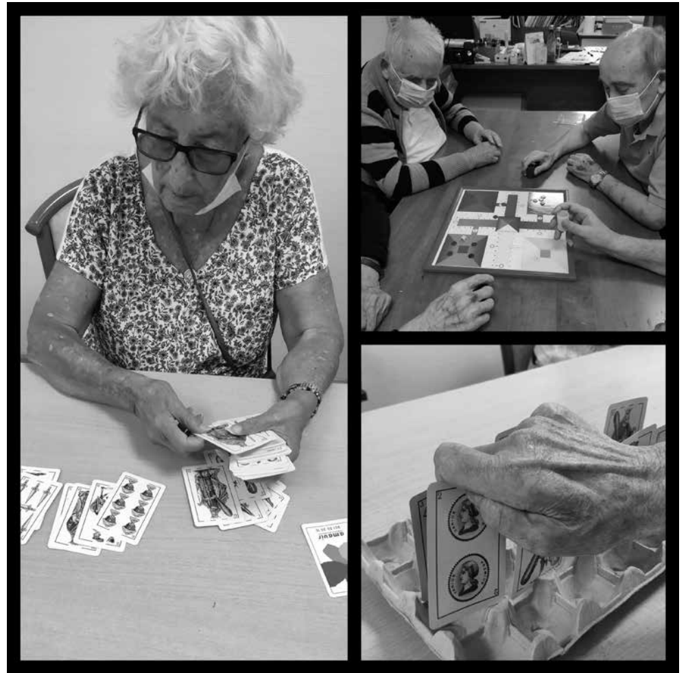
Algunos de los participantes del nuevo taller “ocio autónomo”.

Cuando hablamos de ocio, todos somos capaces de enumerar diferentes actividades lúdicas que provocan una satisfacción personal para el que las practica: jugar a las cartas, hacer deporte, ver películas, pasear, pintar... A pesar de lo importante que es tener actividades de ocio y tiempo libre, muchas veces no se les otorga la importancia que requieren. Tras la jubilación, el tiempo que se dedicaba al trabajo queda libre. La falta de capacidades para reorganizar ese tiempo libre puede provocar diversos desajustes susceptibles de intervención desde terapia ocupacional. El uso del ocio como herramienta de terapia comenzó en la década de los cincuenta en Estados Unidos. Las consecuencias de la II Guerra Mundial favorecieron la aparición de programas de ocio para luchar contra los problemas físicos y psicológicos. Se demostró por vez primera que el ocio contribuye positivamente a la mejora del estado de ánimo y a la recuperación física. Por ello, desde el Departamento de Terapia ocupacional, hemos creado una nueva actividad llamada “ocio autónomo”. Este taller busca motivar a esas personas que carecen de iniciativa para realizar actividades de forma autónoma, a recuperar ese ocio a través de los juegos de siempre como las cartas, el dominó o el parchís. De esta forma recuperamos la funcionalidad del ocio individual y colectivo como área de ocupación humana principal en el último tramo de la vida.