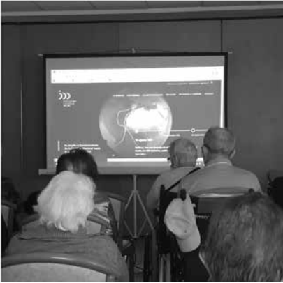
Nuestros mayores en la actividad del viaje virtual por el mundo.