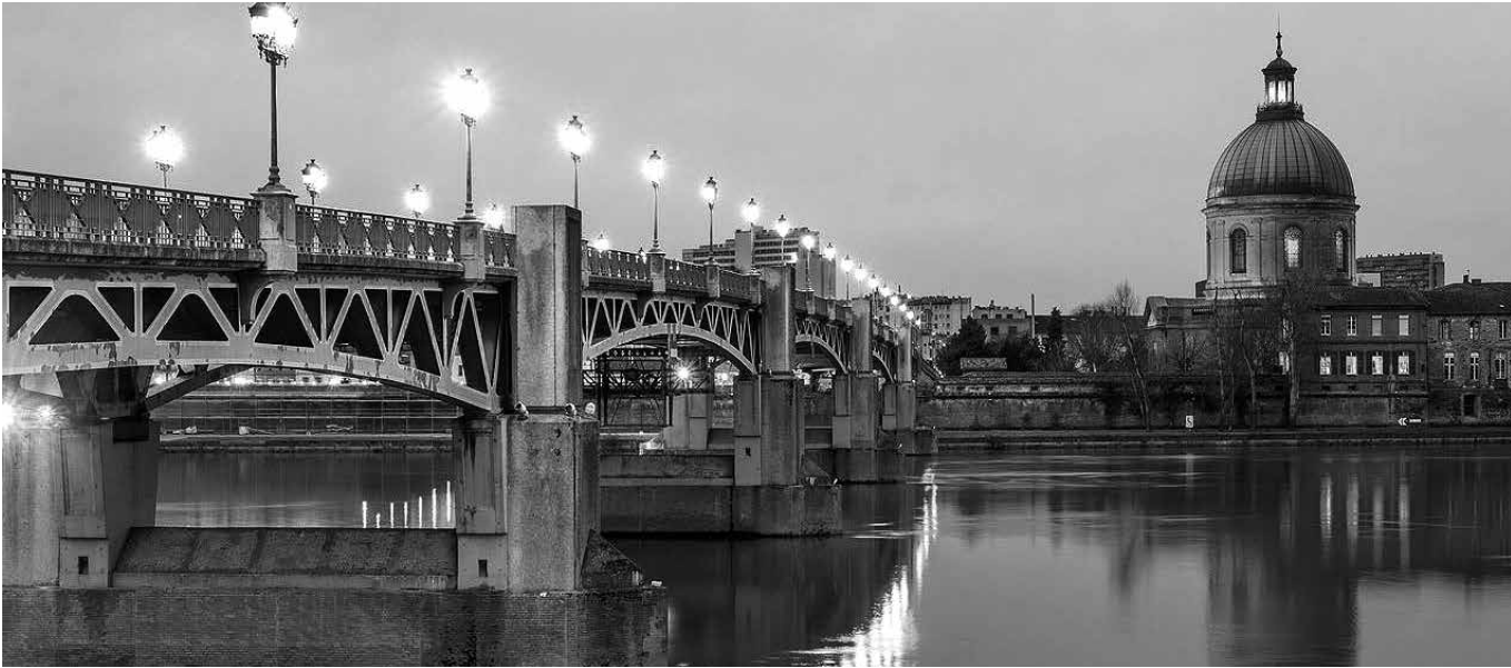
Toulouse, la ciudad más española de Francia.