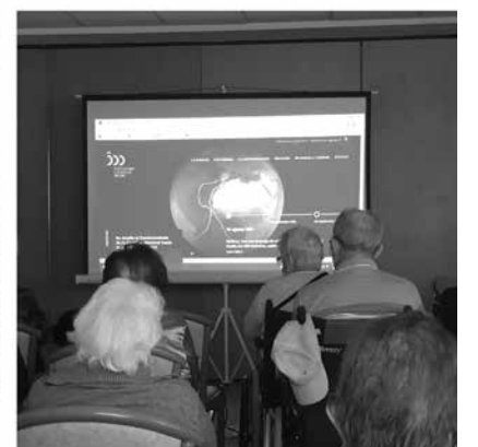
Nuestros mayores en la actividad del viaje virtual por el mundo.