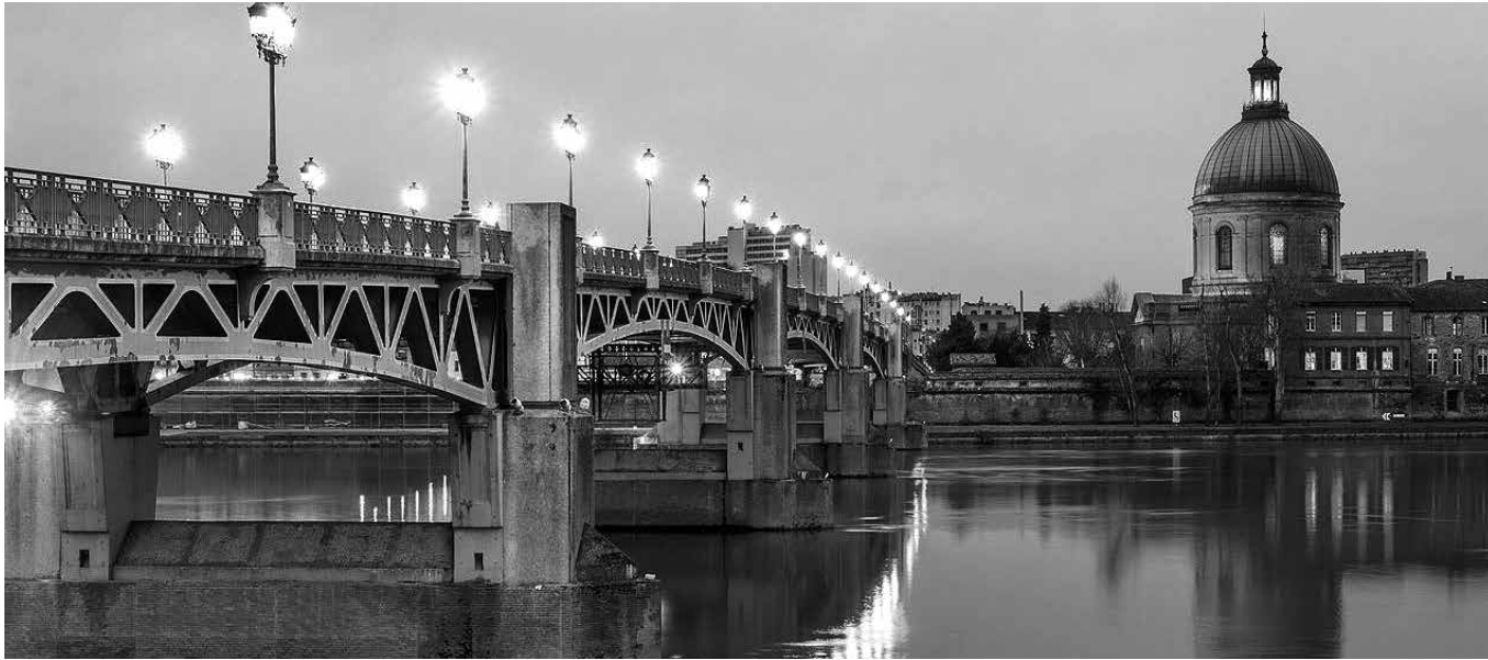
Toulouse, la ciudad más española de Francia.