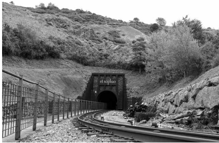
Un bonito lugar para visitar.

El Soplo es una cueva situada en los municipios de Herrerías, Valdáliga y Rionansa en la sierra de Arnero, en Cantabria a una altitud de 540 msnm. Es considerada una cavidad única a nivel mundial por la calidad y cantidad de las formaciones geológicas que alberga en sus 20 kilómetros de longitud total, aunque solo 4 están abiertas al público. En ella se encuentran formaciones poco comunes como helictitas (estalactitas excéntricas que desafían la gravedad) y draperies (sábanas o banderas traslúcidas colgando del techo). Las rocas sobre las que se desarrolla el karst que da lugar a la cueva datan del Mesozoico, concretamente del periodo Cretácico hace 240 millones de años. La cavidad fue descubierta