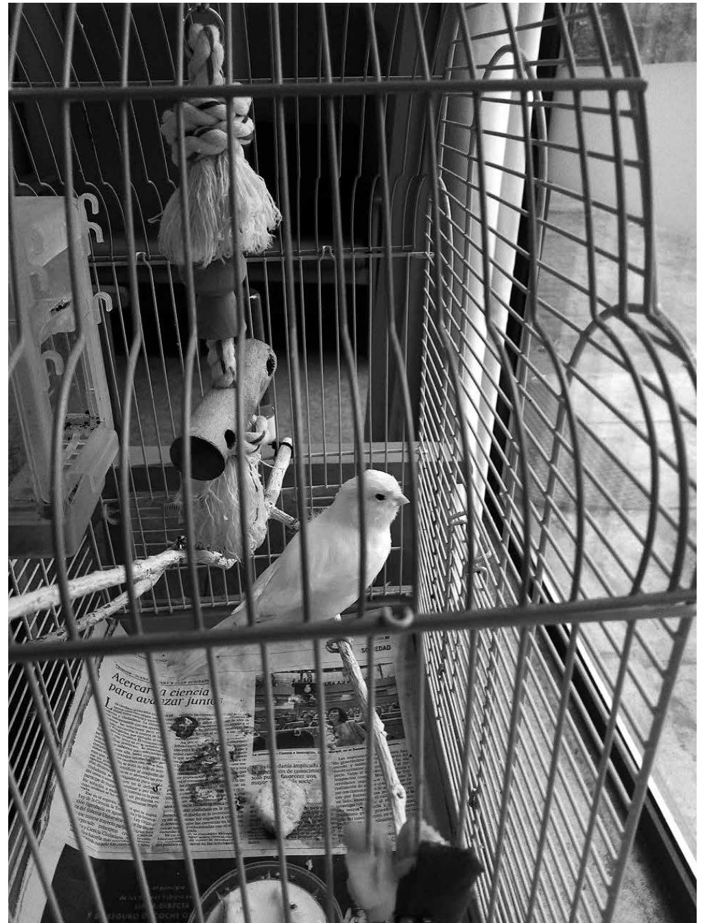
Ya es uno más de la familia.