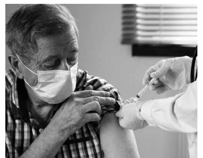
La vacuna contra la Covid-19.

Aunque la incidencia de la Covid-19 ha descendido notablemente, el virus sigue estando ahí y las nuevas variantes también, por lo que los expertos animan a no bajar la guardia y a seguir combatiendo la enfermedad a través de la vacuna. En Amavir Puente de Vallecas comenzó la administración de la cuarta dosis en el mes de octubre. Se trata de una dosis de recuerdo frente a la Covid-19 adaptada a las nuevas variantes en grupos de población muy concretos. Sanidad afirma que estas vacunas son más precisas, que ofrecen una protección más amplia y que los efectos secundarios son similares a los ya administrados. No olvidéis que la mejor fórmula para combatir este virus sigue siendo el lavado de manos, la distancia y la ventilación. ¡No bajéis la guardia!