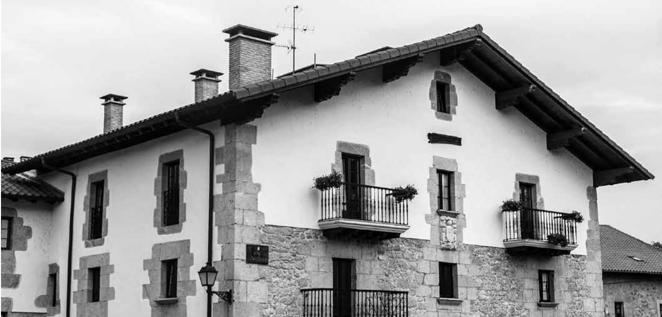
Casa de Lekunberri.