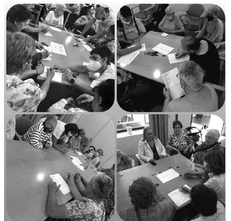
Los participantes durante la yincana.

El 21 de septiembre se celebra el Día Mundial del Alzheimer, proclamado por la Organización Mundial de la Salud (OMS). Según datos de la OMS, la enfermedad de Alzheimer es la forma más común de demencia. Se calcula que representa entre un 60 % y un 70 % de los casos. El alzhéimer es un tipo de demencia que causa problemas con la memoria, el pensamiento y el comportamiento. Los síntomas generalmente se desarrollan lentamente y empeoran con el tiempo. En el centro, realizamos esa mañana una yincana con ejercicios de memoria y se les explicó unos conceptos básicos sobre la enfermedad. Todos los residentes que participaron disfrutaron de la competición.