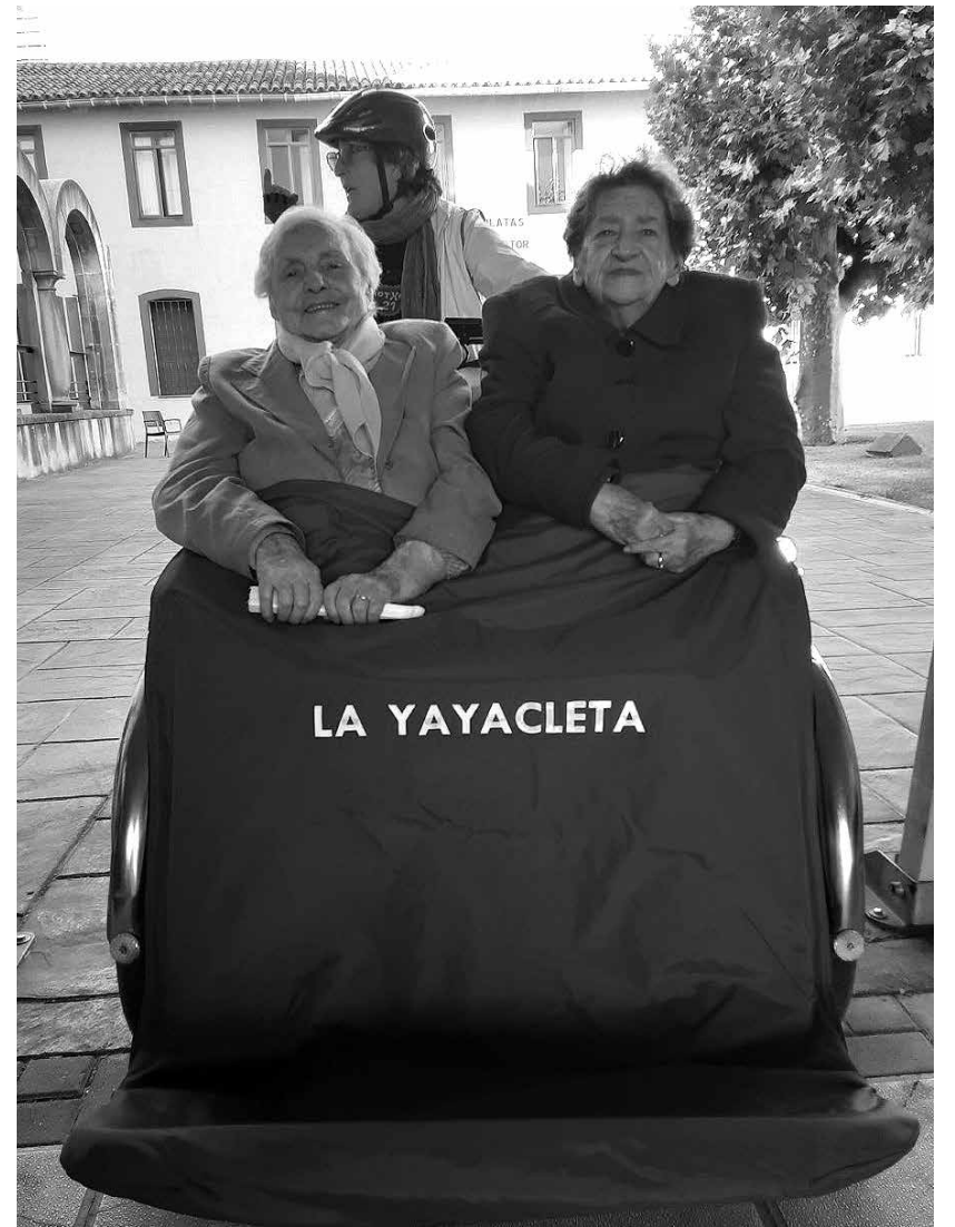
Nuestras residentes preparadas para dar el paseo en yayacleta.