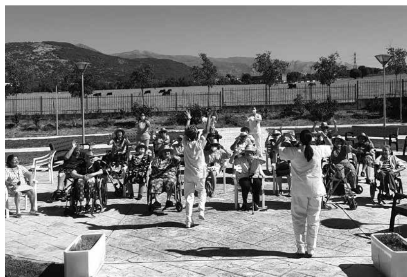
Las artistas más actuales durante la grabación del vídeo Motomami, búscalas y alucinarás...

Os presentamos nuestra versión “Despechá”, por las chicas más molonas del panorama mundial: Baby, ya te llamaré para contarte que esta mañana de septiembre, hemos salido al jardín para disfrutar del buen tiempo y las amigas bailando música divertida y marchosa con gestos muy molones con palmas y bailando a tope, aunque fuera sentaditas. Mis amigas y yo queremos lo bueno de la vida, sin complicarnos con problemas, olvidando lo malo y quedándonos con lo bueno y la mejor compañía. Y, ¿sabes qué?, esta canción es muy famosa, la cantante es una chica muy guapa que se llama Rosalía y nos encanta estar al día y sobre todo divertirnos juntas moviéndonos a buen ritmo. La próxima vez vente baby, que te dejo la “Motomami”.