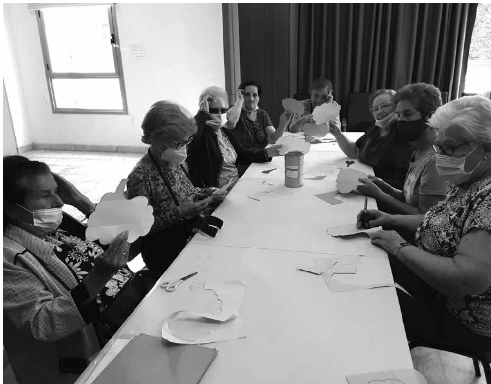
Nuestras residentes en el taller de ergonomía.

En invierno pasamos más tiempo en el interior, puede ser un buen momento para descubrir aspectos de uno mismo y potenciarlos construyendo nuevas aficiones y hábitos saludables que nos ayuden en nuestro proceso de crecimiento personal. Siempre resultan posibles actividades de ocio personal que podemos explorar, realizándonos algunas para conocer nuestras capacidades y canalizarlas en actividades acordes con ellas, por ejemplo: - ¿Qué me gusta hacer?, ¿con qué cosas disfruto? - ¿Qué me gustaría hacer? - ¿Podría probar a pintar con pincel?, ¿me gustaría aprender y pintar un cuadro? - ¿Podría probar a cantar en un coro?, ¿y en un grupo de música? - ¿Podría probar a actuar en un teatro? - ¿Podría probar a bailar sevillanas, jotas, muñeiras...? - ¿Me hubiera gustado conocer un determinado lugar, monumento, pueblo, provincia o país...?, gracias a Internet es posible así que, aprovechemos. - ¿Qué se me da bien? Puedo enseñar aquello que se me da bien hacer, cosas que sé y puedo recordar y enseñar a los demás. Es importante mantener nuestra mente activa con ideas motivadoras que nos ilusionen y construyan