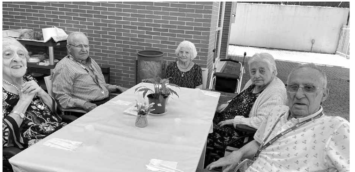
Nuestros residentes comiendo en el jardín.