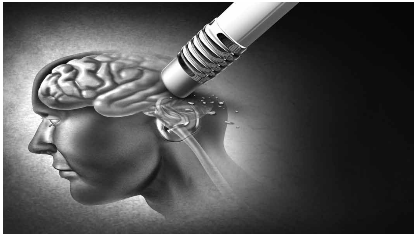
El olvido en el Alzheimer.

La enfermedad de Alzheimer (EA) fue descrita por primera vez por el patólogo y psiquiatra Alois Alzheimer. Es una enfermedad neurodegenerativa que suele tener un inicio lento y silencioso. Es irreversible y su etiología todavía no es clara. Tiene mucha variabilidad en la presentación y evolución clínica. En el cerebro se produce una pérdida específica de las neuronas de la corteza cerebral, del hipocampo y de la amígdala, el lóbulo temporal. Algunos factores de riesgo para esta enfermedad se creen que podrían ser: la edad, a mayor edad, más riesgo, el ser mujer, la hipercolesterolemia y la obesidad entre otros. El diagnóstico se realiza por exclusión a partir de criterios clínicos. Para ayudar a estratificarla se utiliza la Escala de Deterioro Global (GDS) Reisberg. Esta enfermedad no es reversible, por lo que el tratamiento va encaminado a retrasar la aparición de com-