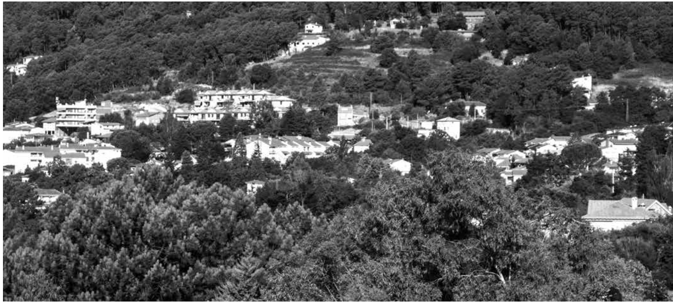
Villarejo del Valle.