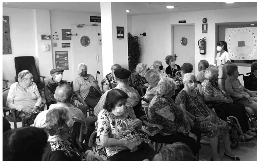
Entrenar la memoria y la sonrisa, el mejor truco para luchar contra el Alzheimer.

El 21 de septiembre se celebró el Día Mundial del Alzheimer. Este año, los organismos internacionales bajo el lema “InvestigAcción”, quisieron dar impulso a la importancia de la investigación como vía para acabar con una enfermedad que en España afecta a más de 5 millones de personas. Es una de las demencias más frecuentes entre los mayores y, por tanto, la celebración de su día internacional es una fecha de especial relevancia en nuestros centros. Además de realizar sesiones informativas