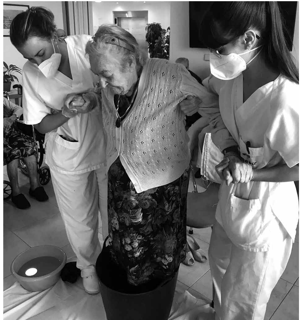
Pisando la uva en la fiesta de la vendimia.

Llega octubre y termina la época de vendimia. Después de muchos días de trabajo en las viñas, por fin la tierra ha dado sus frutos y este final se merece una fiesta. Por eso, en los pueblos de tradición vinícola se celebra con una fiesta, se pisa la uva y se ensalza el vino. En la residencia Amavir Cenicientos no podemos ser menos y celebramos la fiesta con mucho entusiasmo, además de que todo el que quiso pudo pisar la uva. Se hizo un concurso para ver cuál de todos era el que más zumo sacaba de este acto. Después de las risas, pero con mucha competitividad, una residente de centro de día resultó ser la ganadora de esta actividad y, por supuesto, tuvo su premio y un diploma por su victoria. Todos los participantes demostraron una gran habilidad en la pisada y lo hicieron con entusiasmo, pero solo podía ganar uno. Esta fiesta se celebra en la residencia todos los años y esta tradición cuenta cada vez con más seguidores que no quieren dejar pasar la oportunidad de recordar actividades de su juventud o de empezarla, que nunca es tarde. Como siempre pasamos una mañana muy divertida y estamos deseando repetirla.