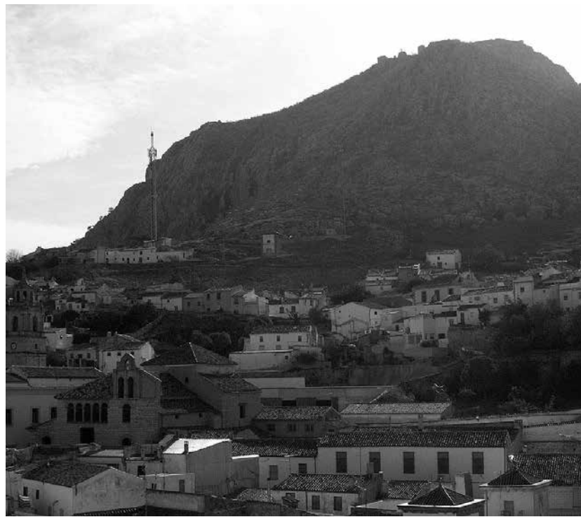
Vista de Martos y su famoso peñón.