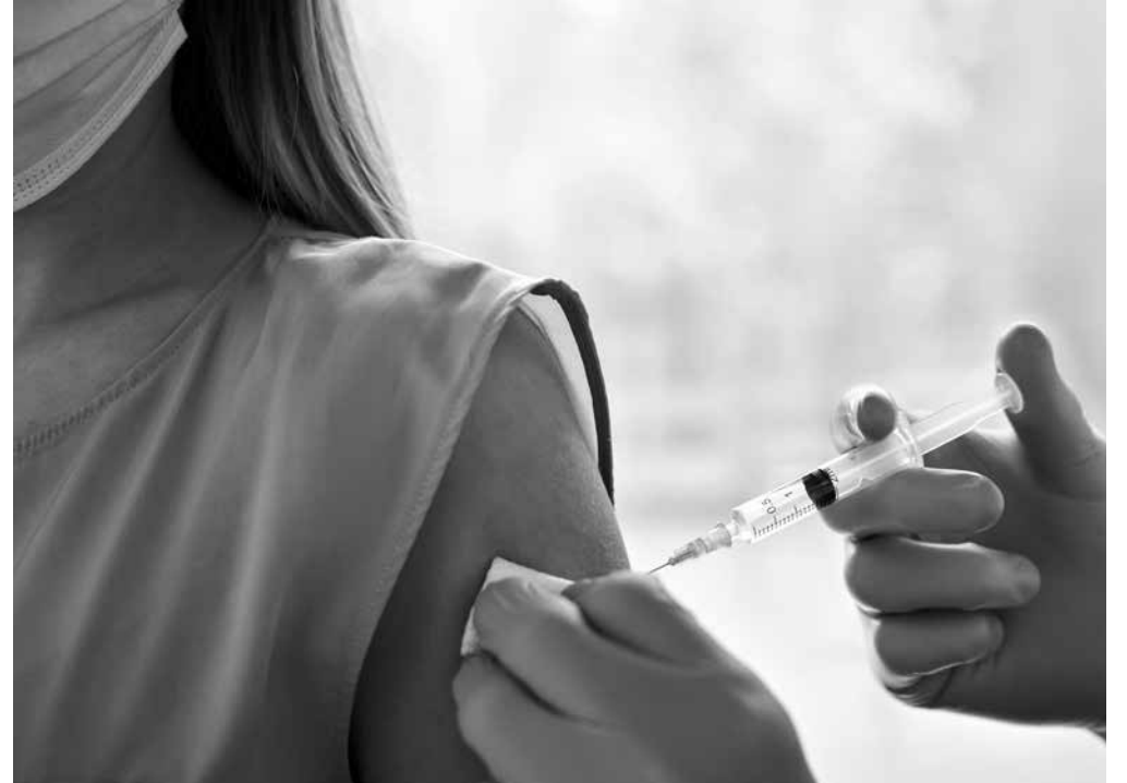
Una enfermera vacunando.

El Herpes Zóster es una enfermedad muy dolorosa y debilitante que es altamente frecuente en la población. Es causada por la activación del virus de la Varicela Zóster (VVZ). Afecta a los nervios y a la piel de un área del cuerpo. Es por esto por lo que se la conoce como 'la culebrilla'. El 95 % de los adultos tienen el virus en estado latente y de esos, 1 de cada 4 padecerá la enfermedad en algún momento de su vida, coincidiendo con una debilitación del sistema inmunitario. Esta situación afecta mucho a la calidad de vida, ya que causar dolor, insomnio, ansiedad y otras complicaciones secundarias. Existen antivirales y analgésicos que palian los síntomas, sin embargo, lo más recomendable en la tercera edad es administrar la vacuna contra el Herpes Zóster. Dado que este es el mejor tratamiento, la Comunidad de Madrid ha anunciado que se comenzará a vacunar a los ancianos progresivamente en función de su fecha de nacimiento hasta poder ampliar esta protección a todos. Según