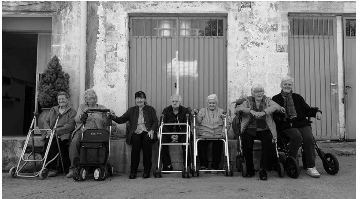
Nuestros residentes de excursión en la lechería.