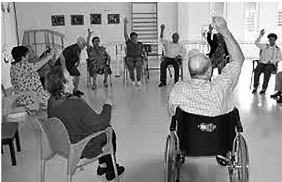
Los mayores manteniéndose activos en gerontogimnasia.

Realizar ejercicio de manera regular repercute en la mejora de salud a todos los niveles, tanto a nivel físico como mental. Entre los beneficios de la actividad física podemos destacar varios, por un lado, ayuda a fortalecer los músculos y mantener la agilidad para que logren mantener su autonomía en el día a día, protege de enfermedades cardíacas y refuerza su sistema inmune. Por otro lado, la actividad física también repercute favorablemente en la salud mental, mejorando cuestiones como el estado de ánimo, la autoestima y ayudando a disminuir la sensación de estrés o malestar. A su vez, también puede influir en la mejora del descanso y en la calidad del sueño. Por ello, es importante promover un envejecimiento activo, sobre todo en las personas mayores. Una forma buena de hacerlo es realizando todo tipo de actividad física, que será imprescindible para fomentar la salud y disminuir el deterioro de nuestros mayores.