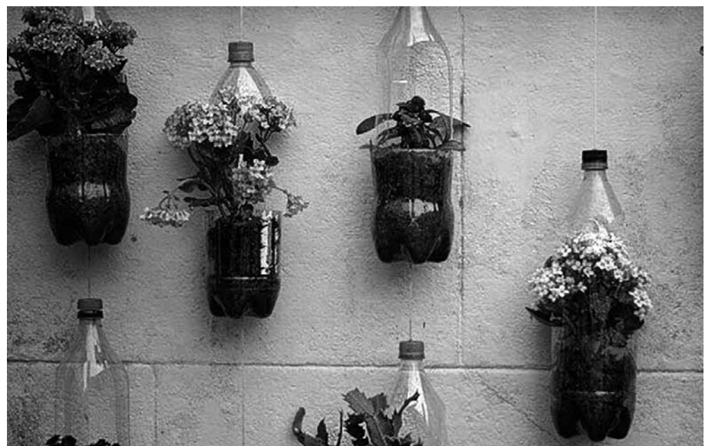
Nuestro jardín vertical hecho con botellas recicladas.

El pasado 24 de octubre realizamos varias actividades para la celebración del Día Mundial Contra el Cambio Climático. Días previos, los residentes elaboraron un jardín vertical usando materiales reciclados que había en la residencia como botellas de plástico y retales de lanas, esto nos sirvió para decorar la peluquería de nuestro centro. También realizaron una pancarta divulgativa con el cambio climático como temática, se habló sobre: ¿Qué es el cambio climático?, ¿cómo nos afecta?, ¿qué factores lo producen? o ¿qué factores lo frenan? Todos estuvimos de acuerdo en que el cambio climático es una realidad que ya nos está afectando a todos.