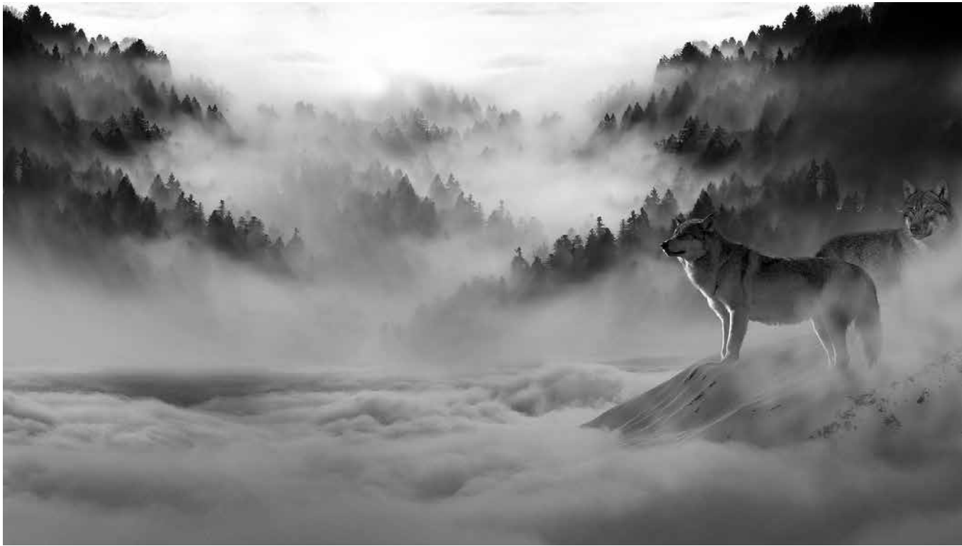
Leyendas de época.