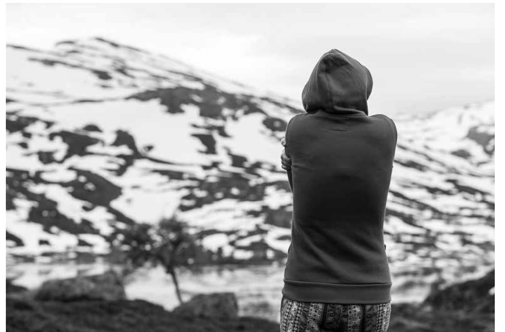
El frío ya está aquí.

La llegada del frío es la época donde los mayores pueden sufrir determinadas enfermedades como resfriados y gripe. Los cambios bruscos de temperatura y el hacinamiento, favorecen el contagio y el desarrollo de enfermedades básicamente infecciosas a la vez que se ven agudizadas las enfermedades respiratorias, cardíacas y osteoarticulares. Las bajas temperaturas disminuyen los sistemas naturales de defensa, afectan el sistema endocrino, a la secreción de la hormona tiroidea y se produce un aumento de adrenalina. Las necesidades energéticas disminuyen con el envejecimiento debido a un menor metabolismo basal que utiliza un mínimo de energía para realizar las funciones vitales esenciales y, sobre todo, a una menor actividad física. Algunas recomendaciones son salir por la mañana, en horas centrales del día, que es cuando más calor hace. Ventilar unos 10 minutos la casa. Tener compañía; los mayores no salen ni se relacionan, y esto puede provocar alteración en el sistema