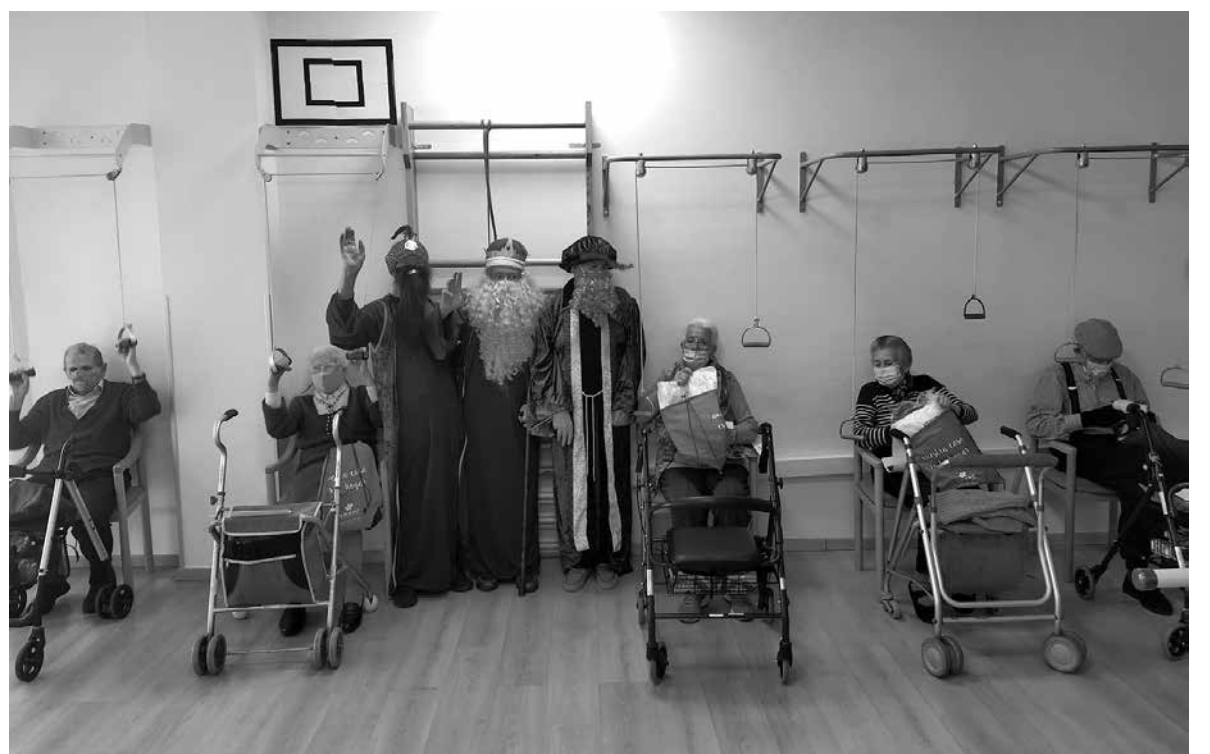
Los Reyes Magos en Alcorcón.

¡Ya casi estamos de nuevo en Navidad! Este año esperamos volver a tener todas las actividades y actuaciones como antes de la pandemia. Volveremos a dar colorido a la residencia en esta época que nos gusta tanto. Vamos a intentar pasarlo lo mejor posible todos juntos y realizar alguna salida por Madrid. A la vez, esperamos que todos os hayáis portado bien y que los Reyes Magos nos puedan traer unos magníficos regalos, pero sobre todo para estas Navidades, os deseamos que seáis muy felices con los vuestros y muchas salud. Y si nos toca la lotería... ¡Pues mejor aún!