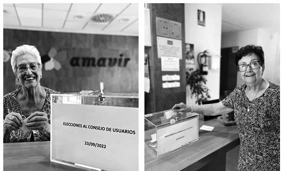
Acudimos a votar para formar el consejo de usuarios.