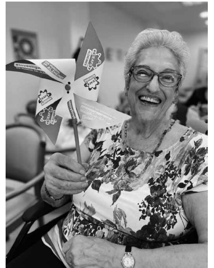
"InvestigAcción", hoy por mi mañana por ti.

Alzheimer, para llevarte mi bien más preciado: mi memoria. Lo que tú no sabías es que el amor de mi cuidador es más fuerte que tus zarpazos letales." Estas son algunas frases que definen el Alzheimer, una enfermedad neurodegenerativa que supone la forma más común de demencia, representando hasta el 70% de los casos totales, y que afecta en España a 1.200.000 personas. Para conmemorar este día tan importante, quisimos sumarnos a la campaña impulsada por CEAFA (Confederación Española de Alzheimer) para reivindicar el valor de la investigación sobre esta enfermedad, bajo el lema "InvestigAcción", y ayudar a encontrar soluciones que mejoren la