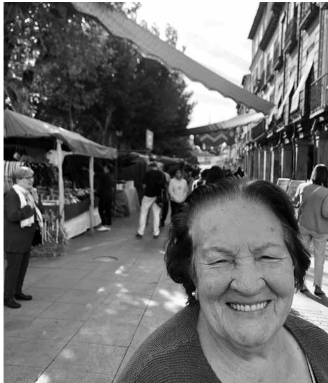
Viajamos al pasado por las calles del casco histórico.

El mercado medieval de Alcalá de Henares, llamado realmente mercado cervantino, recibe su nombre en honor al día 9 de octubre, fecha en la que se conmemora el bautismo de Miguel de Cervantes y, por lo tanto, rinde homenaje al ilustre escritor. Durante cinco días, la ciudad del Quijote se transforma y se llena de magia, haciéndonos viajar en el tiempo al siglo de Oro. En estas fiestas tan conocidas no solo para los alcalaínos, sino también para cualquier persona amante del ambiente medieval, podemos disfrutar de diferentes actividades desde un pasacalle de apertura con Don Quijote y Sancho, acompañado por diferentes