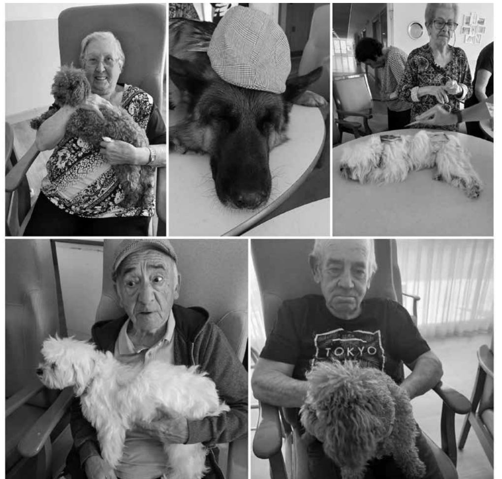
Nuestros mayores con unos visitantes muy peludos.