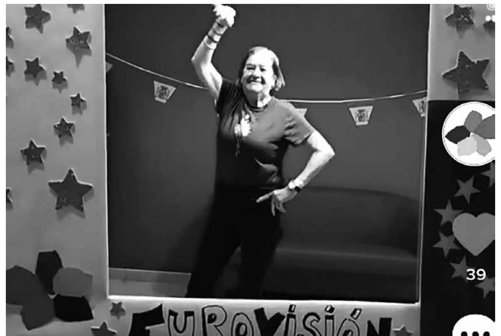
Nuestros residentes bailando al son de SloMo en Eurovisión.

El pasado 14 de mayo España se presentó al festival de Eurovisión con el tema SloMo quedando terceros como ya todos sabéis, siendo el mejor resultado según se ha publicado desde hace 27 años. En Amavir Villaverde intuíamos este buen resultado y, en apoyo a nuestra cantante y a la canción, nuestros mayores, tanto de residencia como de centro de día, se convirtieron en bailarines de primera para crear nuestro propio Tik Tok con un guiño a la coreografía de Chanel. Fue muy divertido poder bailar al ritmo de la música tan marchosa. Nos echamos unas risas y pudimos comprobar que tenemos entre nosotros a grandes artistas que, con mucho salero y desparpajo, participaron estupendamente.