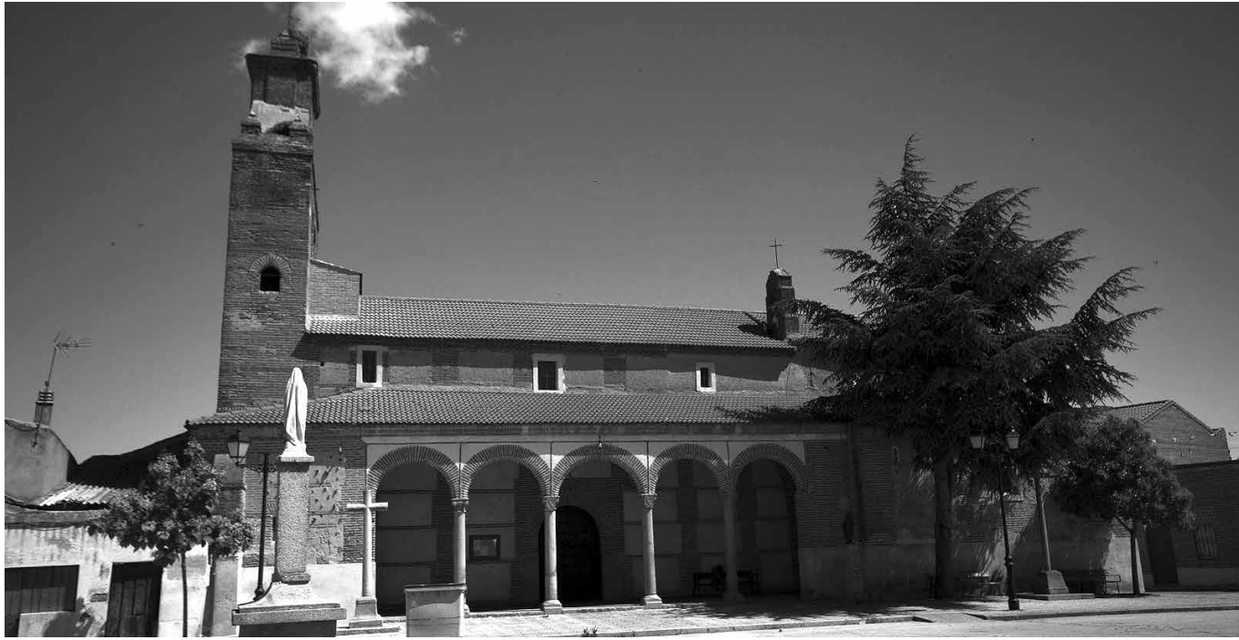
La parroquia de Nava de Arévalo.