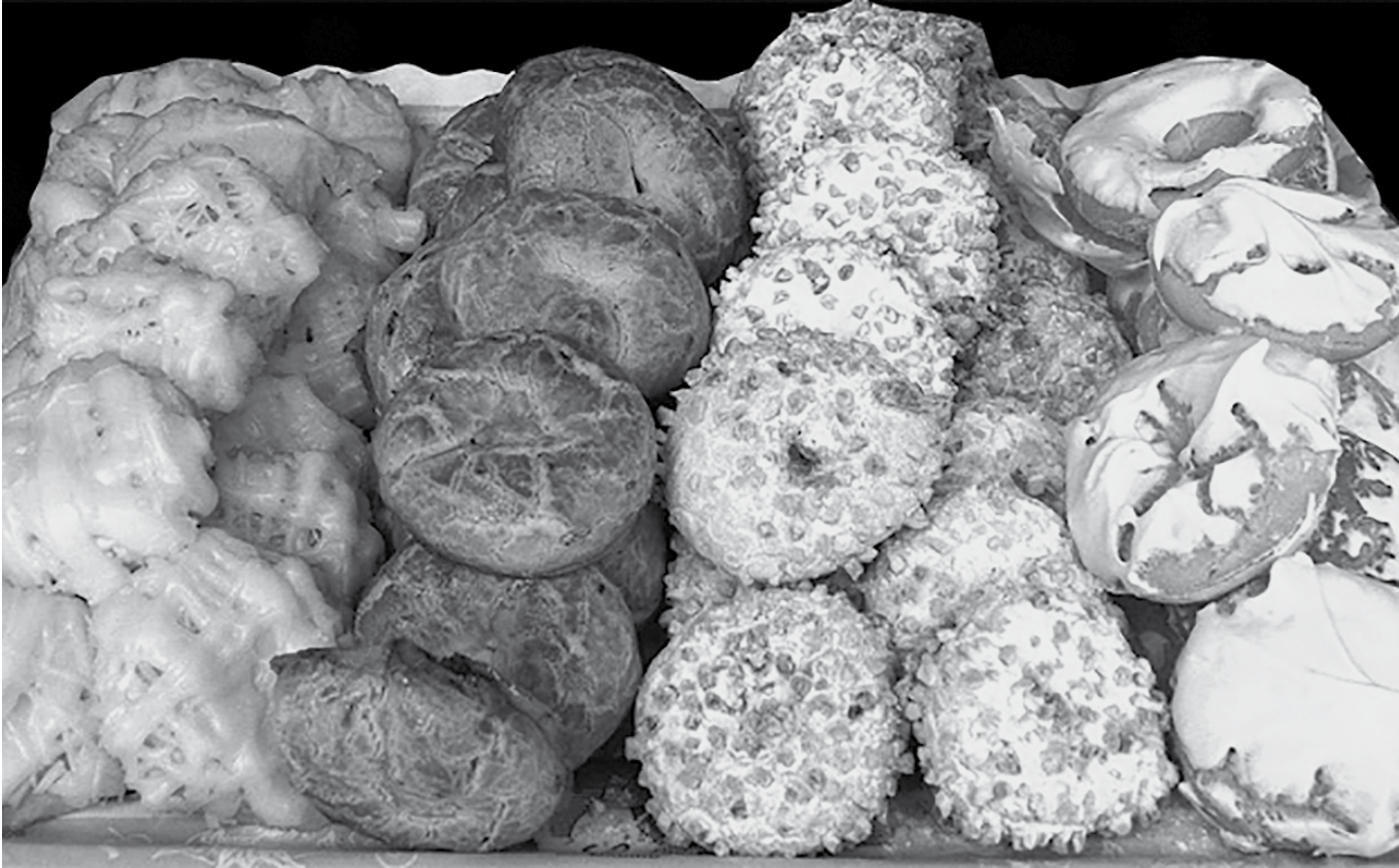
Rosquillas listas, tontas, francesas o de Santa Clara.

El 15 de mayo, en Madrid, se celebra el día de San Isidro. Los madrileños van a la pradera a pasar la tarde y a comer. El dulce tradicional en Madrid son las rosquillas, que pueden ser listas, tontas, francesas o de