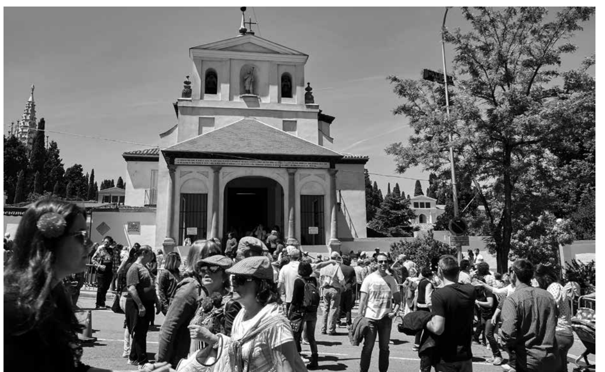
Capilla de San Isidro Labrador.

San Isidro Labrador es un santo madrileño, patrón de la ciudad. Isidro era un Labrador que vivió en Madrid entre el 1082 y el 1172 en el barrio de La Latina. La Iglesia le atribuye un total de 438 milagros, entre ellos el de elevar las aguas del pozo en el que se encontraba su hijo. ‘La olla de San Isidro’ es como se conoce a otro de sus milagros: “cada año organizaba