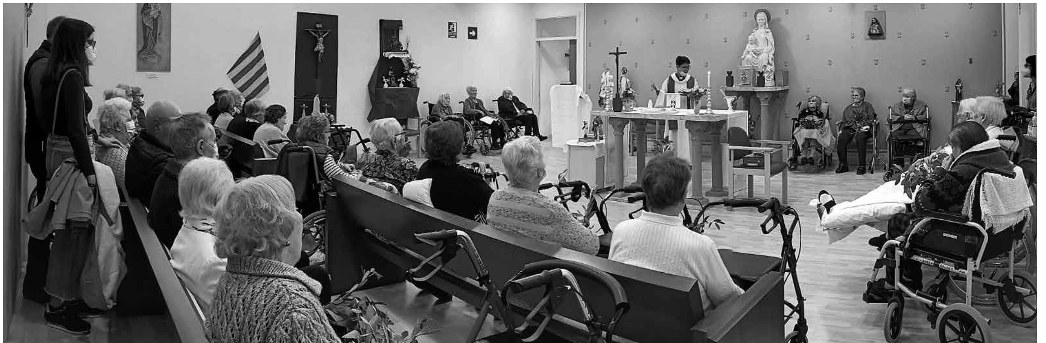
Aforo completo en la misa del Domingo de Ramos.

Tras dos años de restricciones impuestas por la pandemia se reanudan las misas semanales.