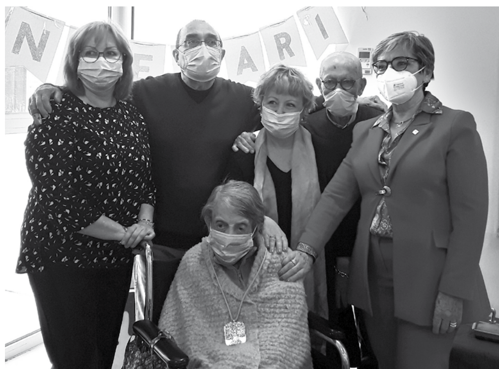
Nuestra centenaria con su medalla acompañada de su familia y la Consellera