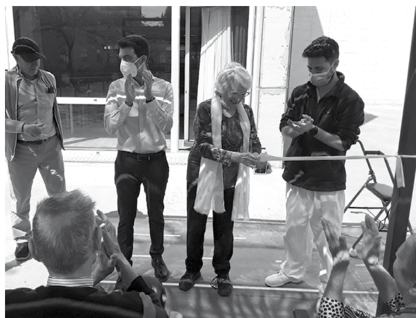
Nuestro director cortando la cinta con dos residentes del centro y un fisioterapeuta.

Con motivo de la llegada al centro de nuevas carpas para el jardín, creamos una actividad a modo de inauguración, donde realizamos varios juegos deportivos en el jardín acompañados con música. En primer lugar, comenzamos con el acto de inauguración. En este, una residente voluntaria en compañía de nuestro director cortó la cinta y quedaron oficialmente inauguradas las nuevas carpas del centro. Estas nos darán más sombras en los meses donde el sol aprieta. Acto seguido se realizaron actividades deportivas según las habilidades y preferencias de cada uno y finalizamos la jornada con música y baile. Salir al aire libre, tomar el sol y el baile tuvieron muy buena aceptación.