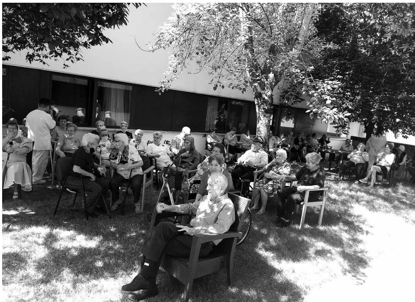
Nuestros mayores disfrutando del buen tiempo en la fiesta.

Este año las pañoletas, los claveles y los trajes de chulapa vuelven con toda su fuerza a nuestro centro, para alegrar el ritmo de chotis a todos nuestros residentes. Como no podía ser de otra manera, celebramos nuestra verbena de San Isidro en el jardín principal, amenizado con música y con un gran aperitivo. No faltó la tradicional limonada y la tortilla de patata. La verbena estuvo animada por todos los profesionales de la residencia, así como por todos los residentes que nos acompañaron en esta fiesta. Durante la fiesta hubo bailes de los más castizos de Madrid, tanto que nuestros residentes y familiares no dudaron en bailar dándonos lecciones de buen hacer a los más jóvenes. El sol