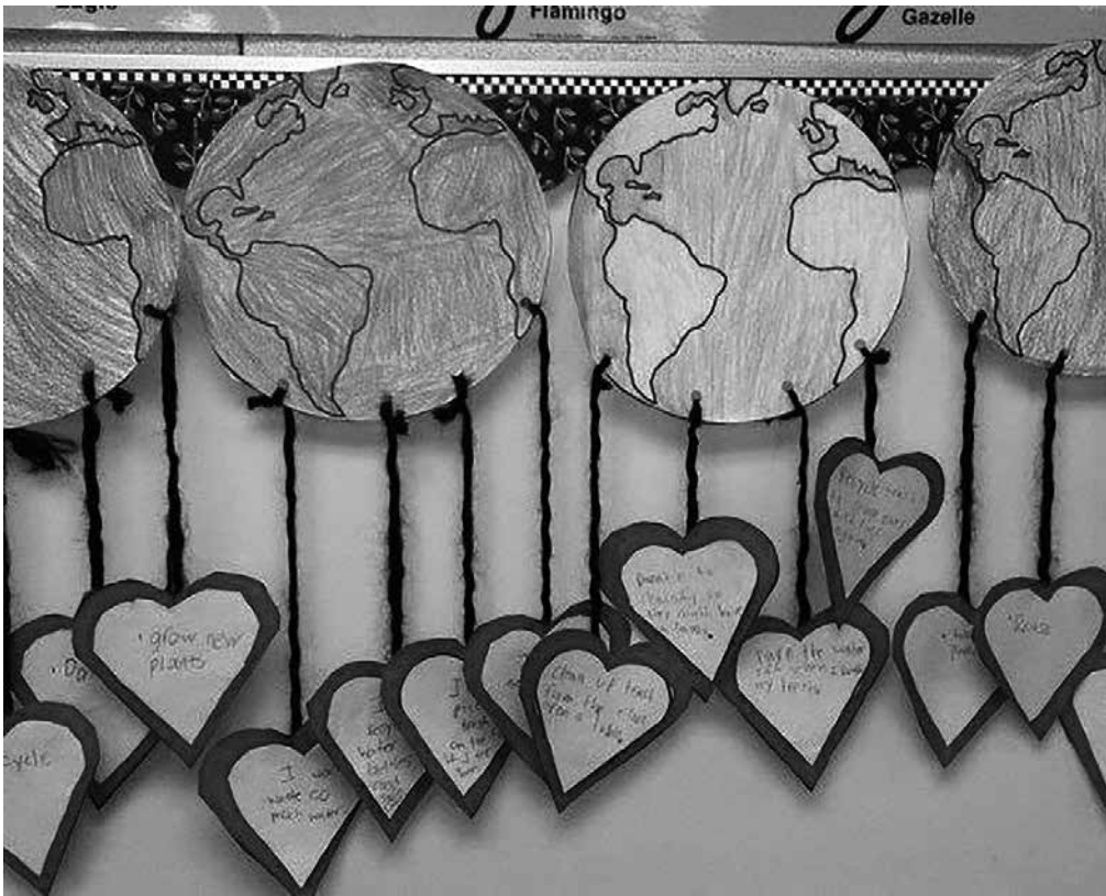
La manualidad realizada en el Día del Medioambiente.

Según las Naciones Unidas, “durante demasiado tiempo, hemos estado explotando y destruyendo los ecosistemas de nuestro planeta. Cada tres segundos, el mundo pierde una superficie de bosque equivalente a un campo de fútbol y, tan solo en el último siglo, hemos destruido la mitad de nuestros humedales. El 50% de nuestros arrecifes de coral ya se han perdido y para 2050, podrían desaparecer hasta el 90%, incluso si el calentamiento global se limita a un aumento de 1,5°C.” Está claro que el ser humano está destruyendo el planeta y sus recursos. Debemos ser conscientes y hacer pequeños cambios en nuestro día a día para que la situación mejore. Por ello, desde Amavir Horta queremos reivindicar y luchar por un mundo más sano y responsable. Durante unas semanas estuvimos elaborando la manualidad para dar lugar y visibilizar este día. Los residentes dibujaron, pintaron y recortaron el planeta tierra. Posteriormente plastificaron los dibujos e hicieron plantillas de corazones para recortar. También le hicieron unos agujeros en la parte inferior de la circunferencia para unir los hilos atados a los corazones. En