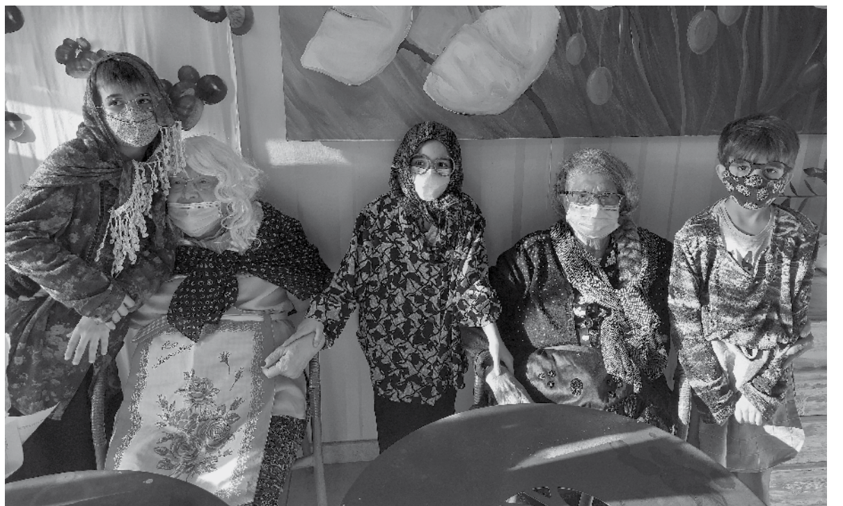
Mayores y pequeños participan en una actividad intergeneracional.

La compañía lleva celebrando desde hace ya más de 17 años estos campamentos de verano. Aproximadamente 15-20 niños y niñas por cada centro, con edades comprendidas entre los 6 y 12 años, disfrutan durante una semana de diferentes actividades educativas y de ocio junto a las personas mayores que residen en Amavir. Comparten desayunos y comidas entre residentes y niños, hacen gimnasia, participan en yincanas, bingos, excursiones, talleres creativos o realizan juegos deportivos, son ejemplos de las muchas actividades que se realizarán en Amavir Horta. Los horarios de los residentes son respetados en todo momento para su descanso y normalidad, sin embargo, contar con la alegría de los más pequeños durante unos días supone para todos una experiencia inolvidable. Está demostrado que las personas mayores implicadas en actividades intergeneracionales se sienten más felices. Además, compartir con los más pequeños su jornada diaria incrementa su actividad física, cognitiva y social, promoviendo el envejecimiento activo y saludable. Para los más pequeños, estas actividades son también una lección de vida de la que aprenden sobre las experiencias de los ma-