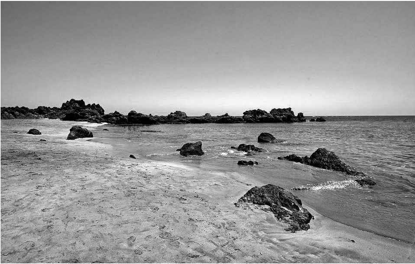
Playa Chica en Puerto del Carmen.