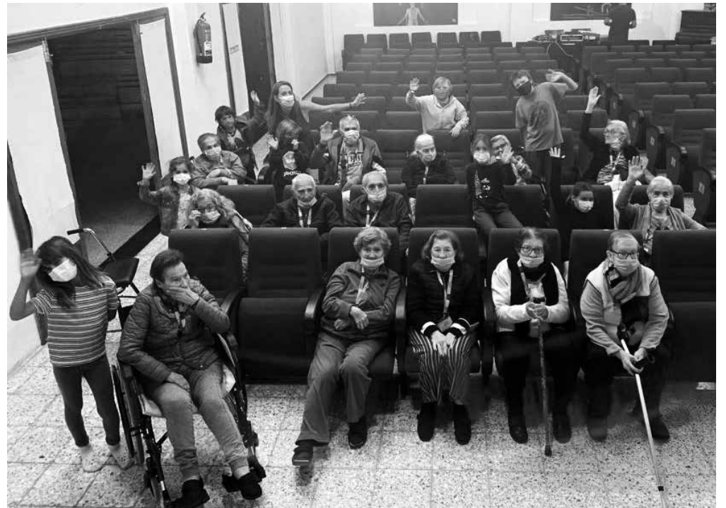
Nuestros residentes y el alumnado de CEIP La Mercedes compartiendo momentos.

El pasado 25 de marzo un grupo de nuestros residentes asistió a los ensayos abiertos de la compañía Cuerpo Teatro con motivo de la celebración del IV Festival del Teatro Escolar. Nuestros mayores disfrutaron de manera exclusiva del montaje escénico en el que se encontraba trabajando el CEIP Las Mercedes con la obra “¿Dónde?”, un universo mágico conducido a través de la música en directo, las luces, las sombras y la danza. La finalidad de esta actividad se centró en fortalecer la confianza del alumnado ofreciendo al público la posibilidad de conocer de primera mano el trabajo creativo que están desarrollando. Por ello, al finalizar la representación, nuestros mayores charlaron con el grupo de artistas sobre lo acontecido en el escenario generando, además, sinergias intergeneracionales y culturales. Fue toda una experiencia enriquecedora y fascinante que no nos dejó indiferentes. ¡Gracias por la invitación!