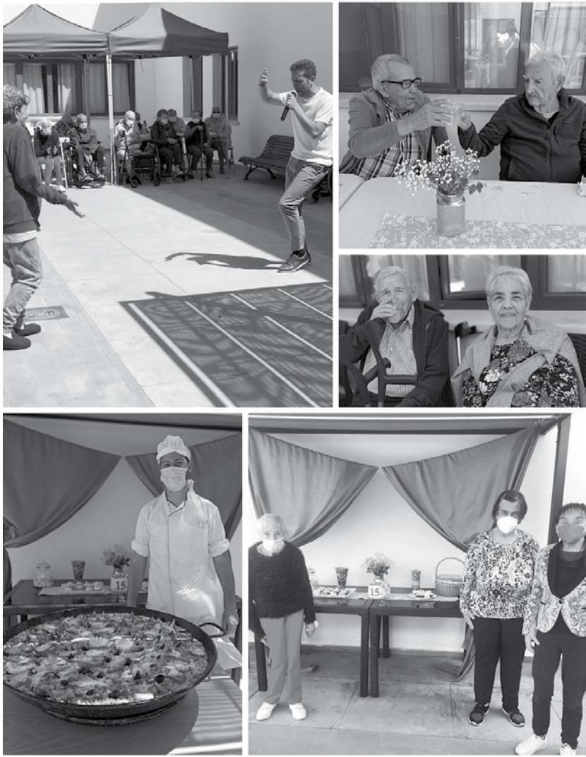
Nuestros mayores disfrutando de la celebración del 15º aniversario.

Al realizar un repaso de estos últimos 15 años se nos vienen muchas anécdotas a la cabeza. Rememoramos buenos momentos en los que nuestros mayores son los verdaderos protagonistas, historias, amistades y lazos que perdurarán para toda la vida entre residentes, trabajadores y familiares. Nos sobran razones y muchas ganas de celebrarlo por todo lo alto, así que nos pusimos manos a la obra. El resultado fue una semana repleta de actividades que tuvo una gran fiesta como colofón final. También visitamos el Mirador del Río, donde pudimos apreciar unas maravillosas vistas panorámicas y recibimos la visita de dos agrupaciones musicales, el Coro Iris del Mar y El Cribo Canta, quienes nos hicieron disfrutar de las canciones que nos traen los recuerdos más bonitos. Para terminar la semana del 15º aniversario, nuestros residentes, usuarios de centro de día y trabajadores nos vestimos de gala para recibir a Daniel Moisés y a su repertorio musical que tanto nos gusta. Asimismo, disfrutamos de un picoteo antes de dar paso a la gran paella que puso punto y final a una semana en la que no faltaron las sonrisas.