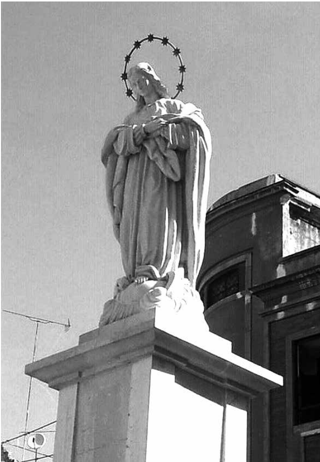
El monumento a la Inmaculada Concepción.

El monumento de la Inmaculada Concepción es uno de los más significativos de nuestra ciudad, está situado en la Plaza de Risueño, también conocida anteriormente como de los Caballos. La plaza atribuye su nombre al doctor cartagenero Benigno Risueño de Amador. En el año 1954 se celebró el centenario de la proclamación del dogma de la Inmaculada, y Cartagena decidió vestirse de gala con numerosos actos para conmemorar el evento, como la procesión nocturna del Rosario. Para ello, se creó una comisión organizadora, la Junta del Centenario de la Inmaculada. Dicha comisión propuso al Ayuntamiento la erección del monumento como fin de la festividad, con la posterior aceptación. Hubo cierta polémica con la ubicación y finalmente se eligió la plaza de Risueño por su tamaño y por el bajo presupuesto disponible. Ante esto, se pidió a los ciudadanos y empresas que colaborasen económicamente con la imagen para poder